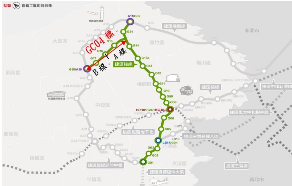
圖 2 綠線路網圖

113年1月30日已公告上網「桃園捷運綠線GC04B標G17站至G18站高架段土建統包工程」，預算金額58億2754萬3,804元，等標期為60日，於113年4月1日開標。