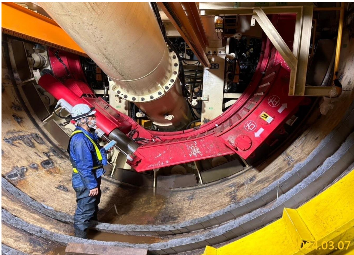
G03 站南井下行線潛盾機組裝測試