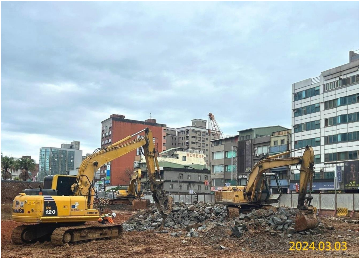
G04 出入口 B 淺挖施作