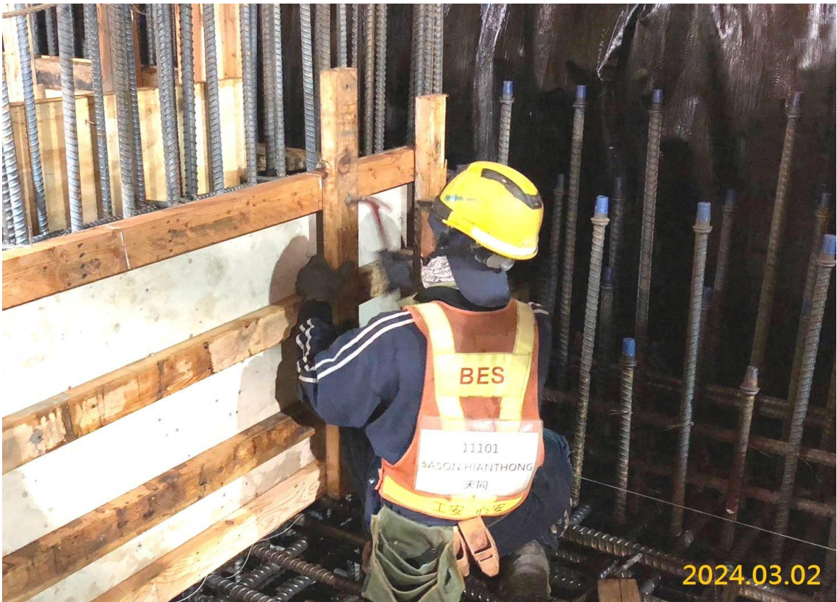
VS5 通風豎井結構體施作