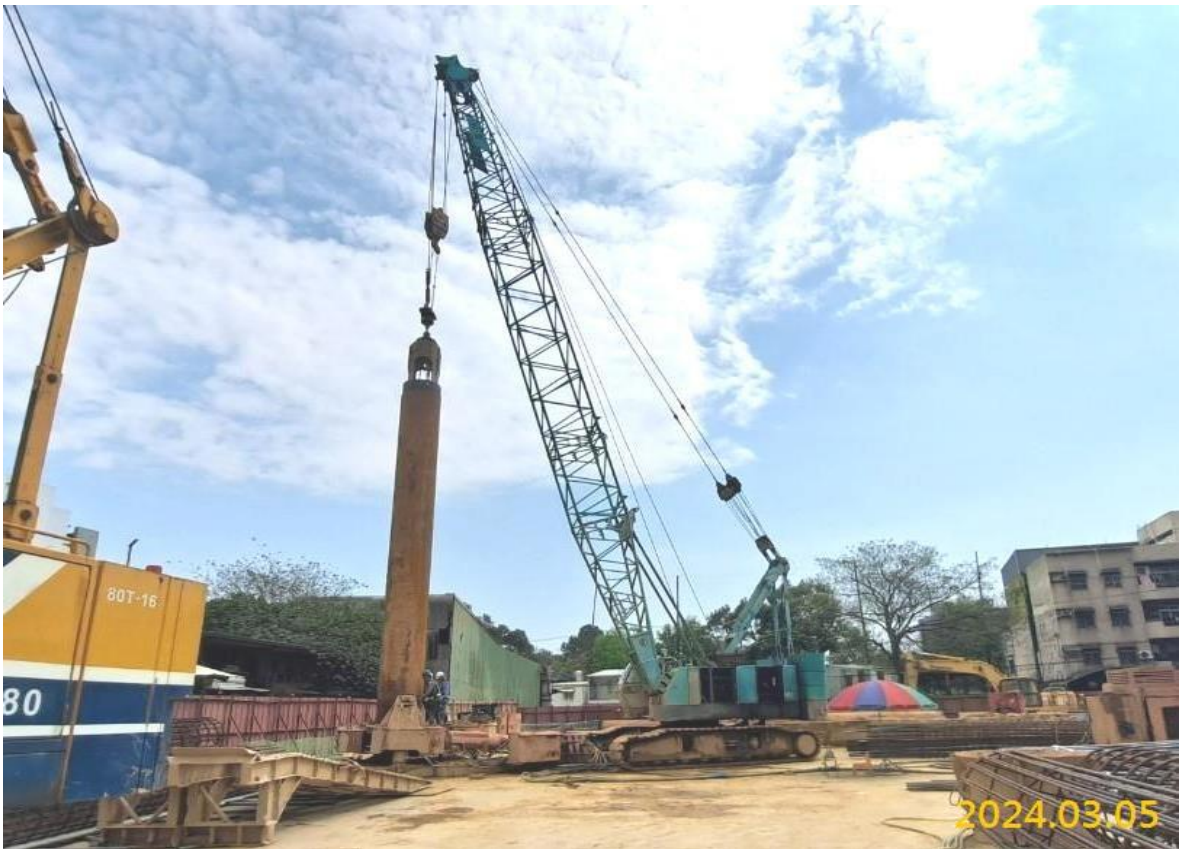
G04 出入口 C 中間柱施作