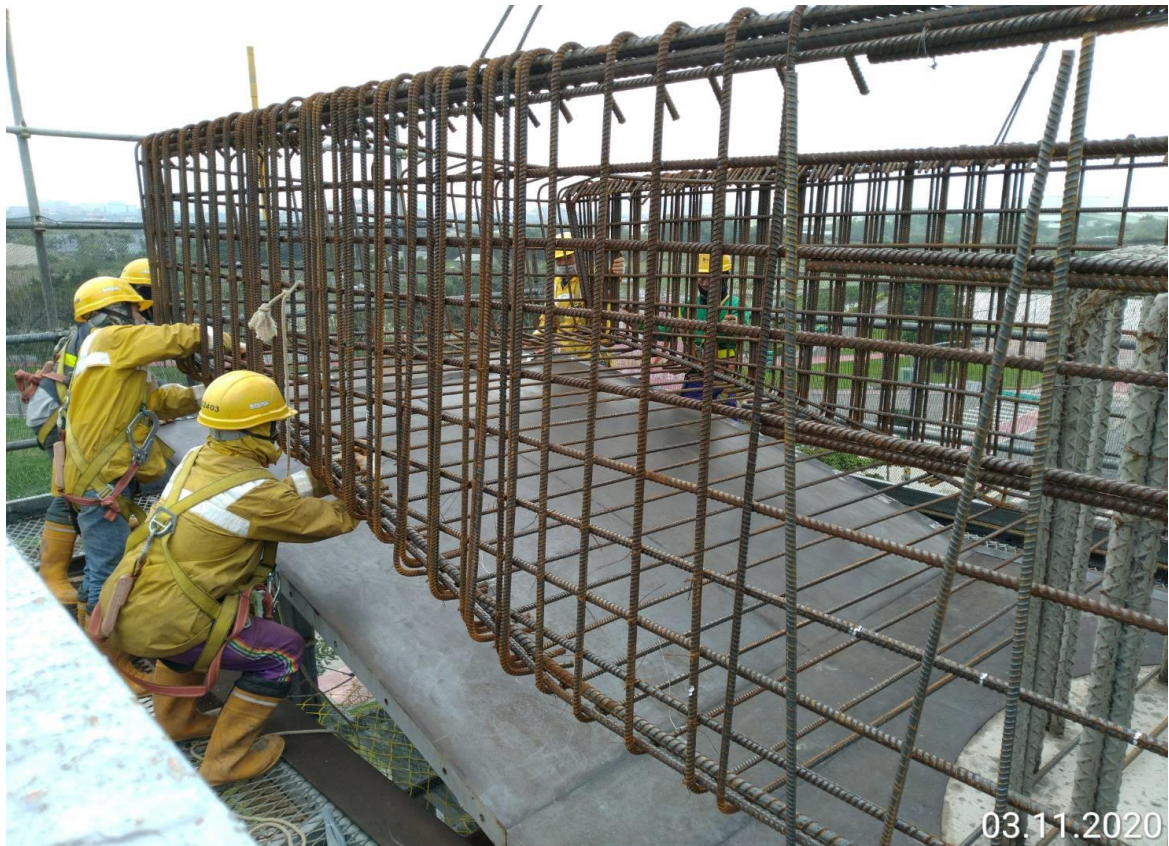
八德建德路 帽梁鋼筋綁紮