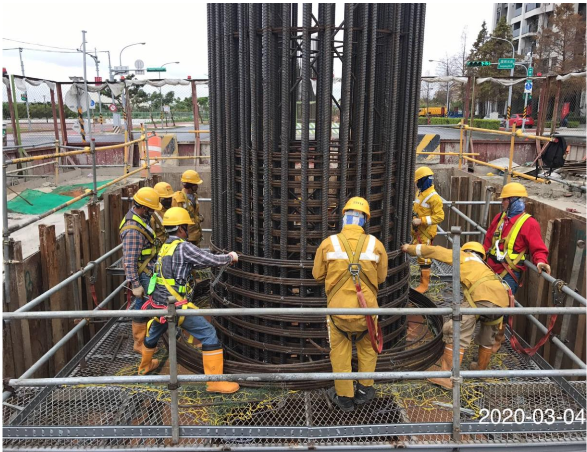
八德建德路 墩柱第二層鋼筋綁紮