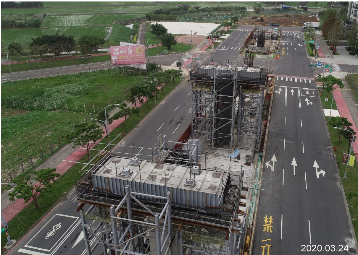
八德建德路 帽梁施作完成