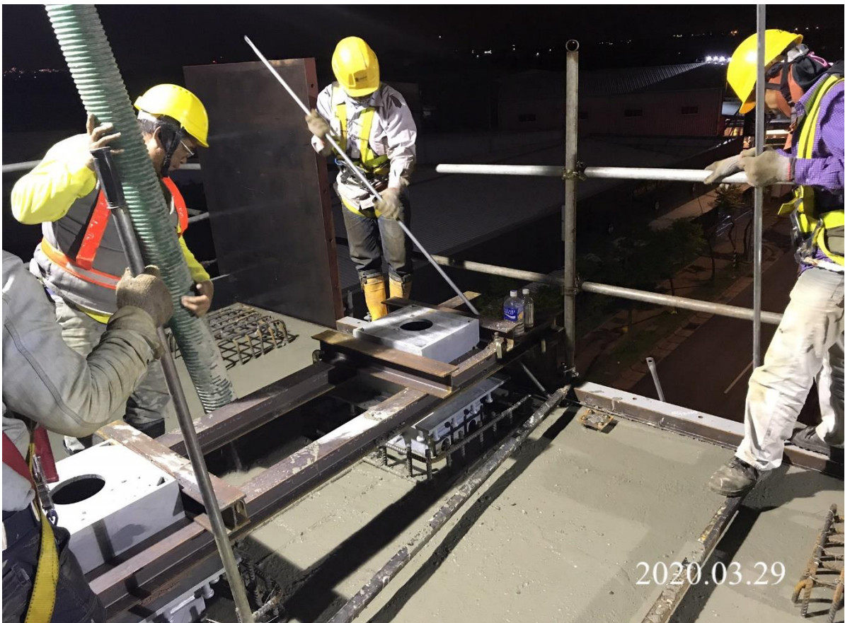
蘆竹中正北路 帽梁混凝土澆置