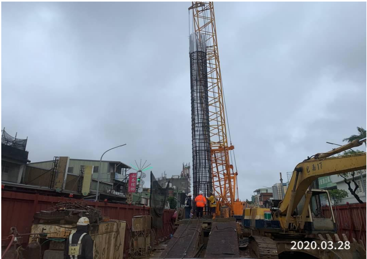
蘆竹中正北路 基樁鋼筋籠吊放