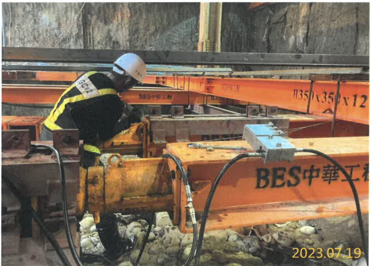
VS5 通風豎井支撐架設