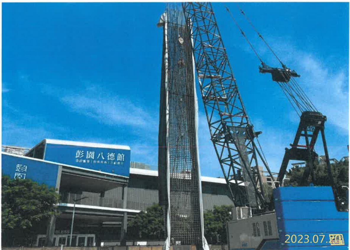
VS4 通風豎井連續壁施作