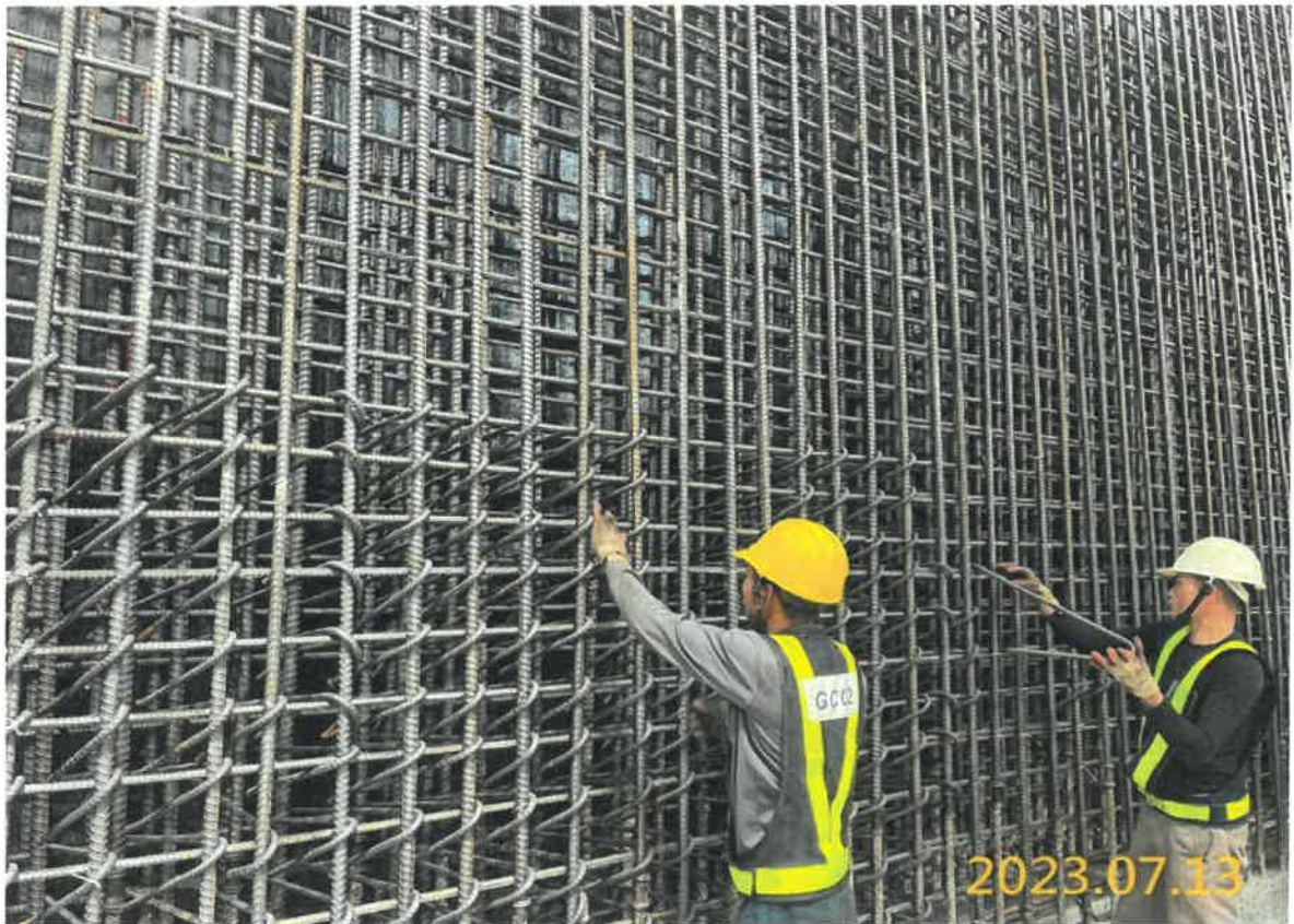
G03 站結構體鋼筋綁紮