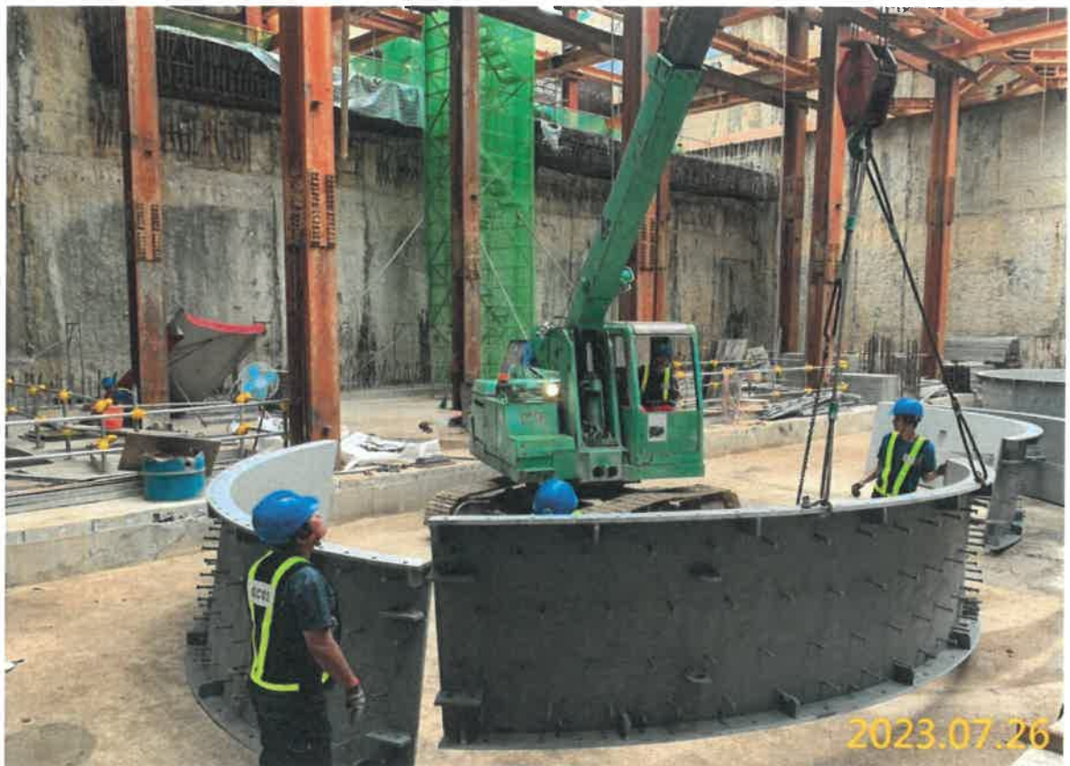
VS6 通風豎井潛盾隧道坑口環組立