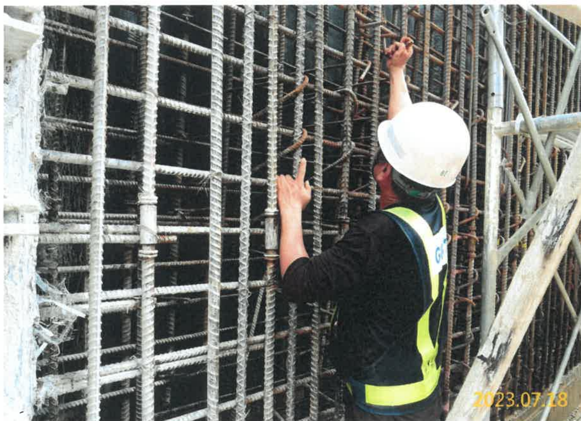
南出土段結構體鋼筋綁紮