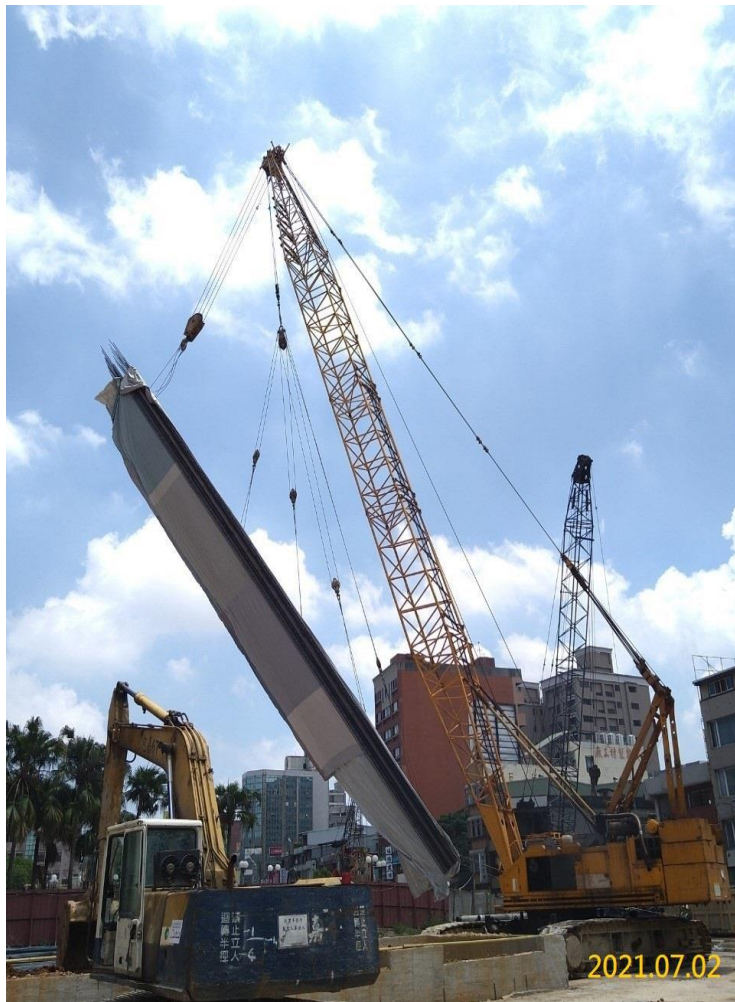
G04 站連續壁鋼筋籠吊放