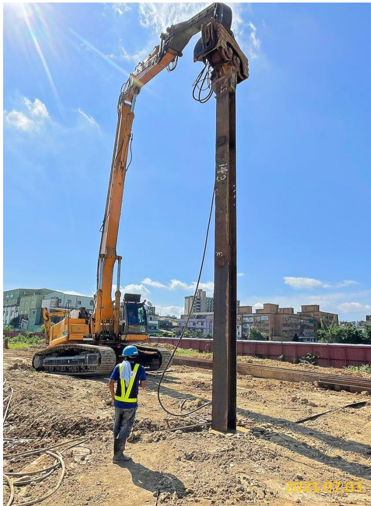
南出土中間柱打設