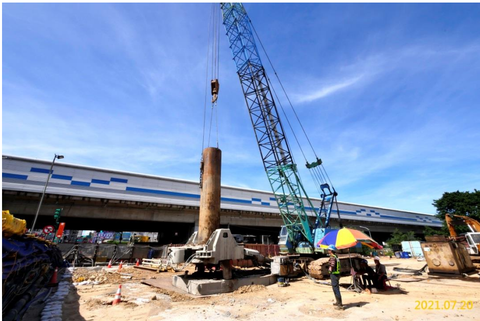
VS5 通風豎井中間柱施作