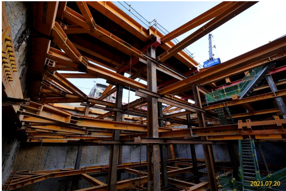
VS6 通風豎井開挖支撐施作