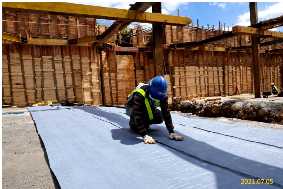
南出土結構體單元防水膜鋪設