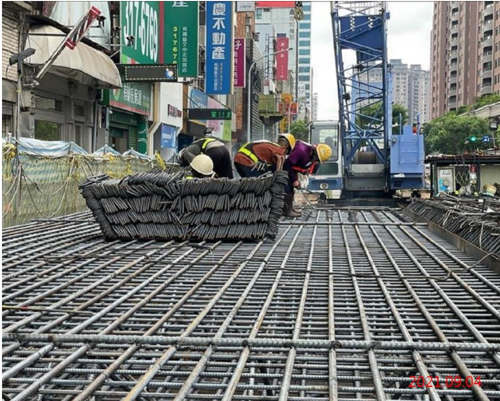
G10 站_連續壁單元鋼筋籠施作