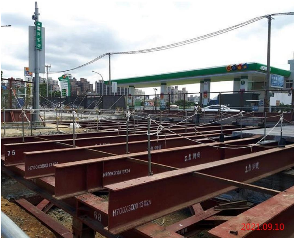
G12 站_站體東側覆工系統施作