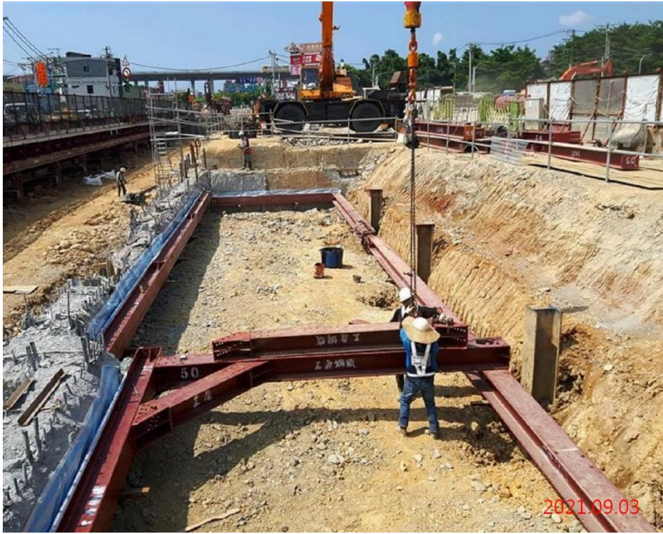
G12 站_站體東側及 A 區出入口支撐系統施作