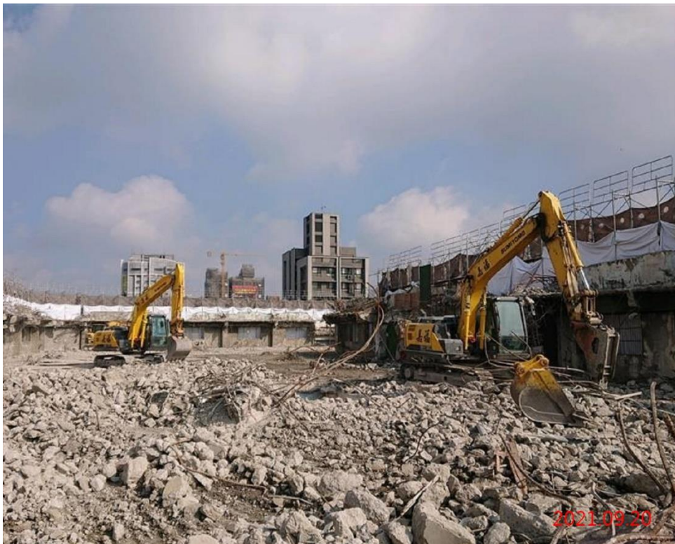
G08 站_5F 牆、版結構拆除