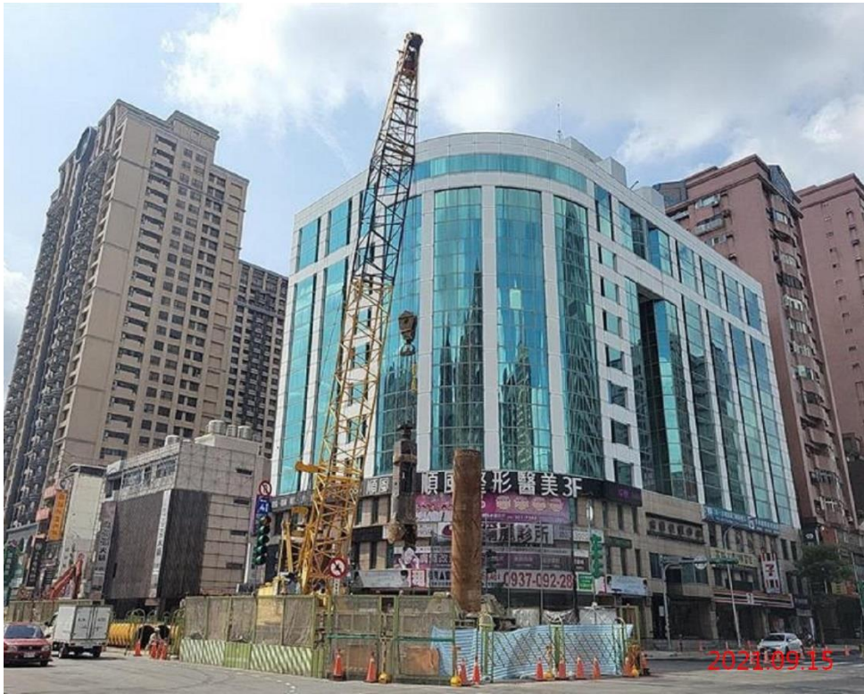
G10 站_站體中間柱抓掘施作