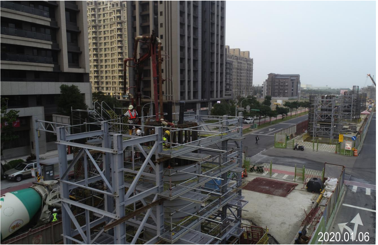
八德建德路 墩柱第三昇層混凝土澆置