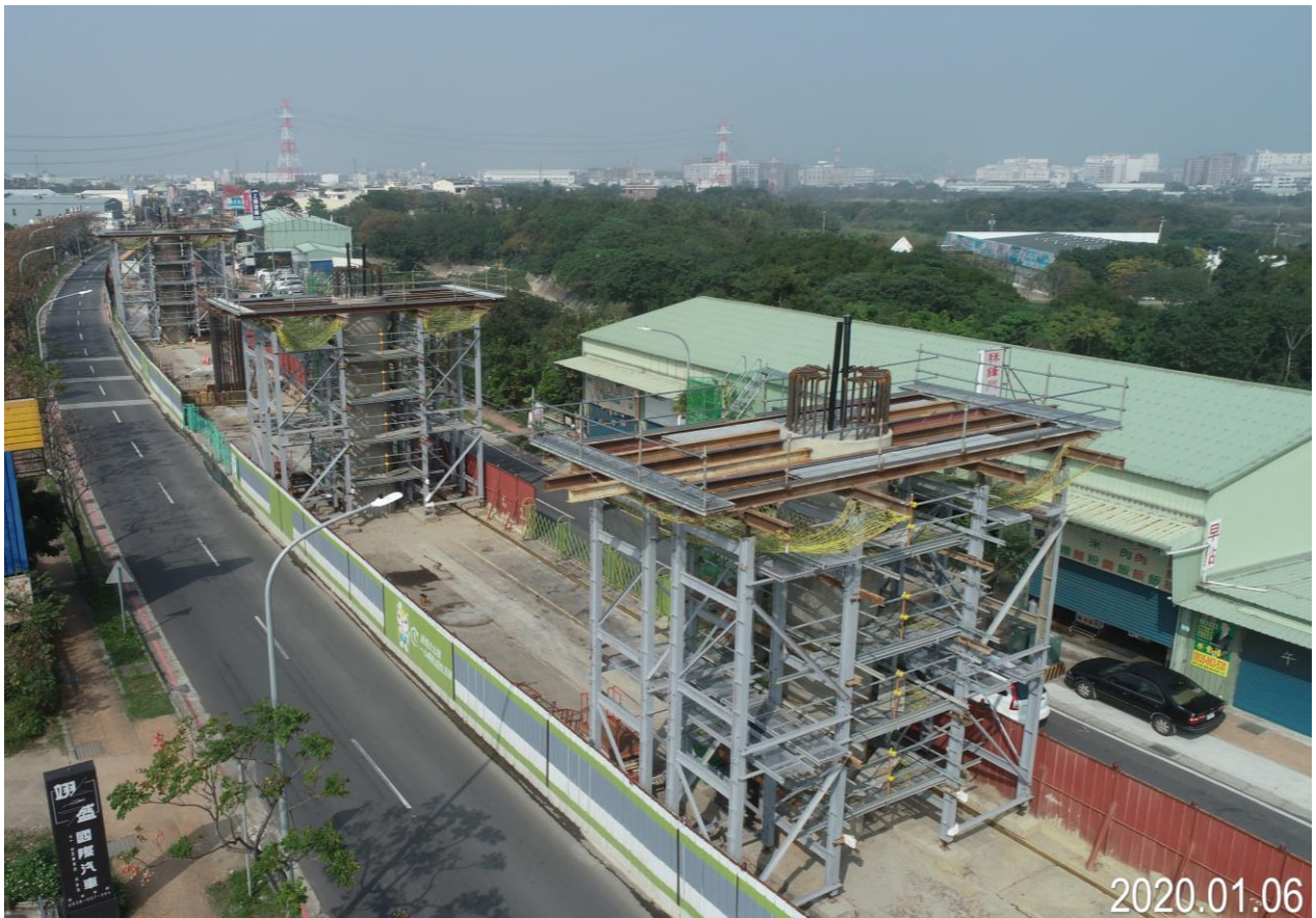
蘆竹中正北路 墩柱施工架搭設完成