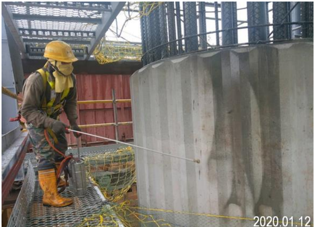
蘆竹中正北路 墩柱第二層養護