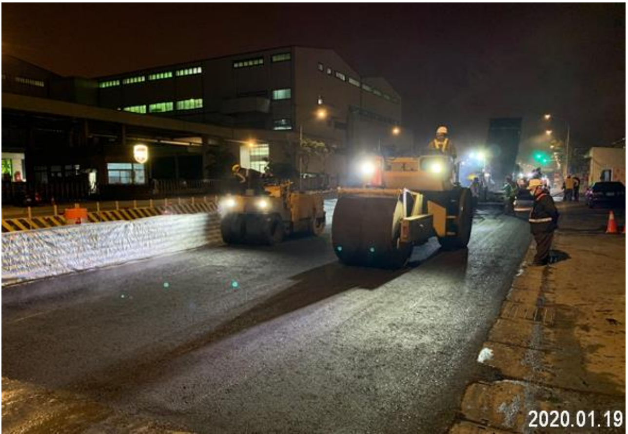
蘆竹中正北路 春節前道路創鋪作業