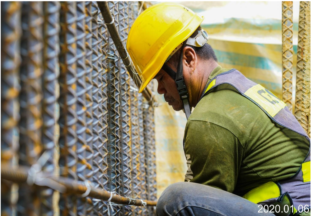
八德建德路 樁帽鋼筋綁紮