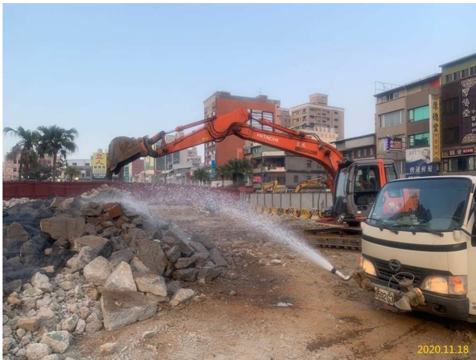
G04 站(介壽路原大和休閒廣場)地上物清除