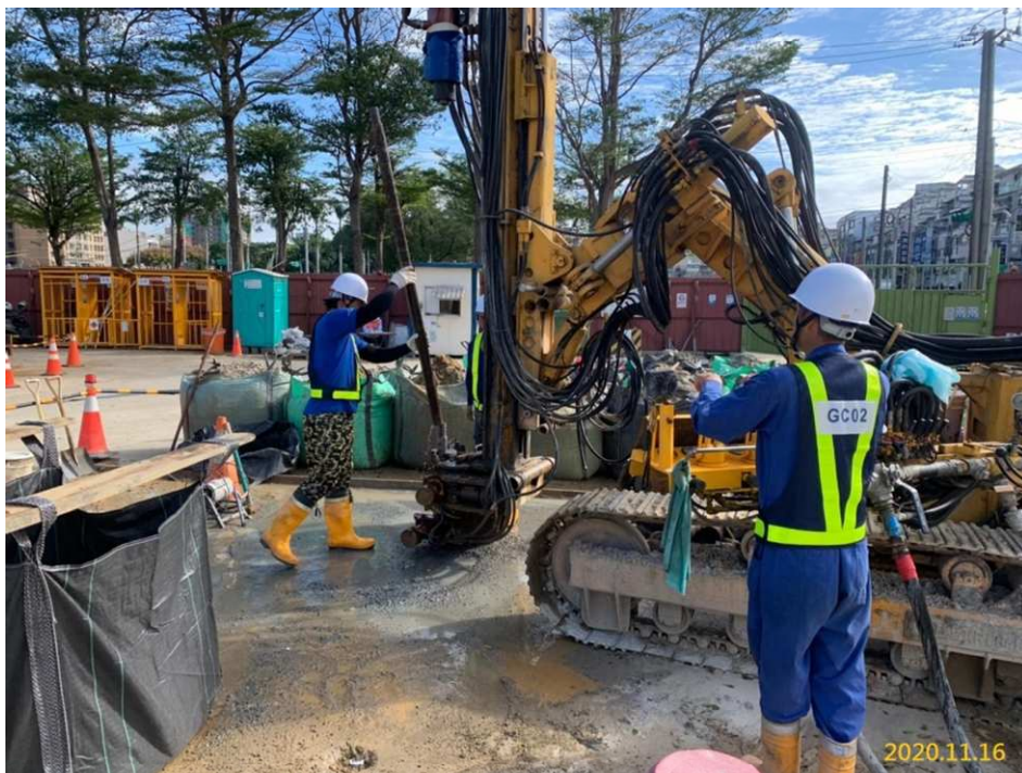
VS6 通風豎井(福豐公園)北側(發進端)上、下行線地盤處理鑽孔施作