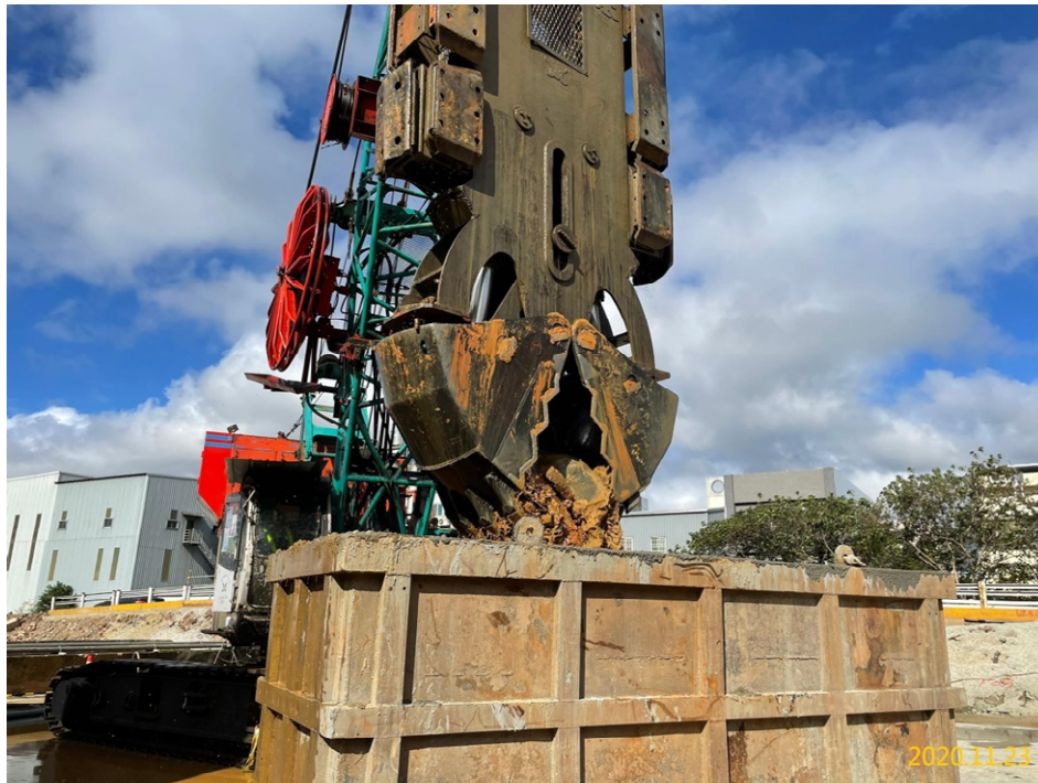
南出土段(溝後街附近)連續壁單元施作