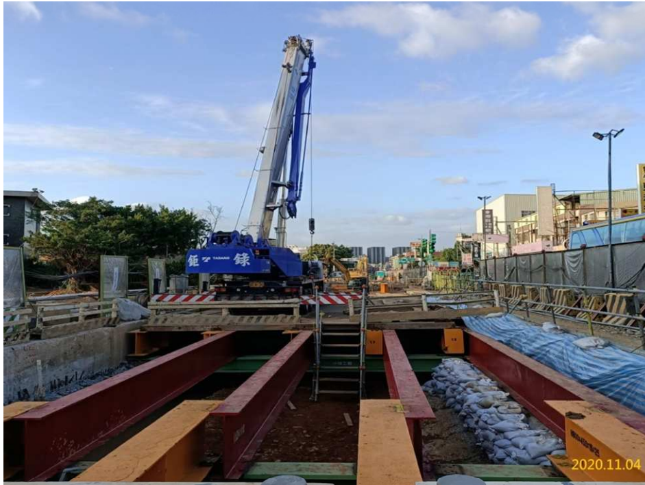
G03 站(巧克力街附近)覆蓋支撐系統架設