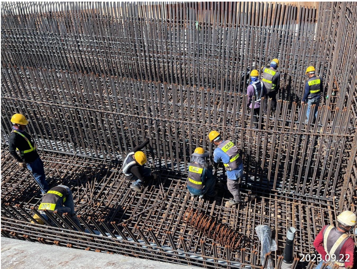
DU14-08 第一階段底腹版鋼筋綁紮,預力套管安裝