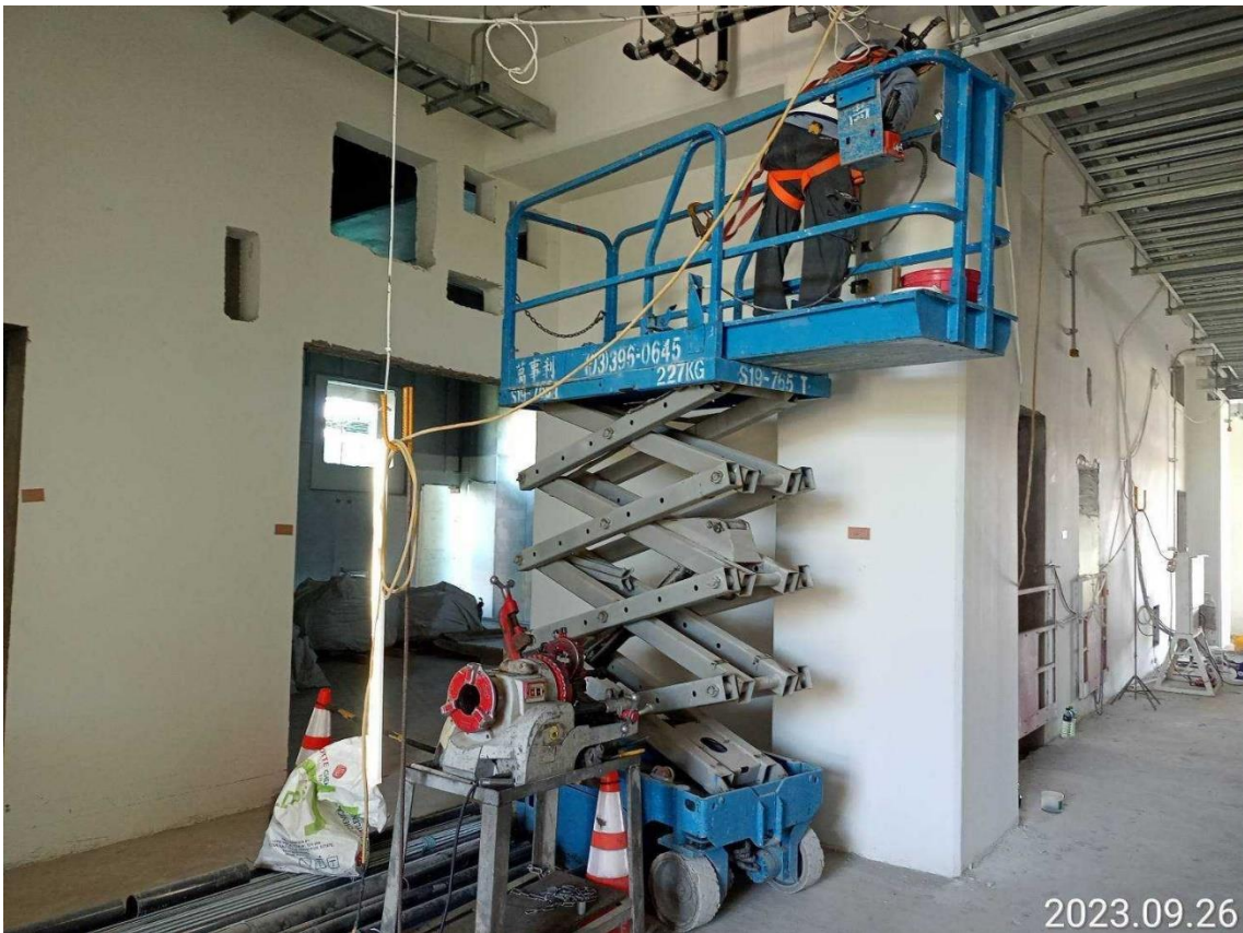
G32 站 2F 電氣管路施工