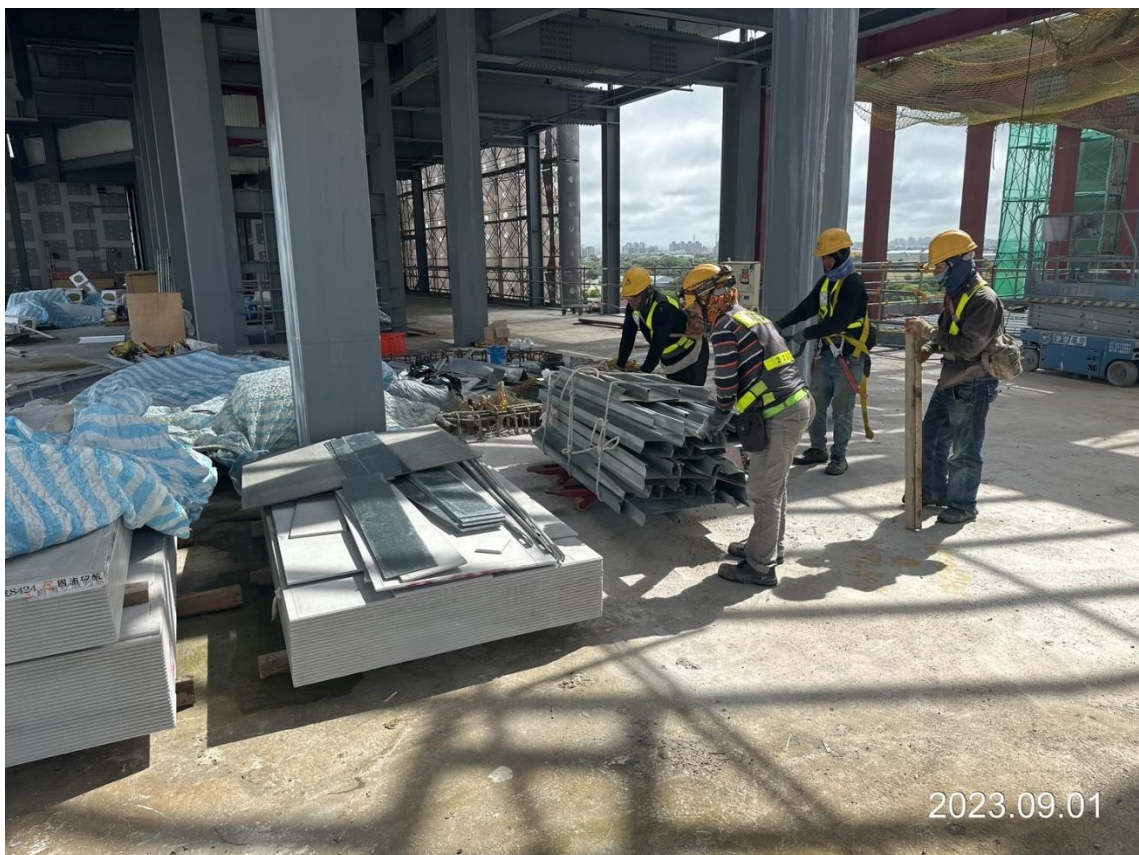
G13a 車站及出入口防颱準備