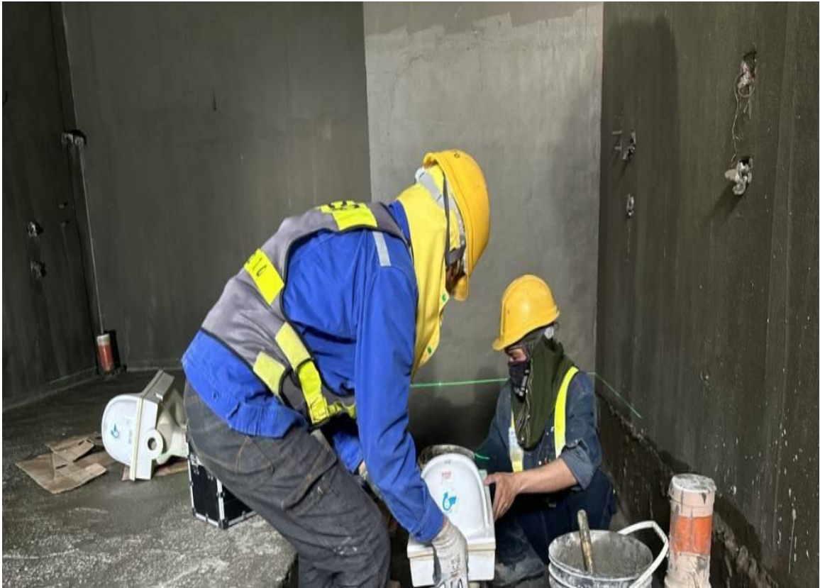
G01 站 1 樓女廁蹲便施作