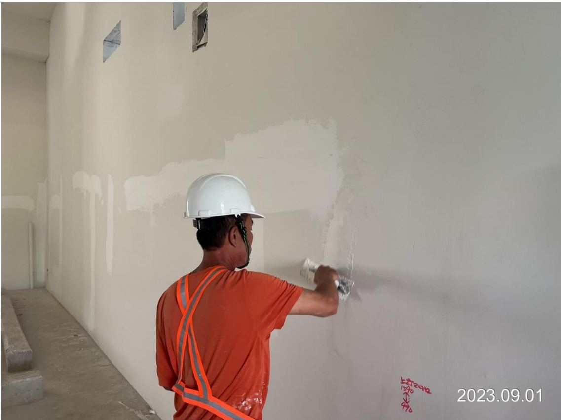
G02 車站出入口二樓牆面油漆施作