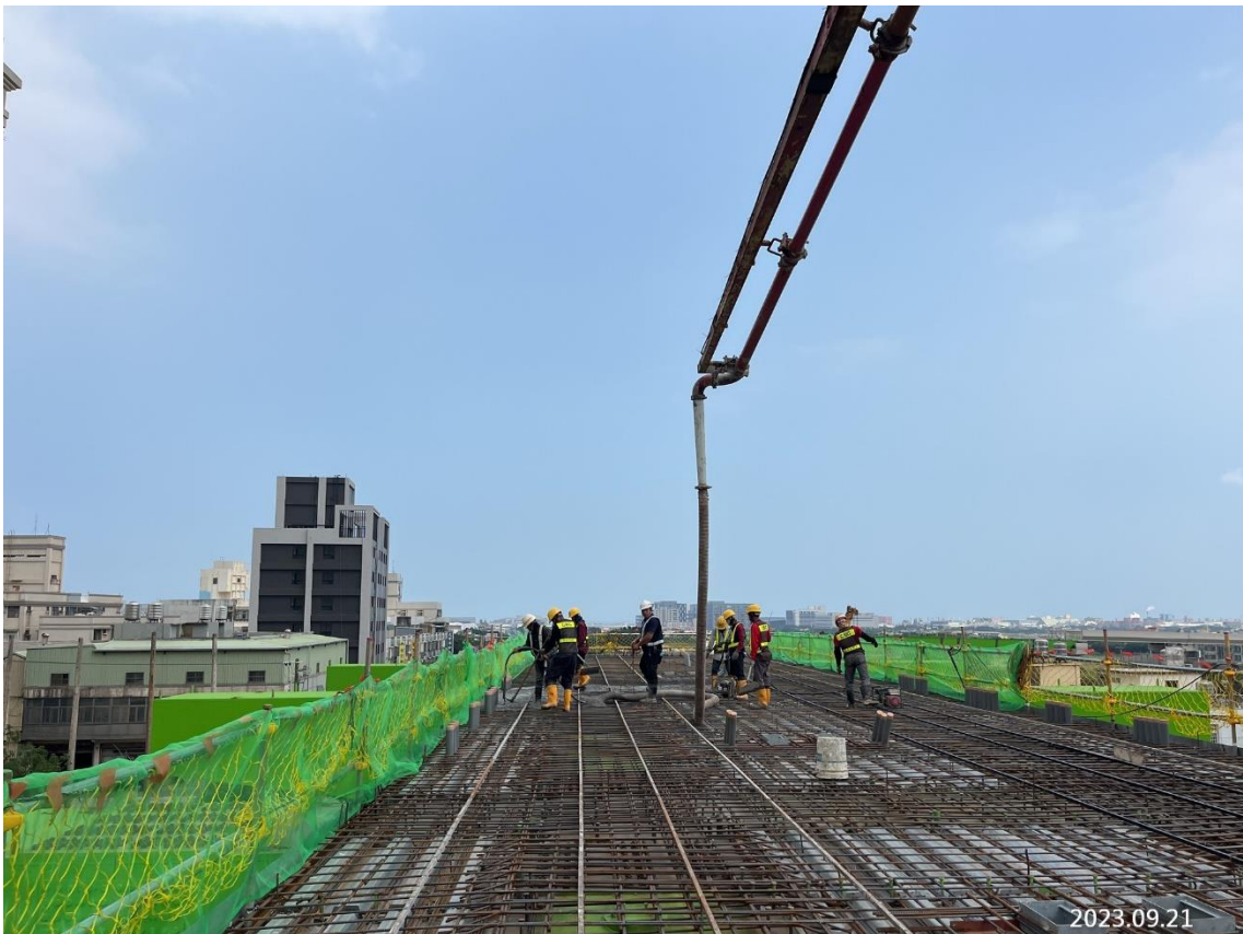
G31 站 軌道層版混凝土澆置