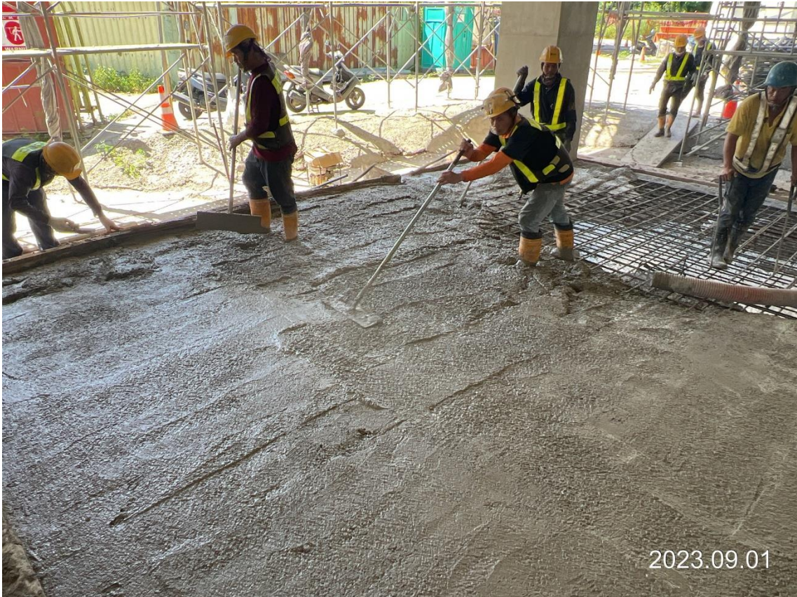
G02 車站出入口一樓無障礙坡道、職員梯欄杆混凝土澆置