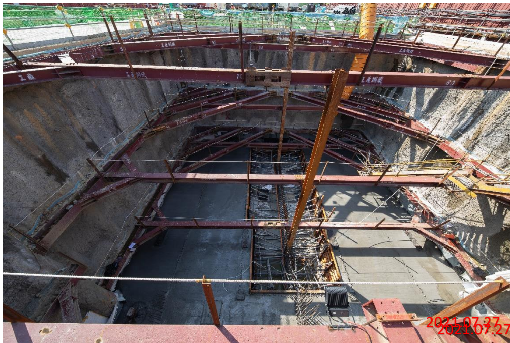
北出土段_潛盾機工作井底板完成