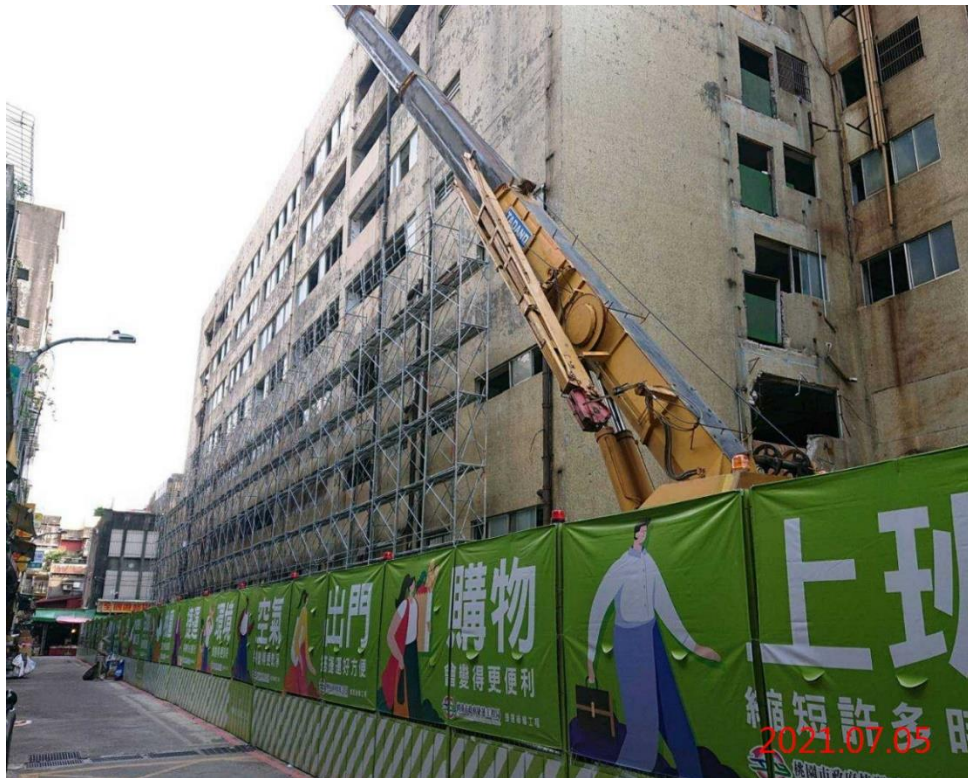
G08 站_外牆防護架搭設