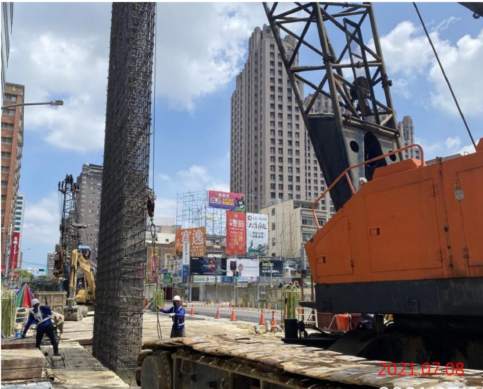
G11 站_連續壁鋼筋籠吊放作業