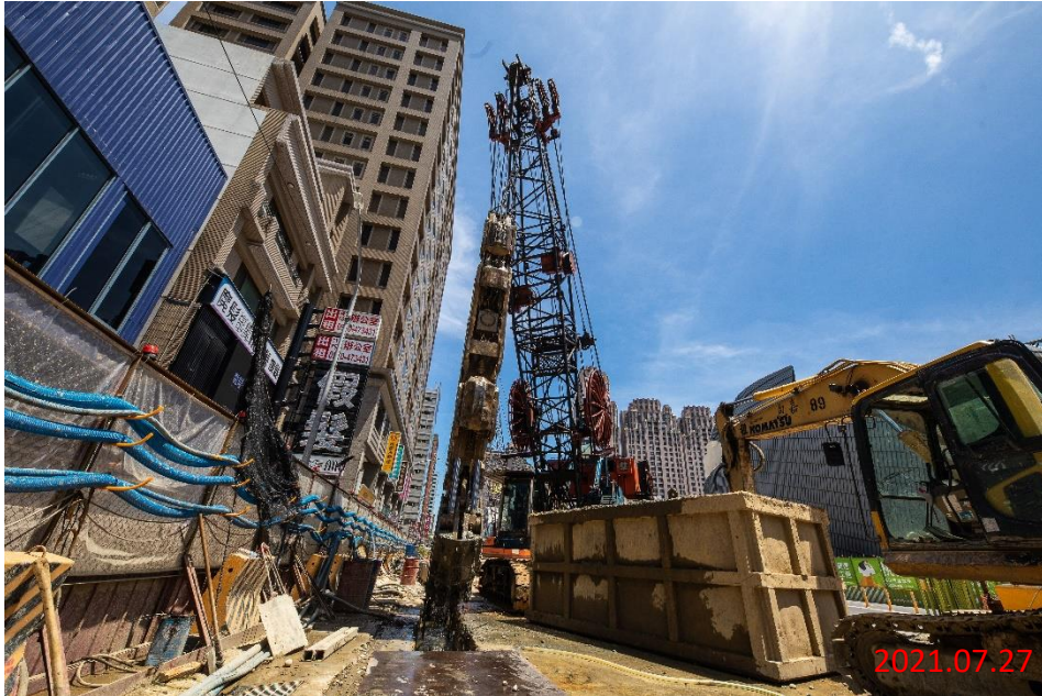
G11 站_連續壁單元抓掘