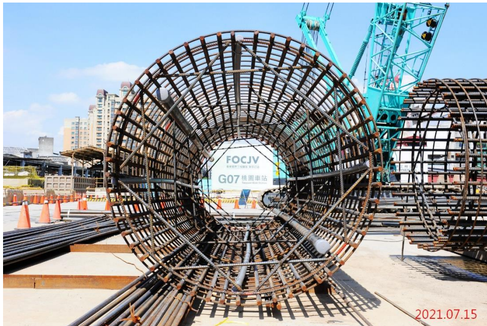
G07 站_逆打鋼柱鋼筋籠組立