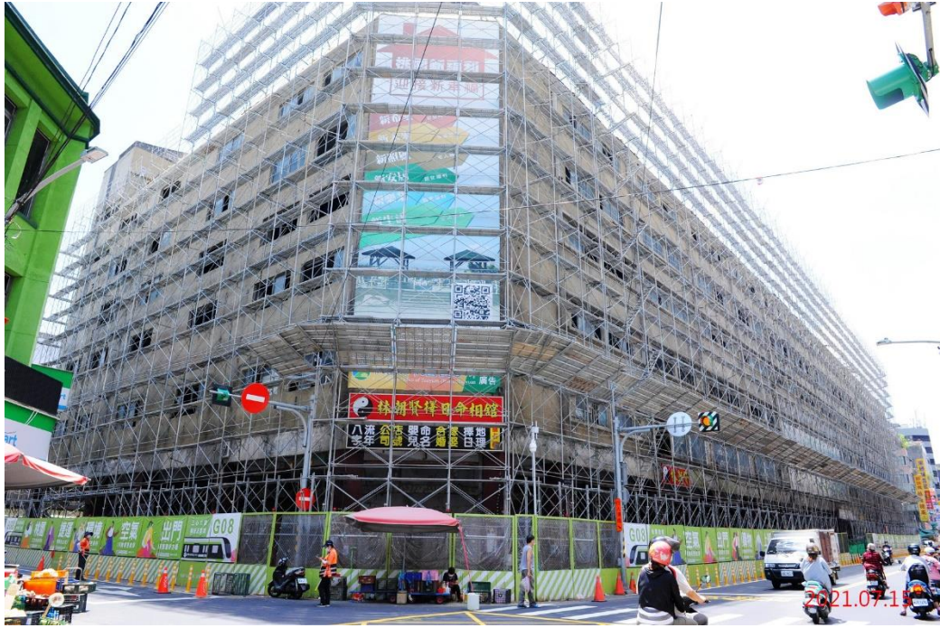
G08 站_外牆防護架搭設