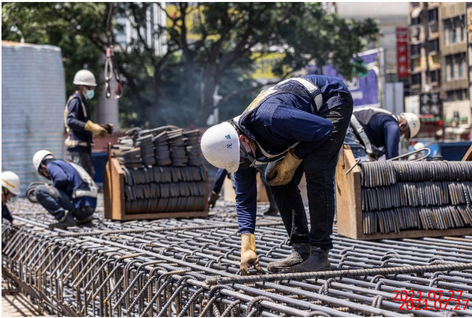
G11 站_連續壁鋼筋籠組立作業