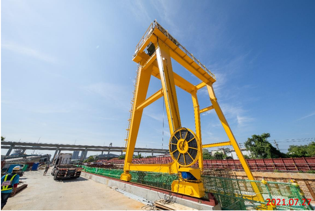
北出土段_天車安裝測試作業