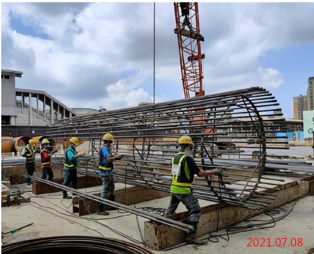
G07 站_逆打鋼柱鋼筋籠組立作業