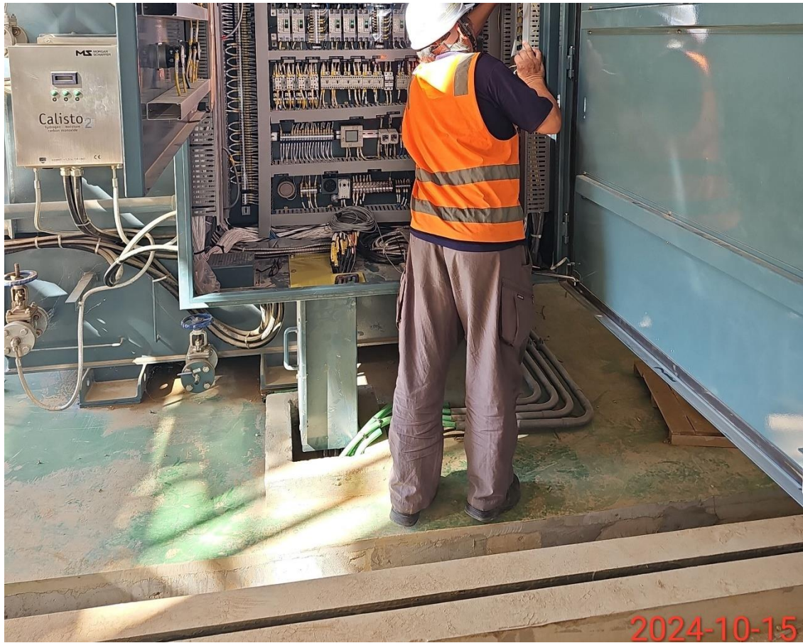
北主變電站主變壓器結線