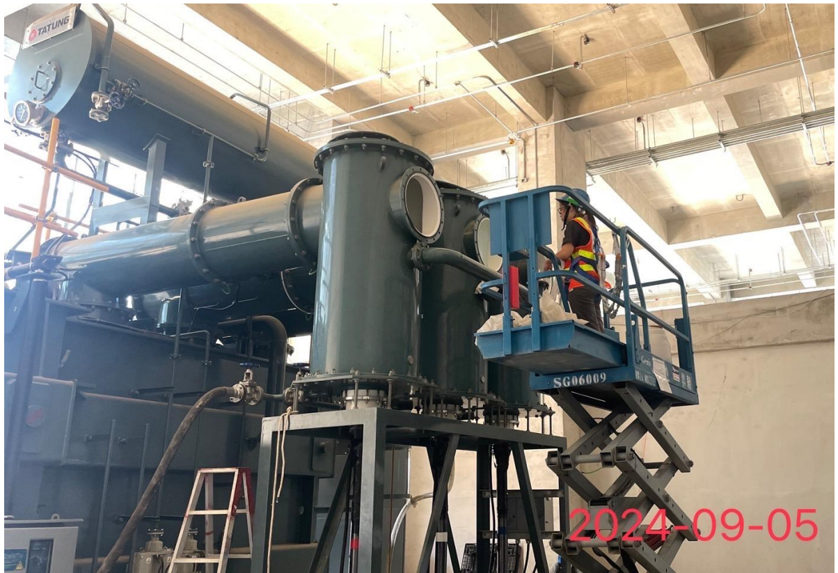
主變壓器高壓套管接點檢查