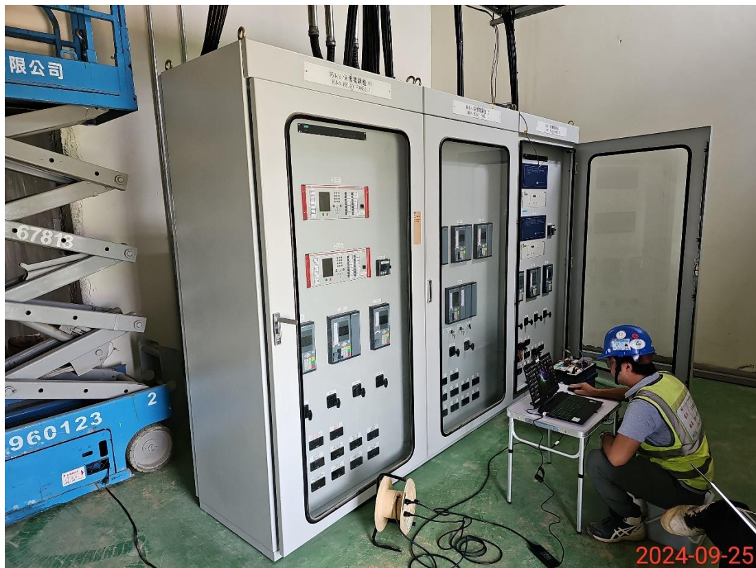
西門子電驛盤自主測試