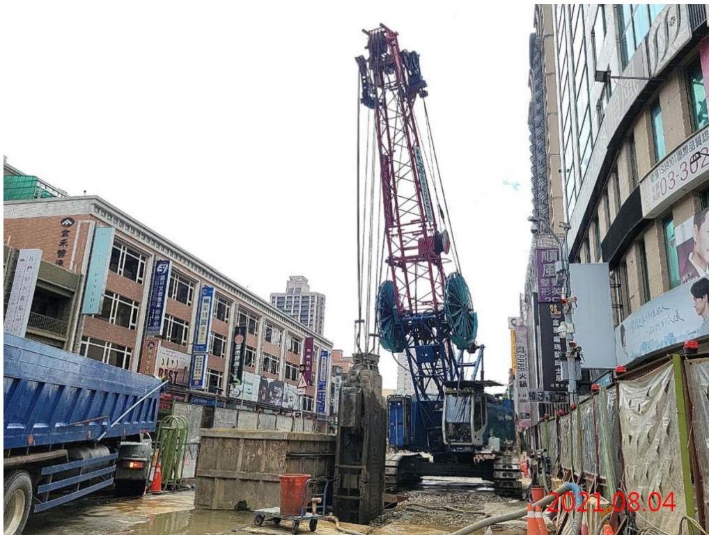
G10 站_連續壁單元挖掘