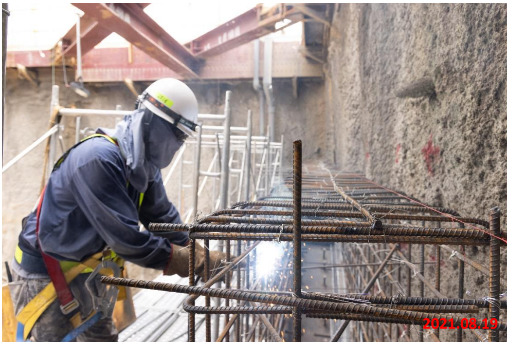
潛盾隧道_鏡面牆鋼筋搭接