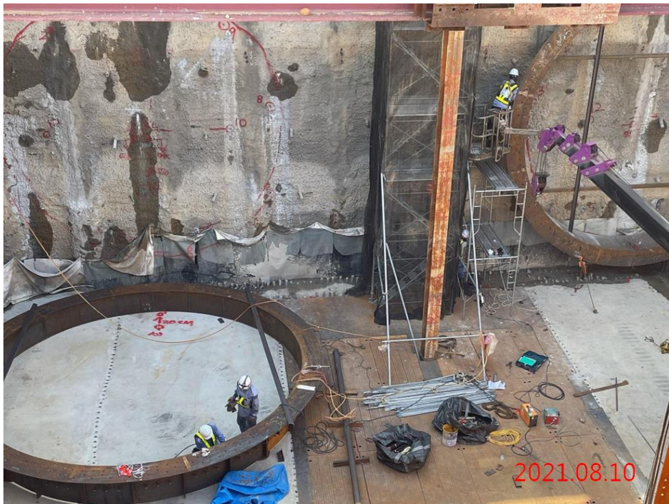
潛盾隧道_發進端鏡面內套吊入及安裝