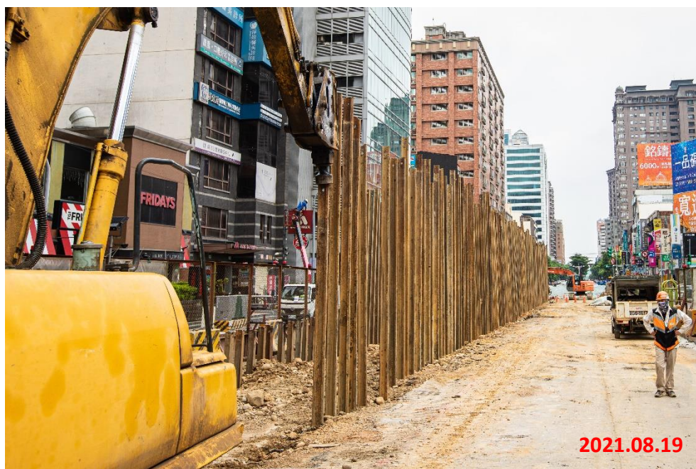
G11 站_臨排鋼軌樁打設