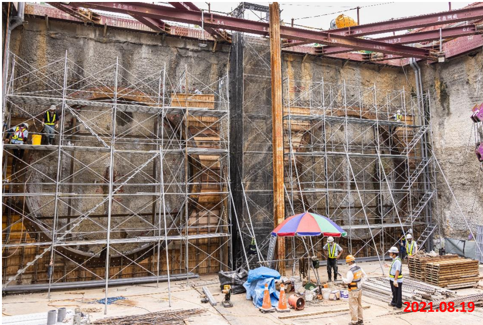
潛盾隧道_鏡面牆模板組立