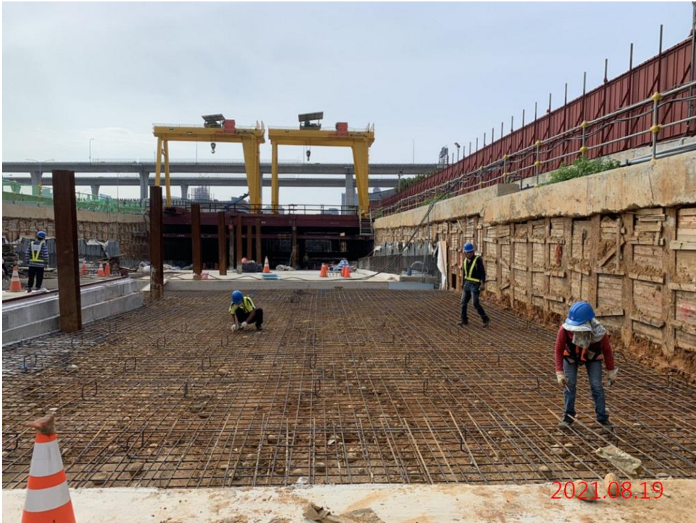
北出土段_結構底版鋼筋綁紮