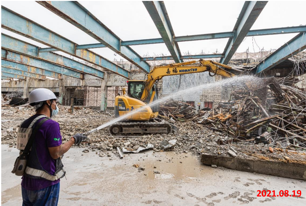
G08 站_舊永和市場結構拆除