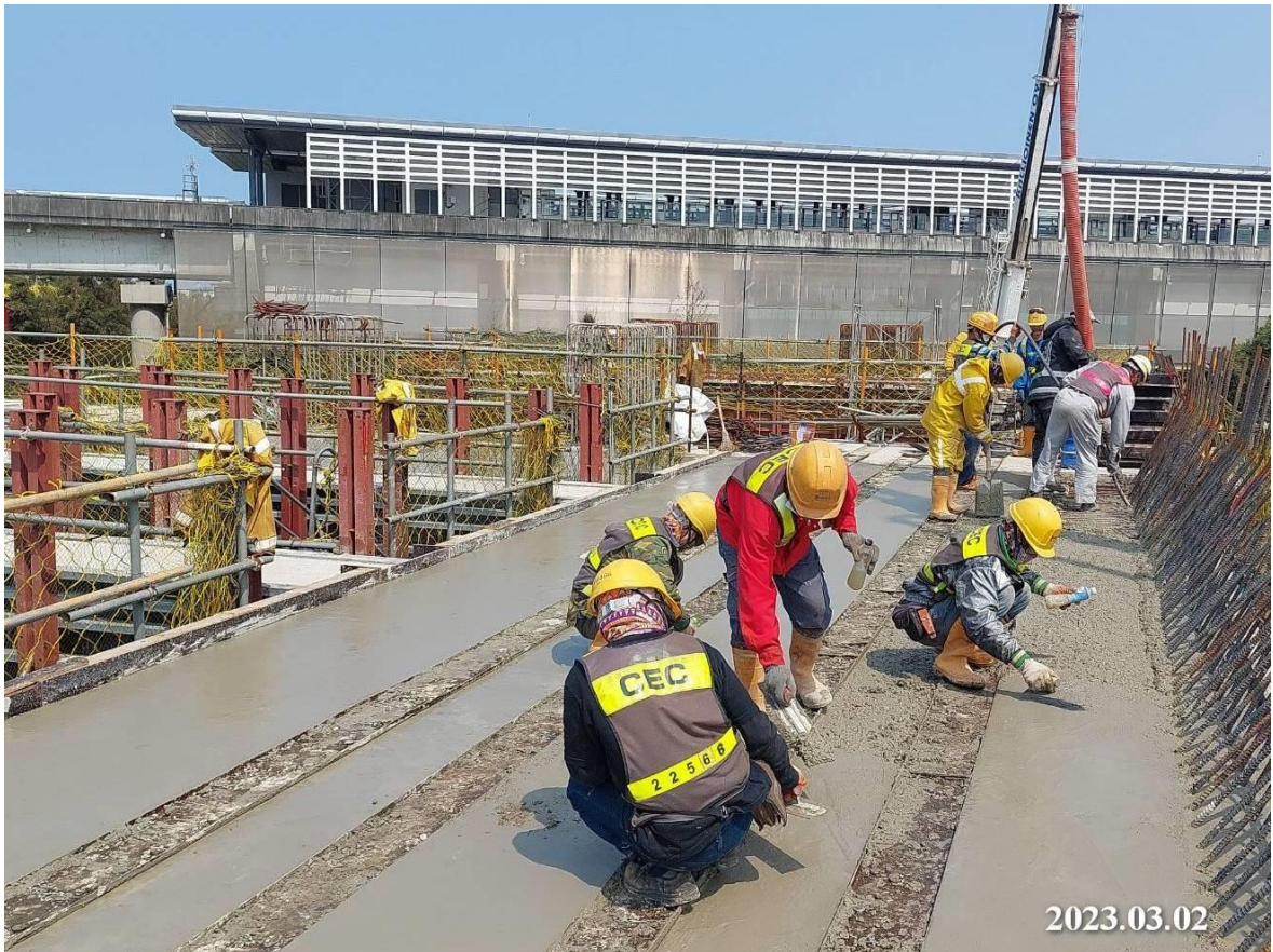
北段上構_G32 站 TG3~TG4 軌道梁頂版混凝土澆置