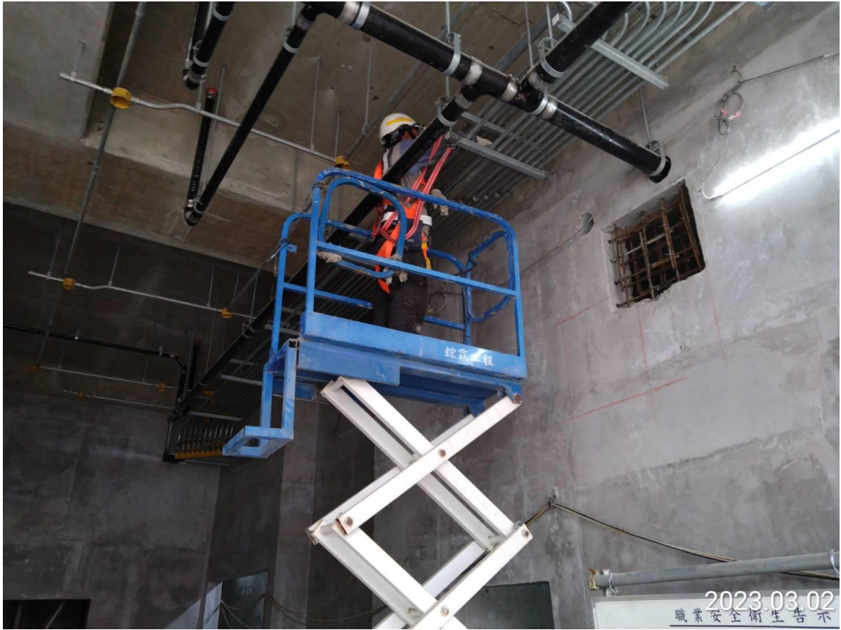
北段_G13 車站出入口二樓天花配管