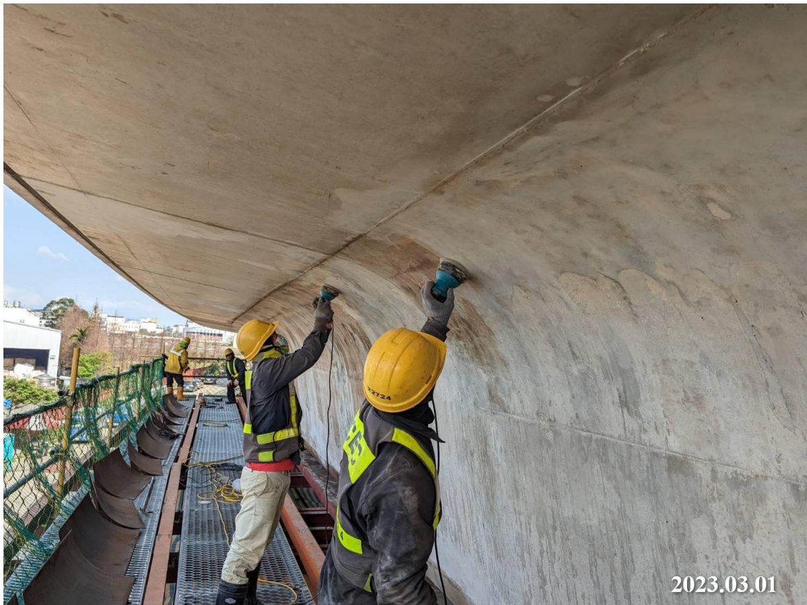
南段_DU01-11 場撐箱型梁模面整理