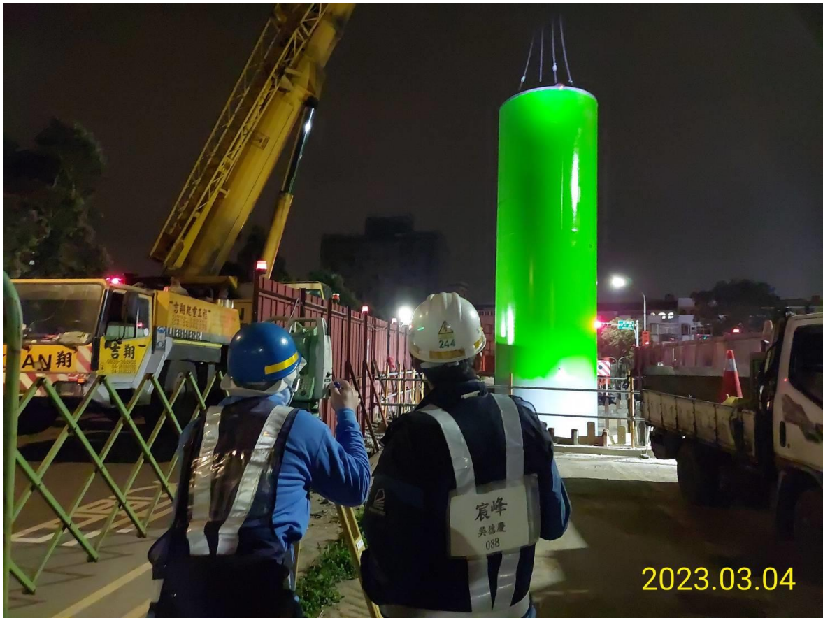
P31-04, P31-05 鋼柱吊裝 P31-05 跟測定位