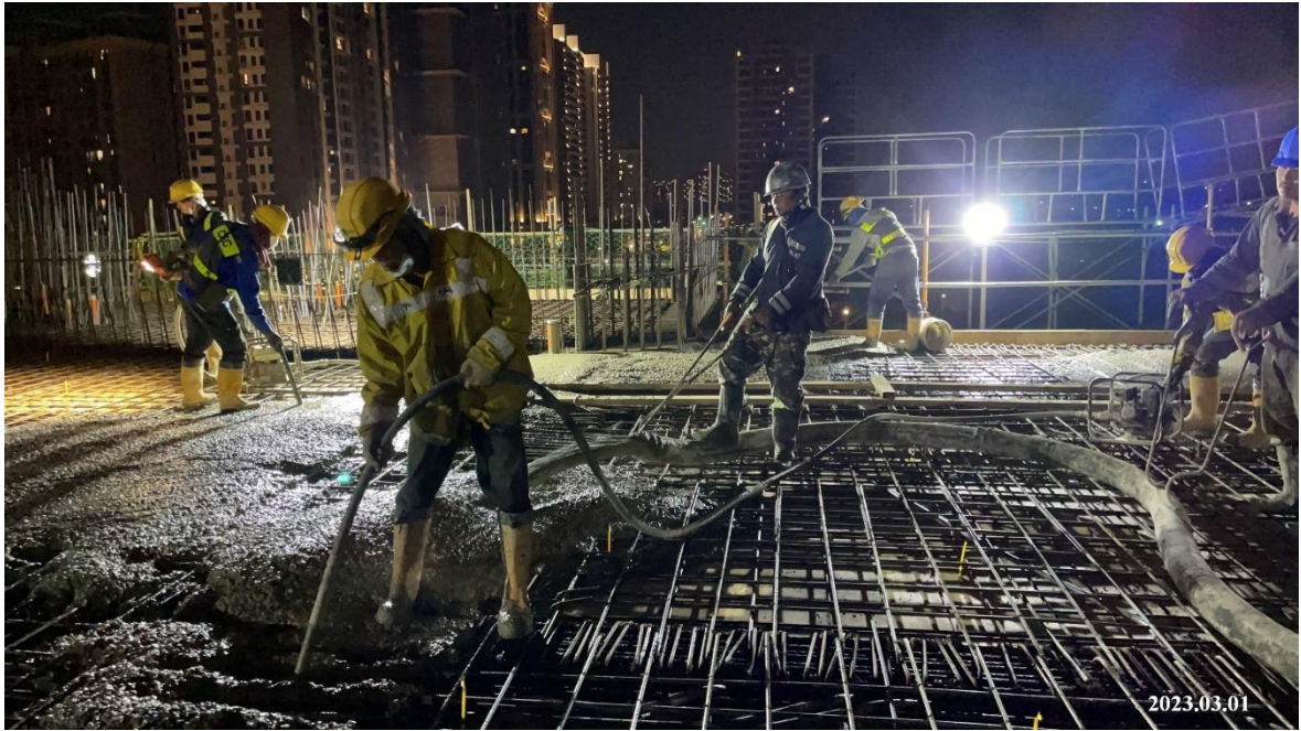
南段_G01 車站出入口四樓梁版混凝土澆置