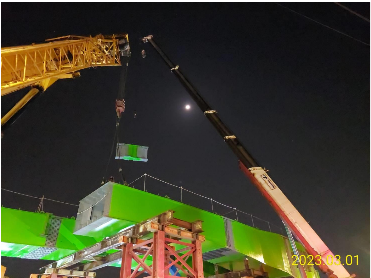
DU12-01 鋼箱梁吊裝 橫隔梁吊裝