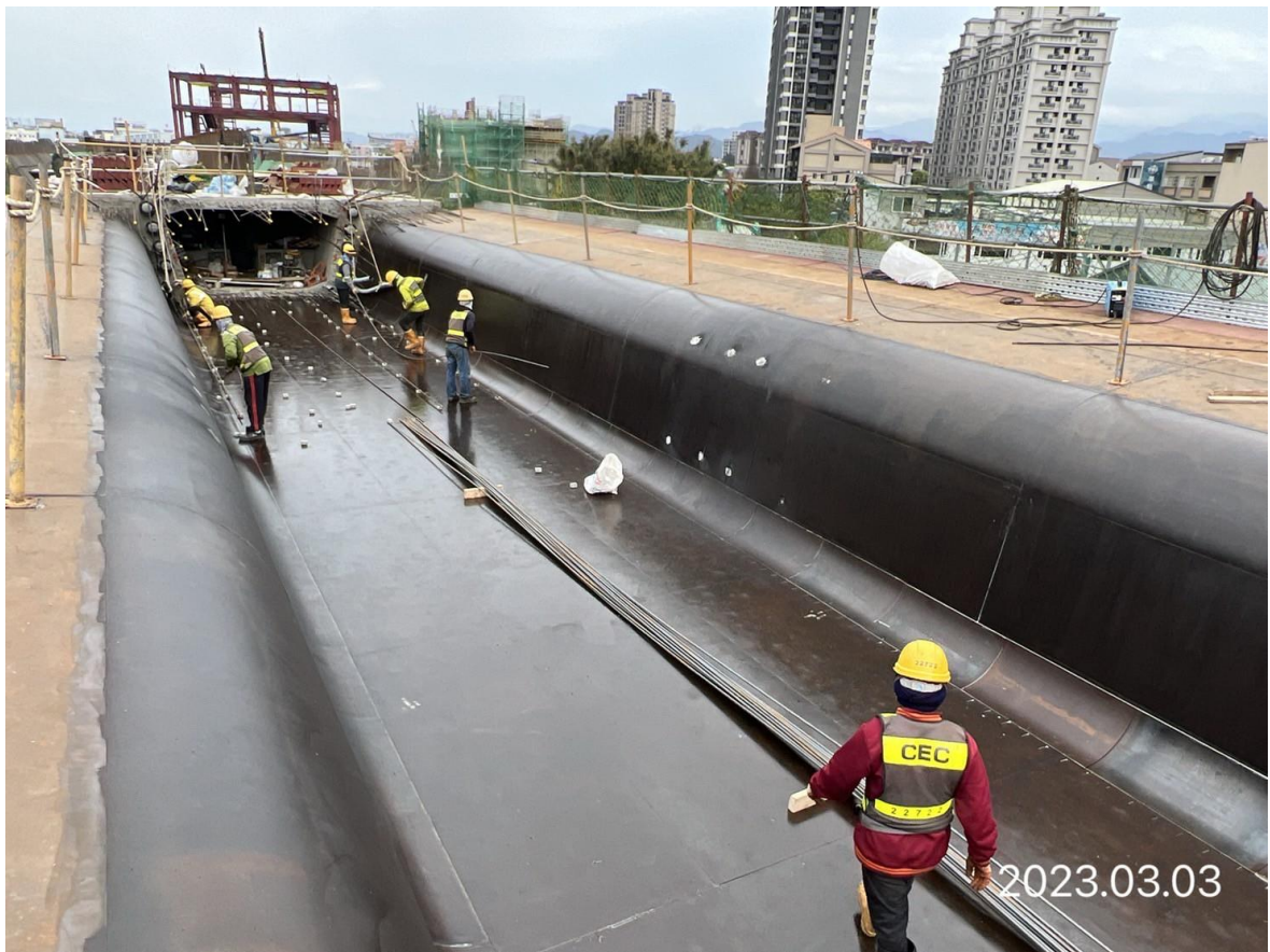
南段_DU01-11 場撐箱型梁鋼筋綁紮