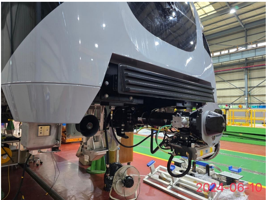
捷運綠線首列車聯結器安裝