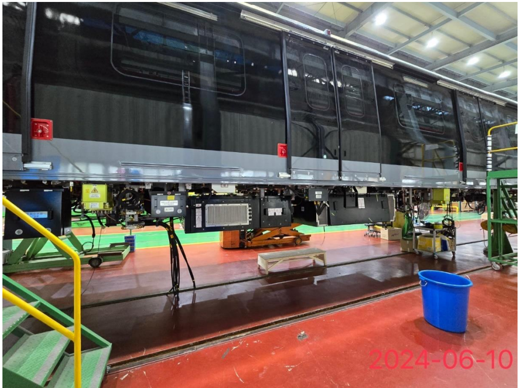
捷運綠線首列車車底設備安裝