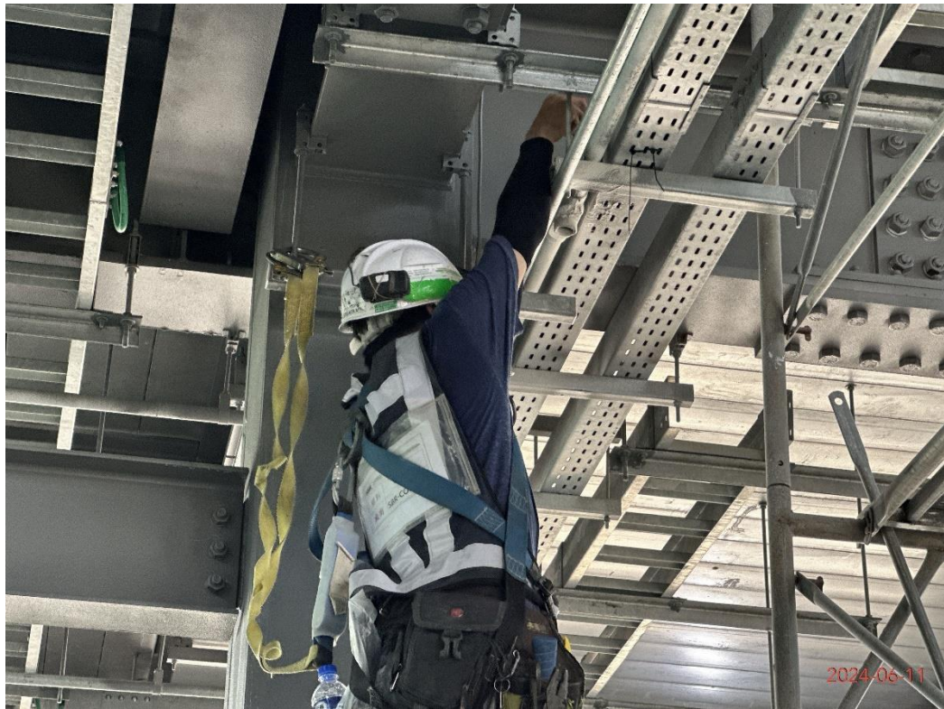
G13 站通訊系統纜線佈放