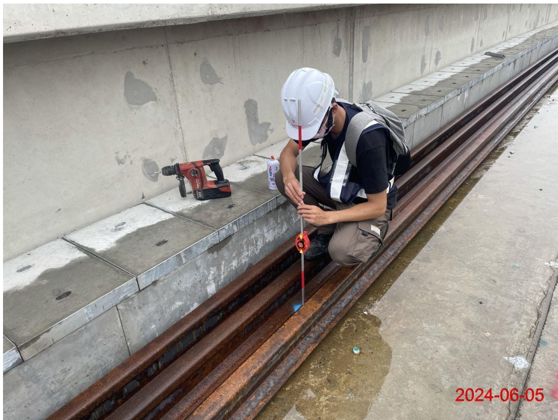
G13A-G31 站間上下行線邊模點放樣