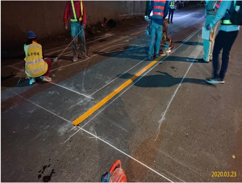
G03 站(巧克力街附近) 交維改道標線繪設