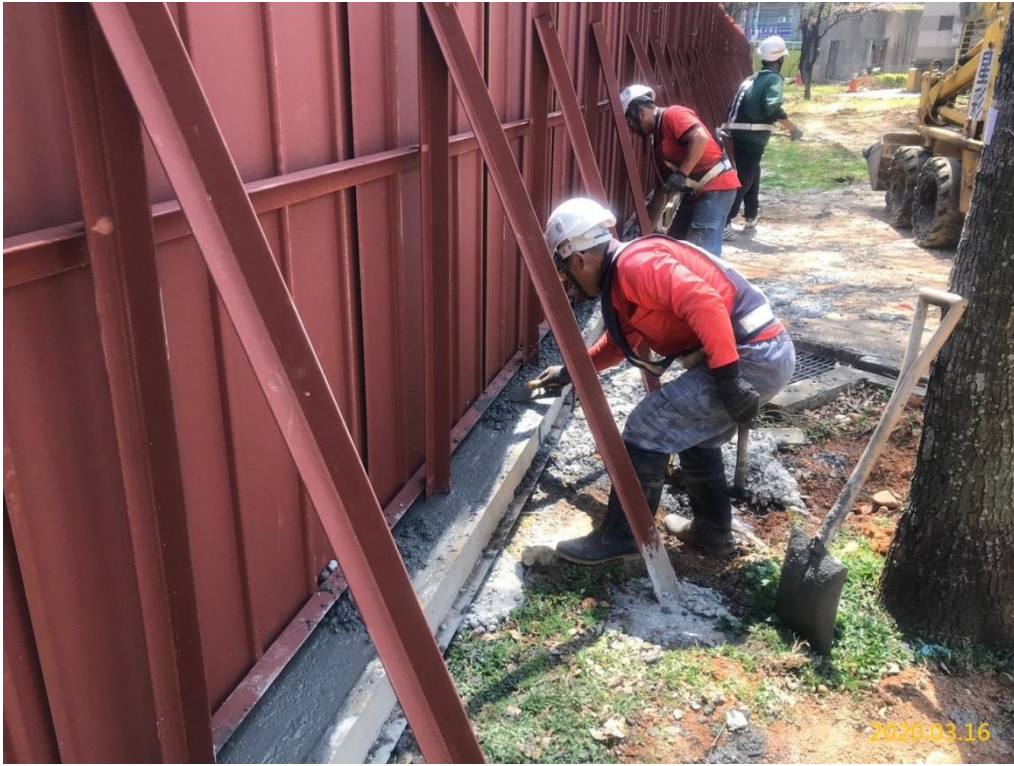
VS6 通風豎井(福豐公園)施工圍籬防溢座混凝土澆置混凝土澆置