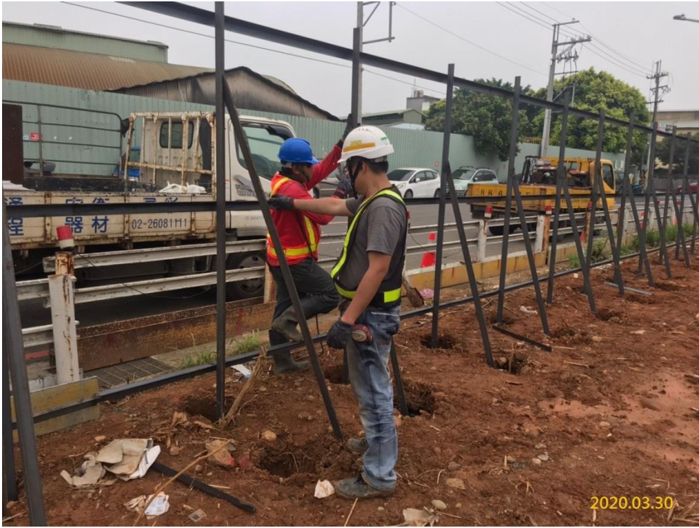
G03 站(巧克力街附近) 出入口圍籬施作