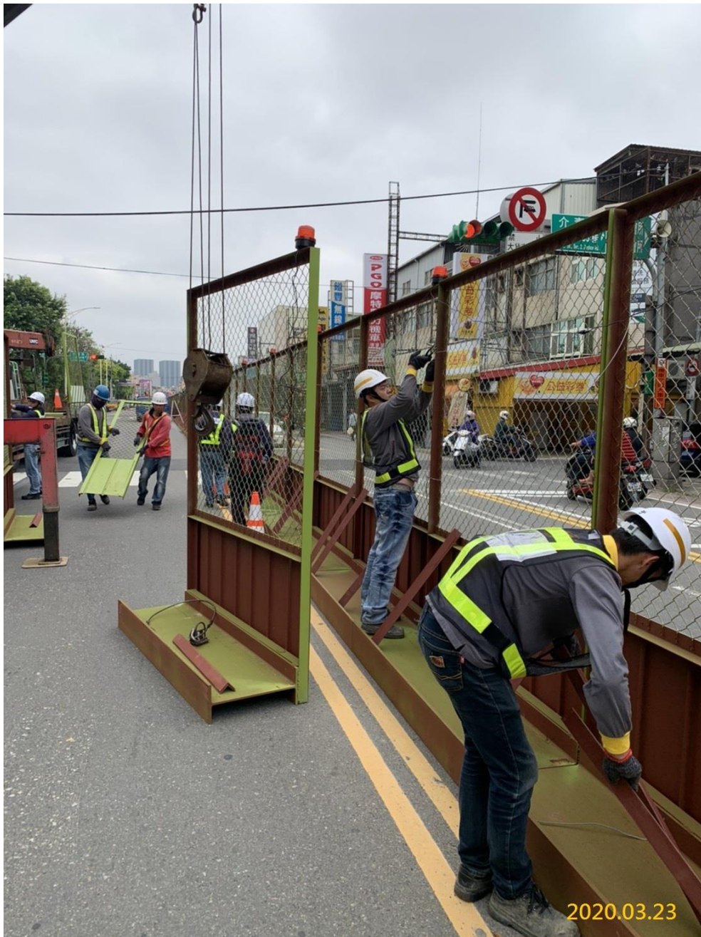
G03 站(巧克力街附近)交通維持圍籬布設