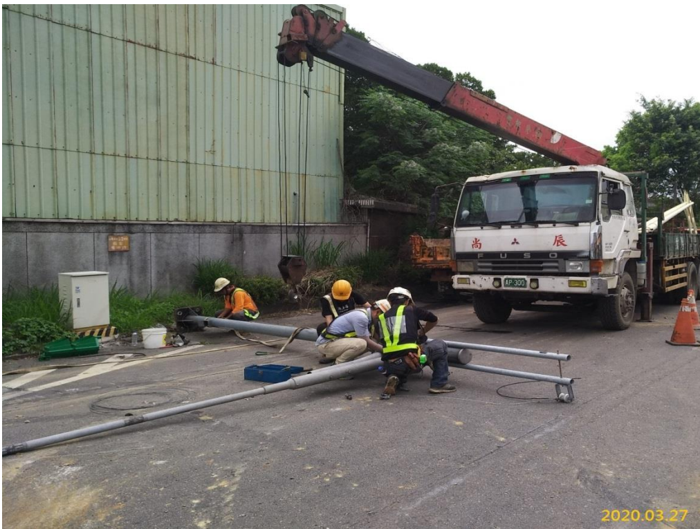
G03 站(巧克力街附近)既設路燈桿・號誌桿拆除移置