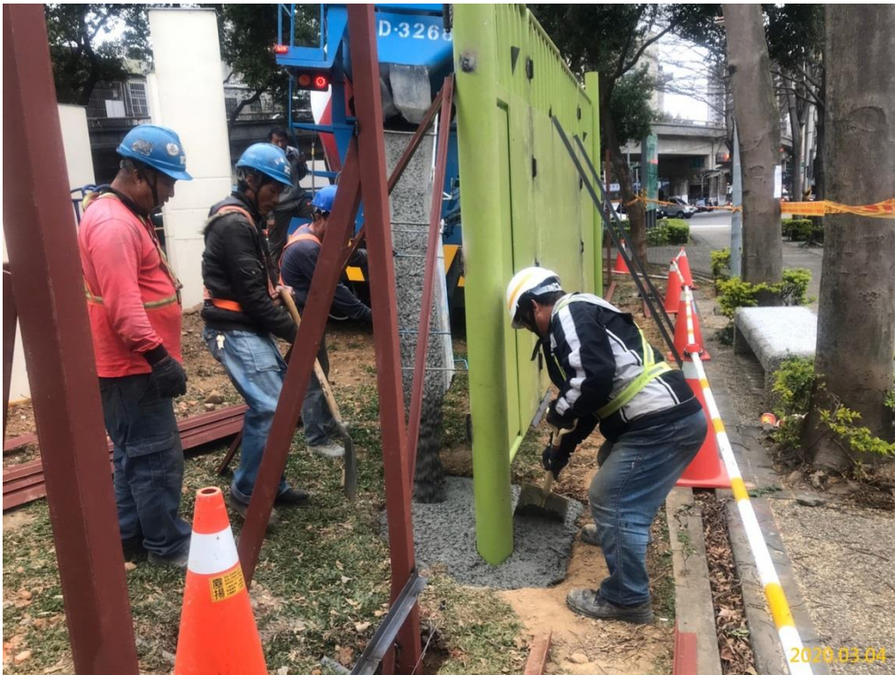
VS6通風豎井(福豐公園)施工圍籬立柱、斜撐基礎混凝土澆置