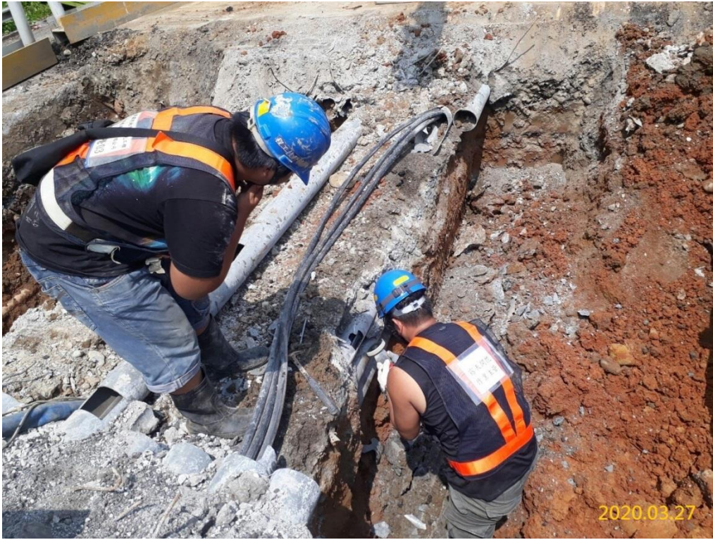
G03 站(巧克力街附近)管線撥遷破除施作