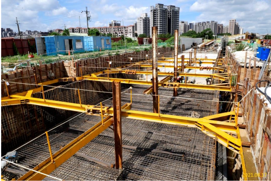
南出土結構體施作