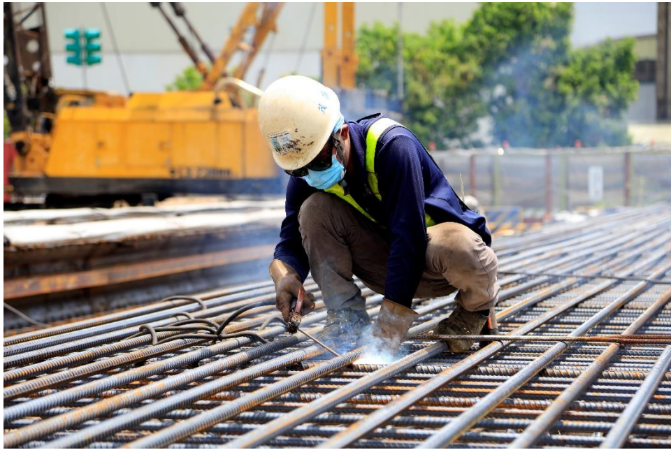
G03 站連續壁鋼筋籠施作