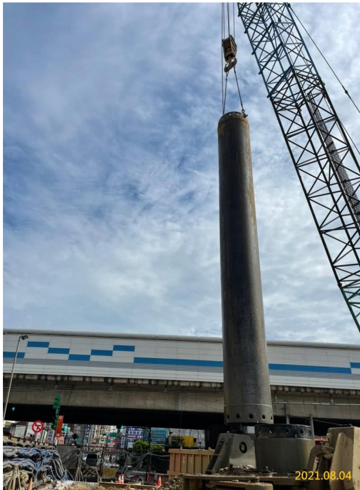
VS5 通風豎井中間柱施作