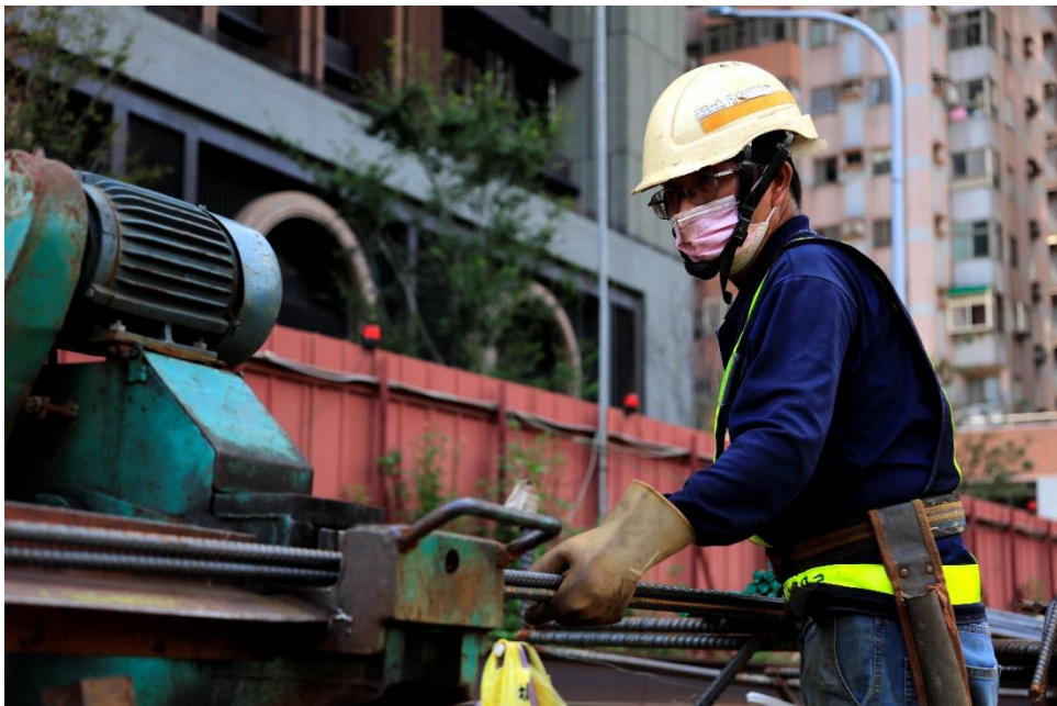
G04 站連續壁鋼筋籠施作