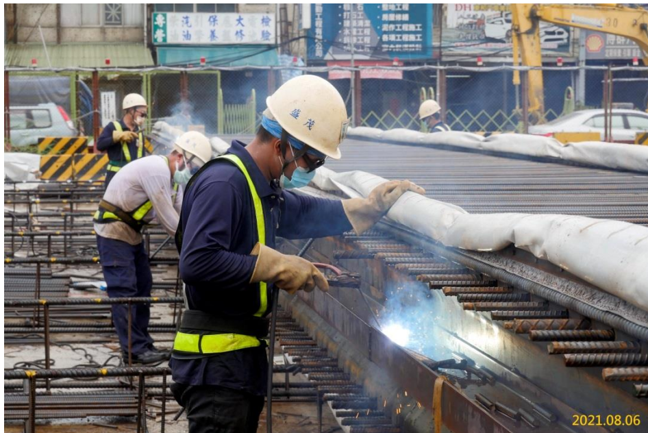
G03 站連續壁鋼筋籠施作