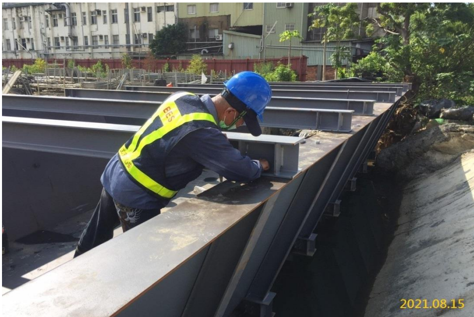
南出土更寮腳溪鋼鍍槽組裝