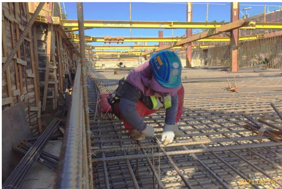
南出土結構體鋼筋綁紮