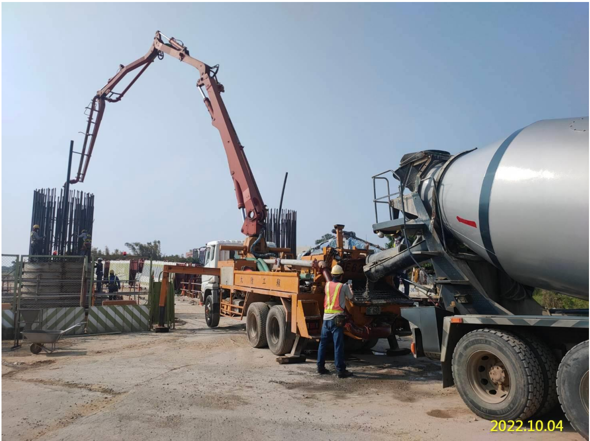
大園三民路二段 墩柱混凝土澆置