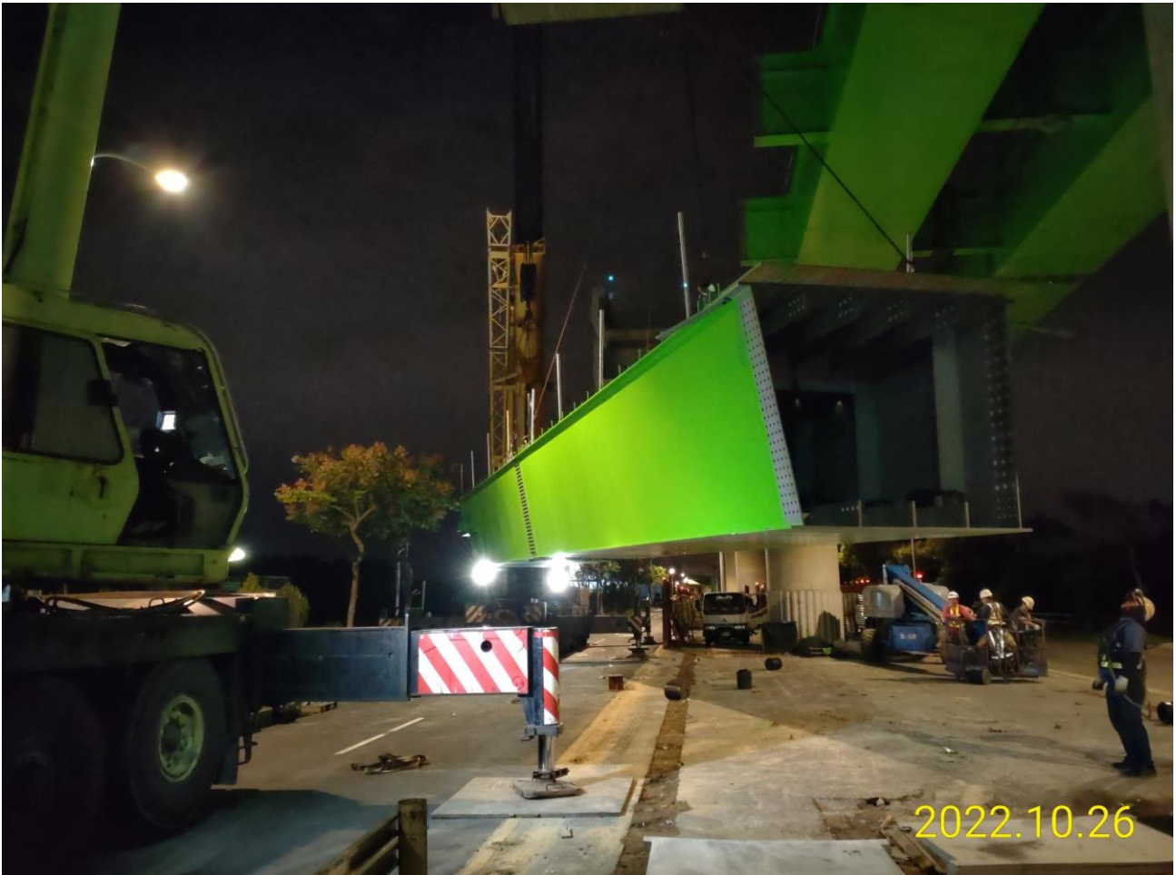
蘆竹中正北路 G13a 車站鋼構吊裝