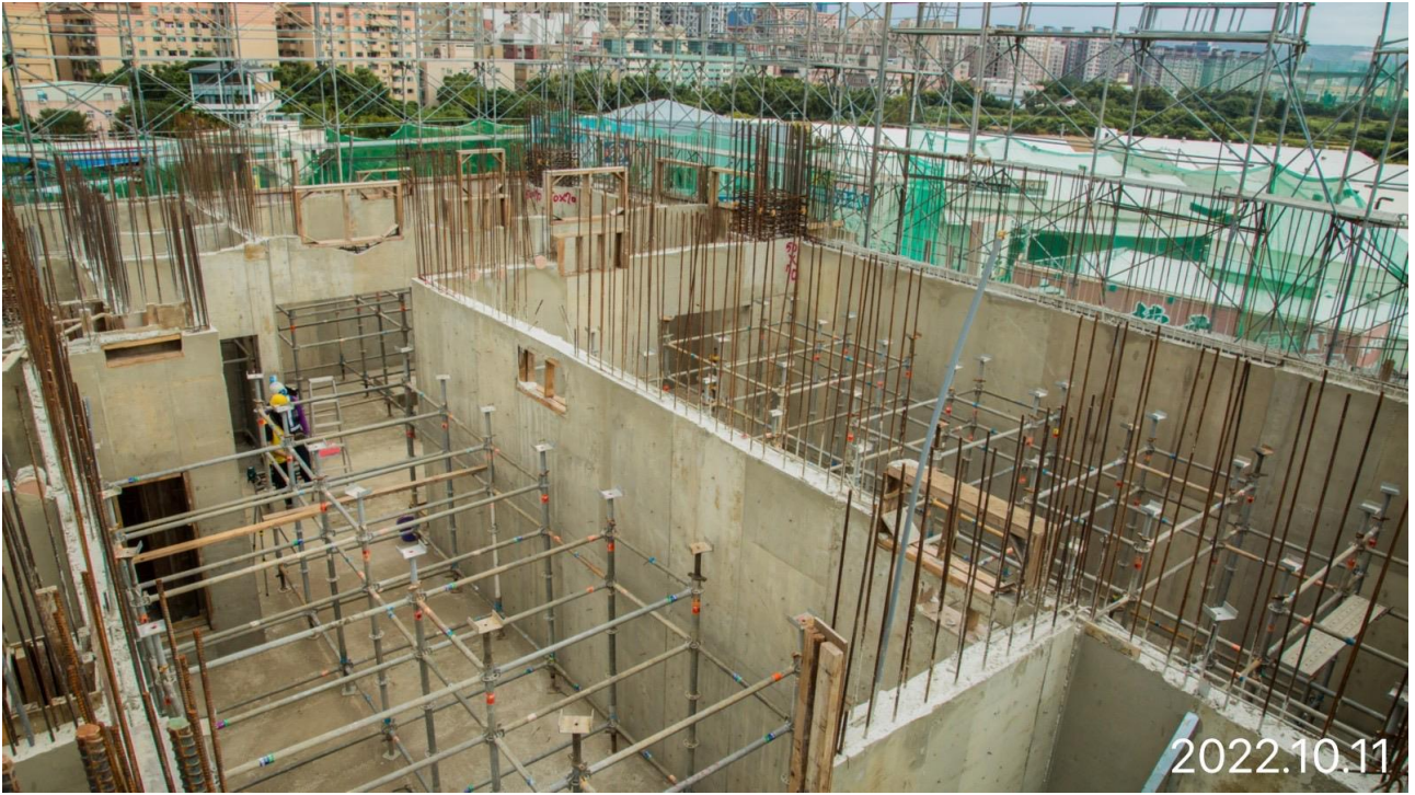
蘆竹中正北路 G13 車站出入口 3 樓柱牆施工現況