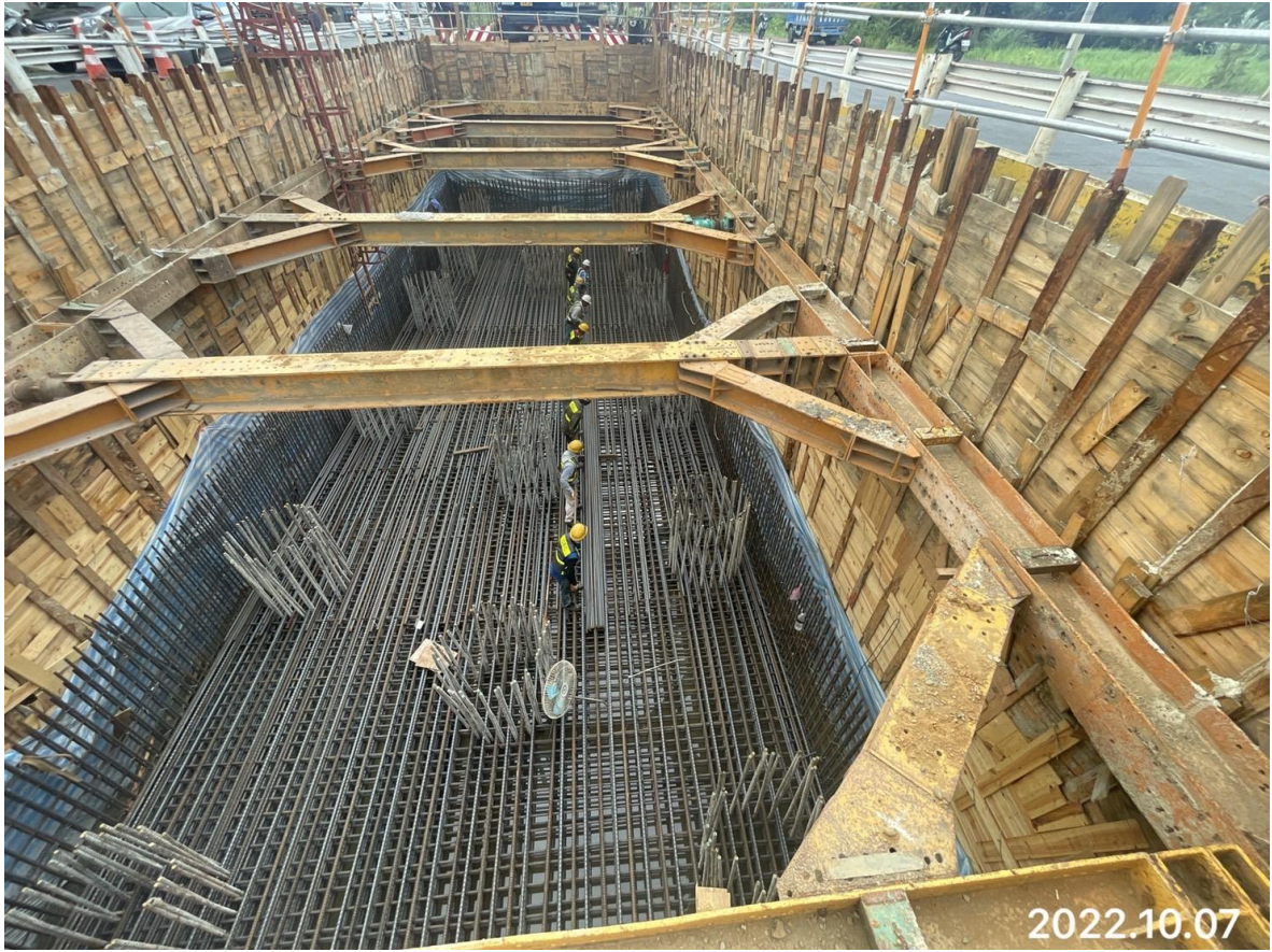
大園三民路二段 樁帽鋼筋綁紮