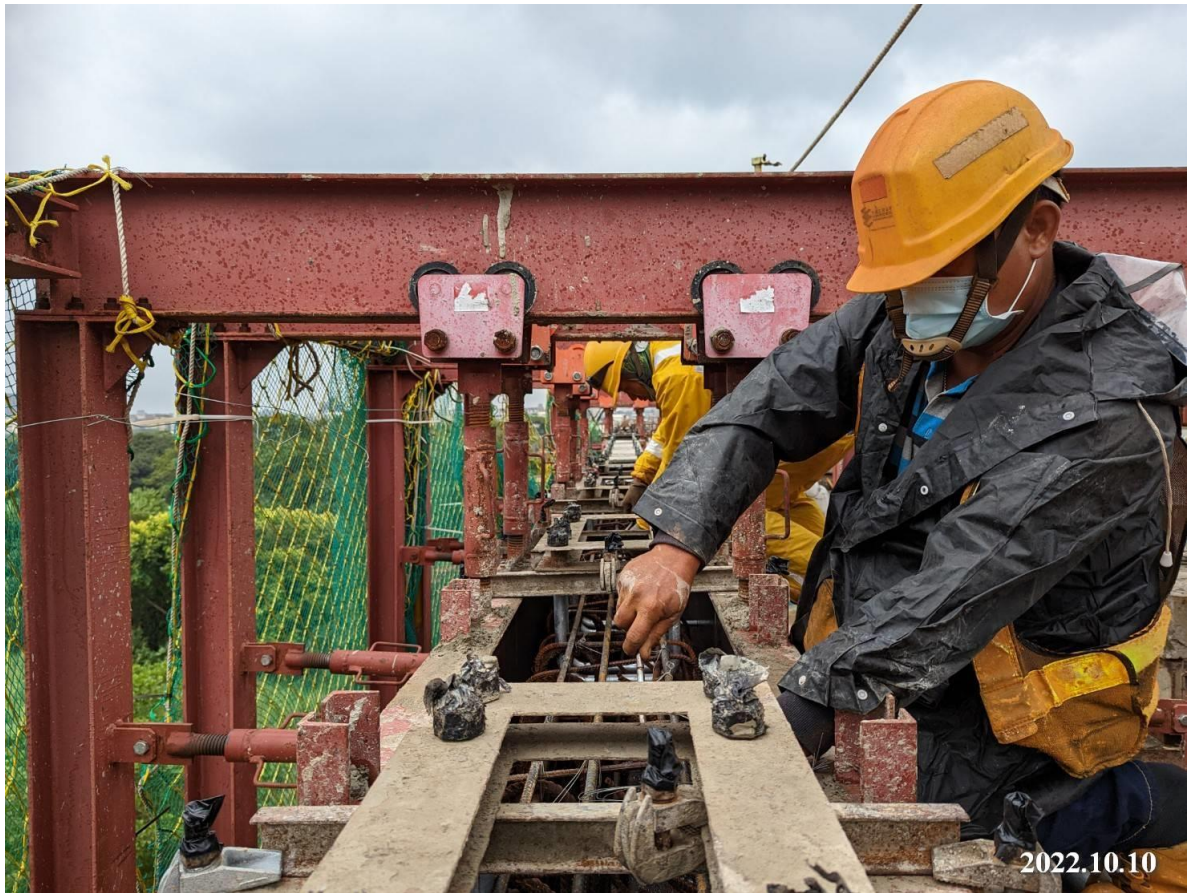
蘆竹蘆興街 帽梁混凝土澆置