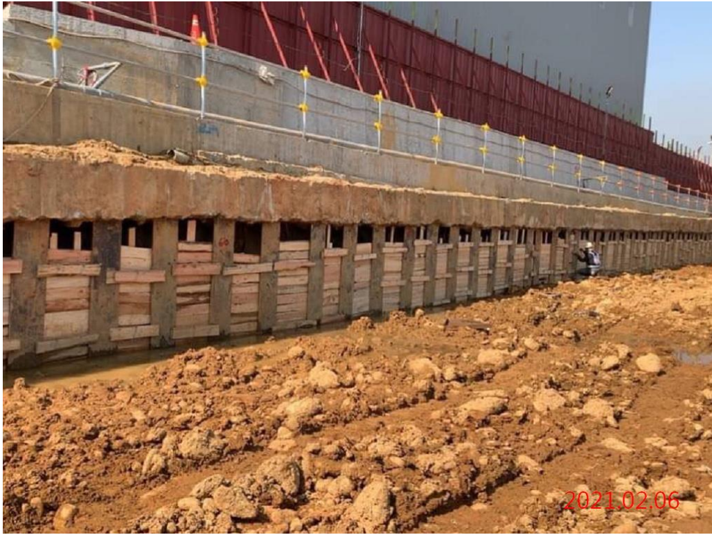
北出土段_H型鋼擋土支撐襯板安裝