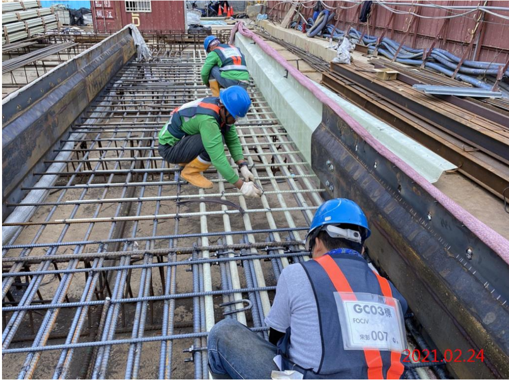
G11 站_橫置連續壁鋼筋籠組立