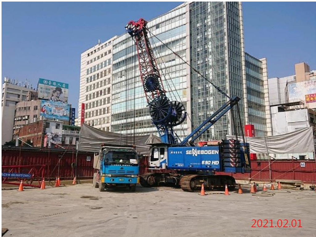
G07 站_連續壁單元抓掘