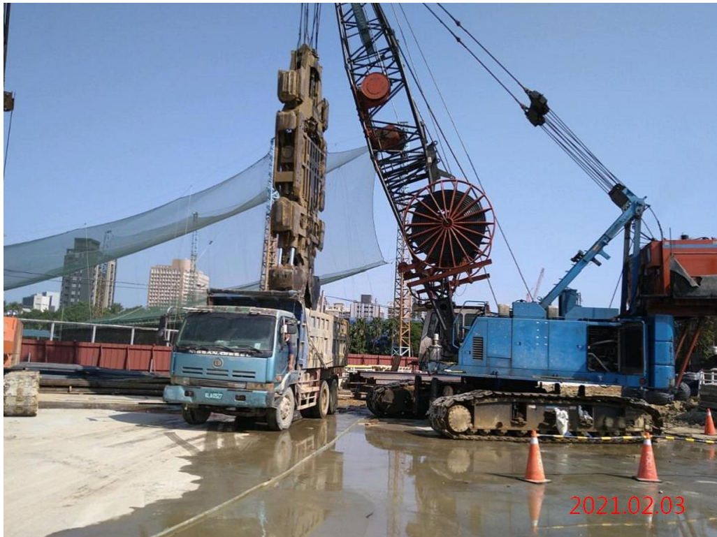
G12 站_出入口連續壁單元抓掘