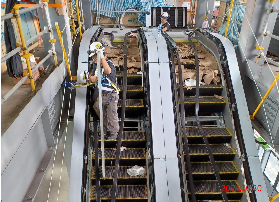
G13a 站 5 號 6 號電扶梯護裙板安裝作業