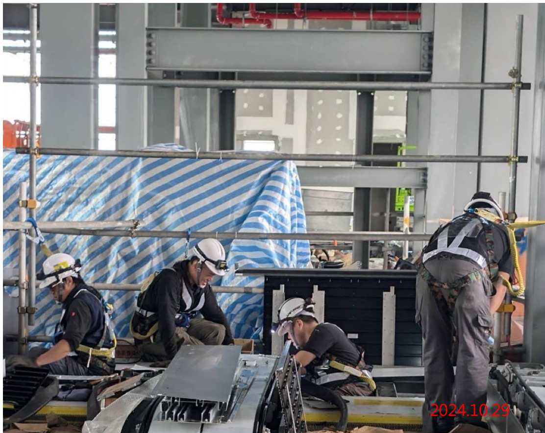
G13a 站 5 號 6 號電扶梯護裙板安裝作業