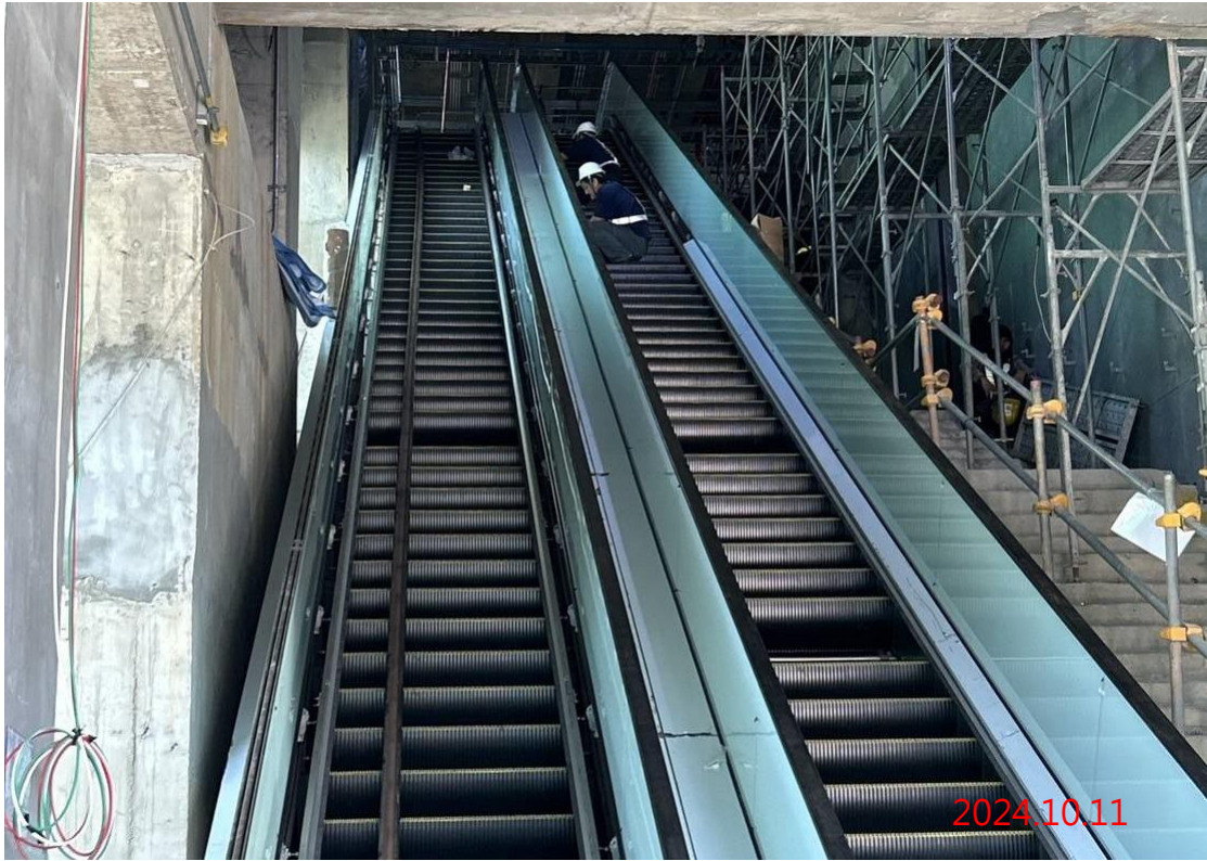
G13 站 1 號 2 號電扶梯玻璃扶手帶安裝作業