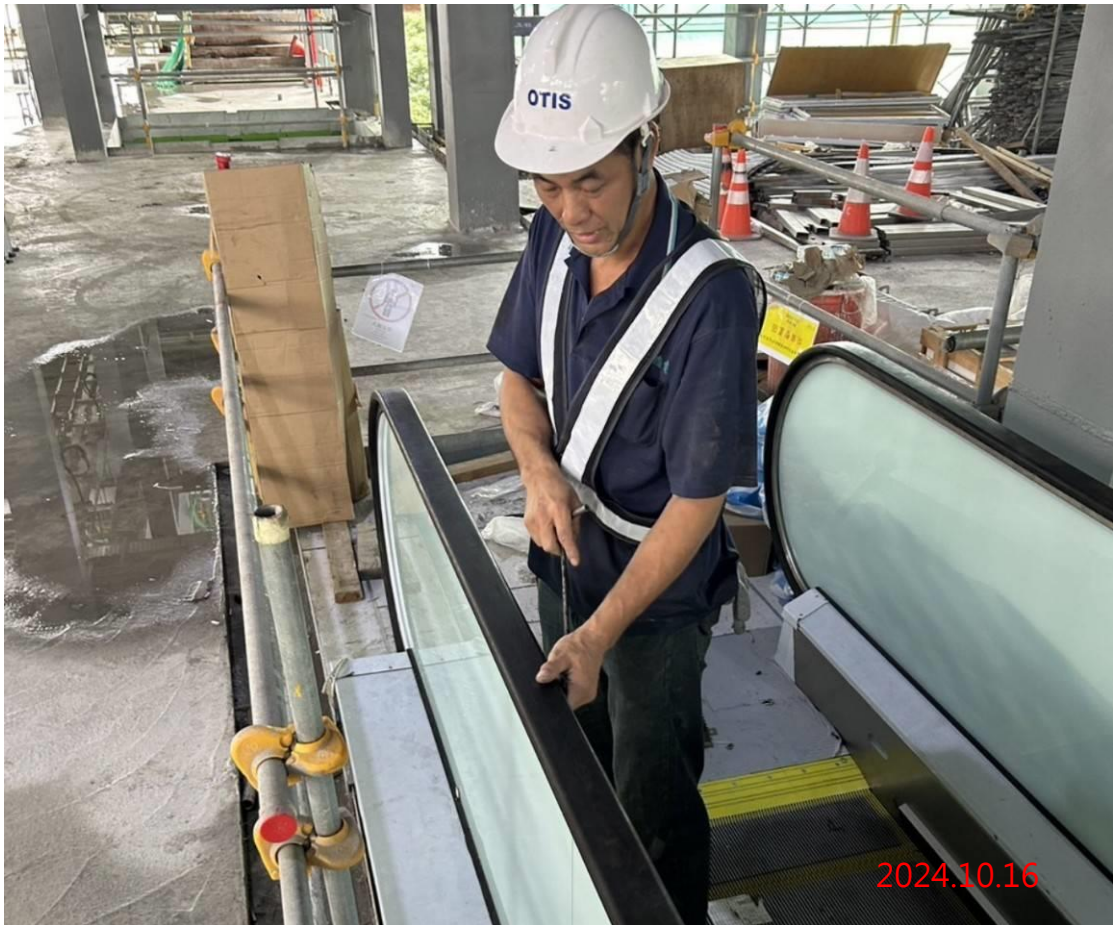
G13 站 4 號電扶梯玻璃扶手帶安裝作業