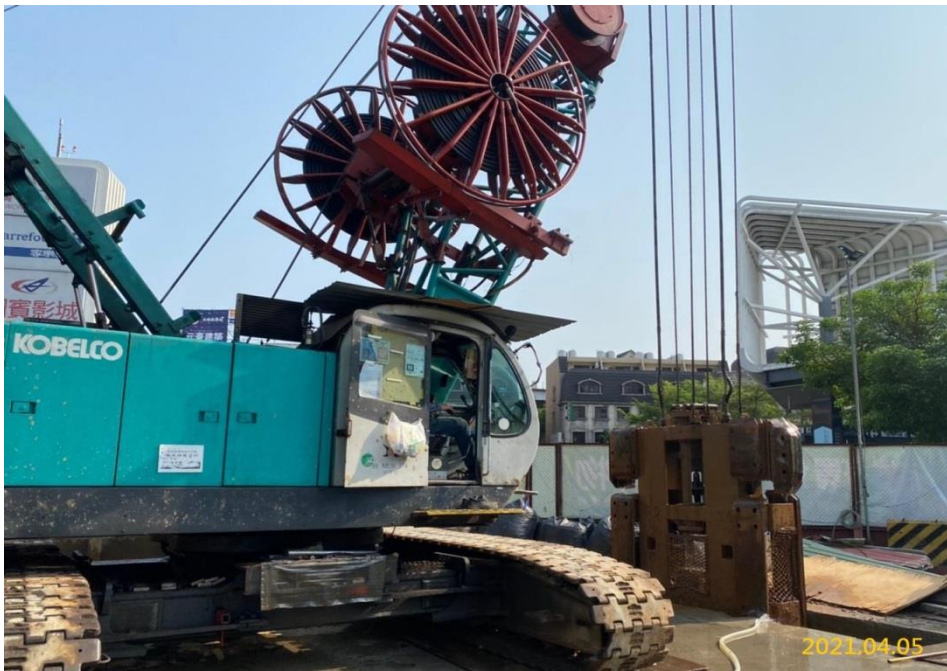
VS4 通風豎井連續壁施作