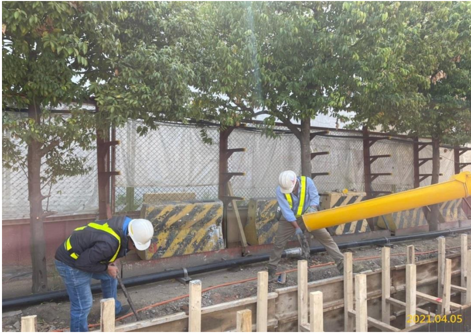
G03 站連續壁導溝施作