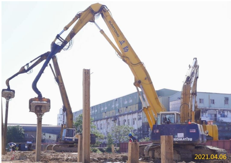
南出土段鋼軌樁打設