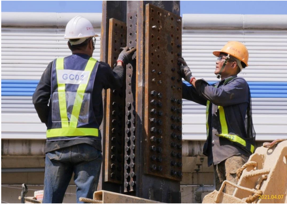
VS5 通風豎井中間柱施作