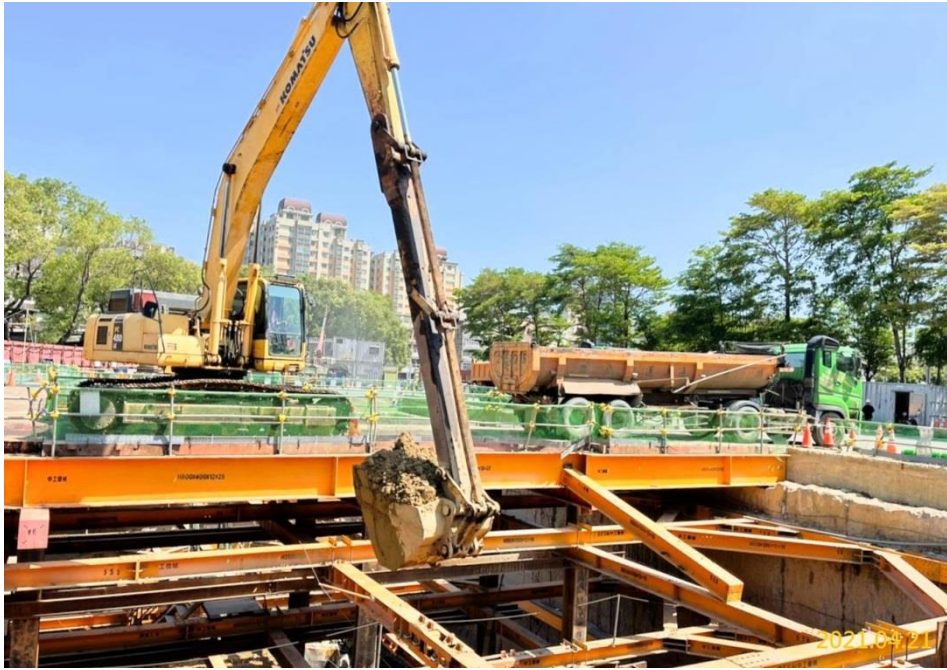
VS6 通風豎井第四層開挖