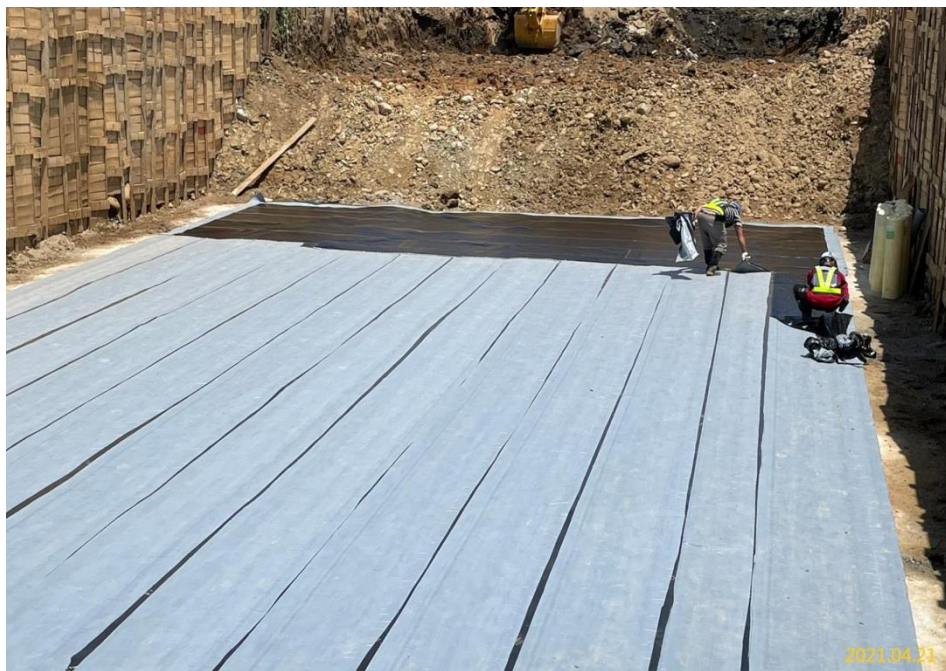
南出土段結構底版(防水膜)施作