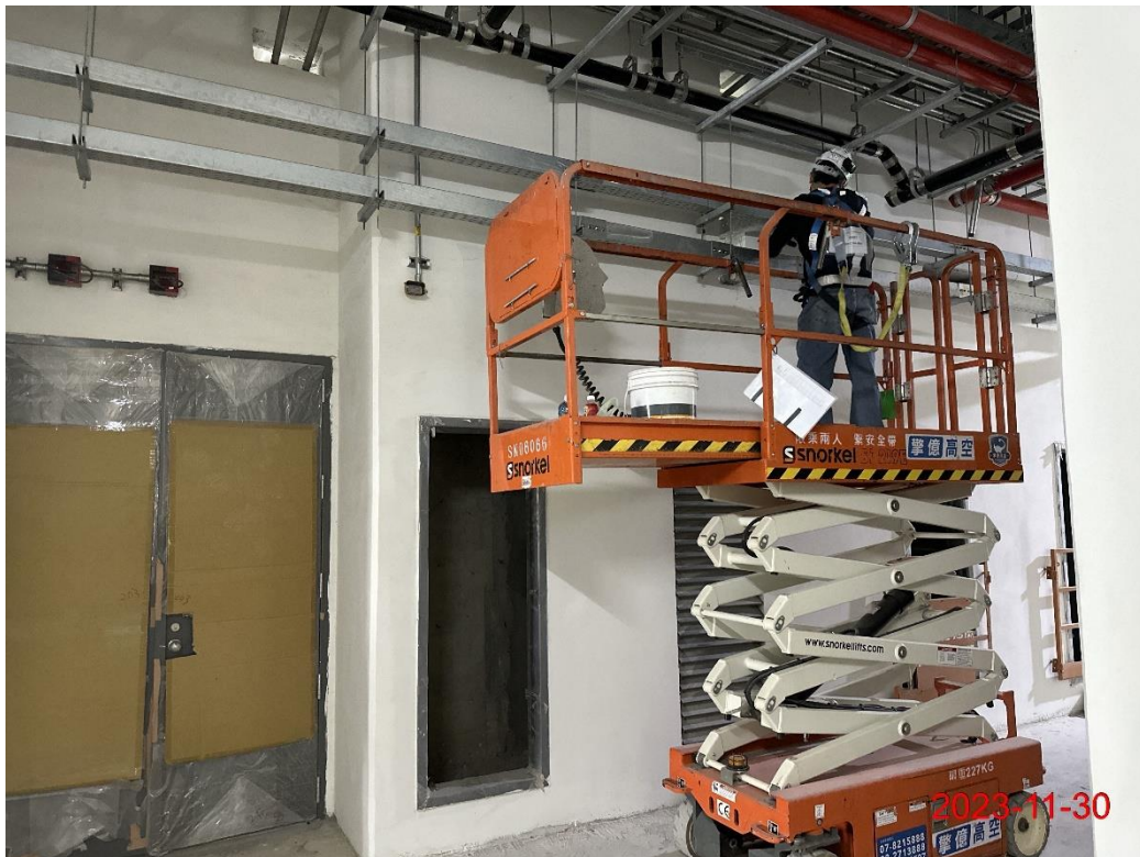
G13 站 COM 線槽施作