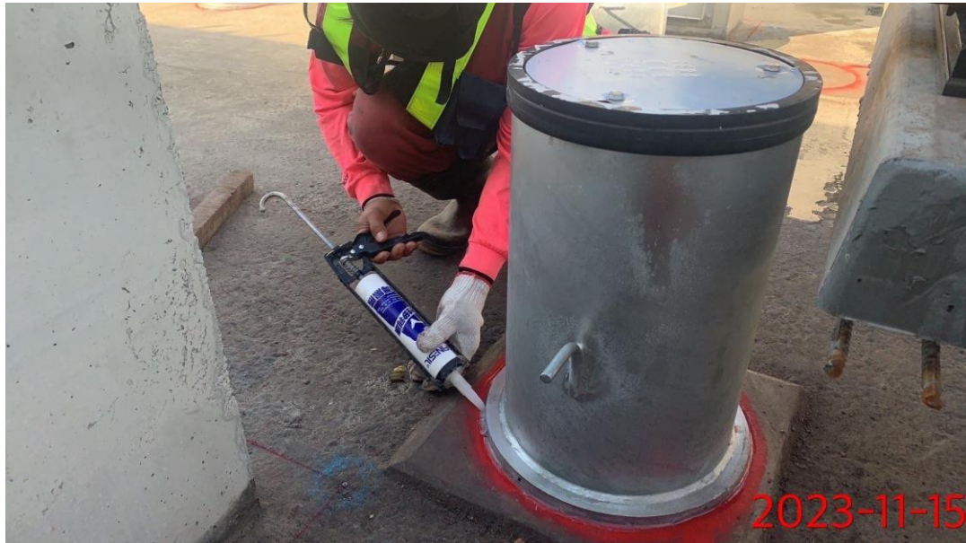
G13a-G14-T28 鋼質彈簧承載面修飾及外筒安裝作業