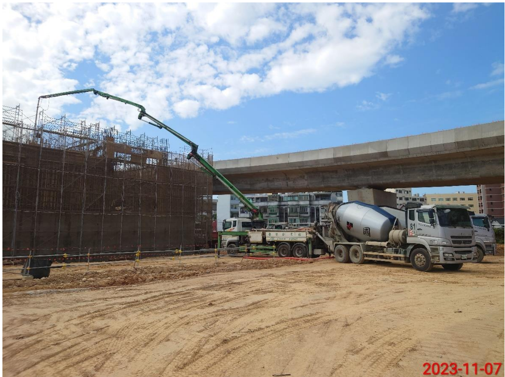
主變電站 1F 第一昇層柱牆及環梁混凝土澆置抽查驗