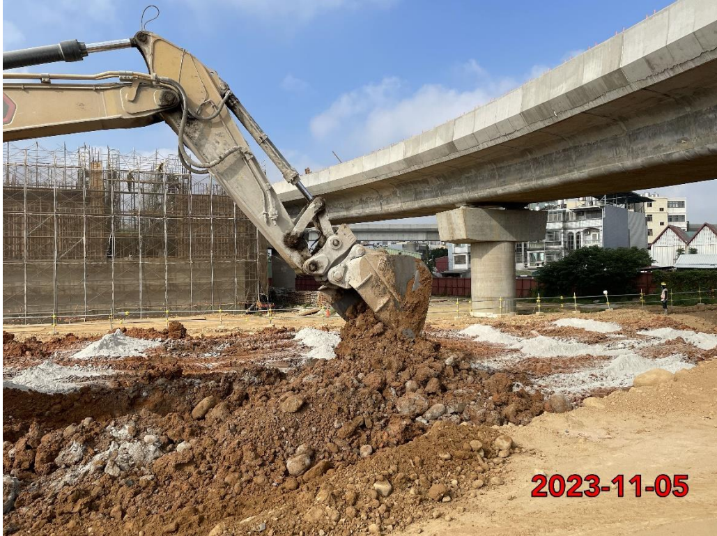
C 區(第四區塊第三層)土方拌合水泥回填作業