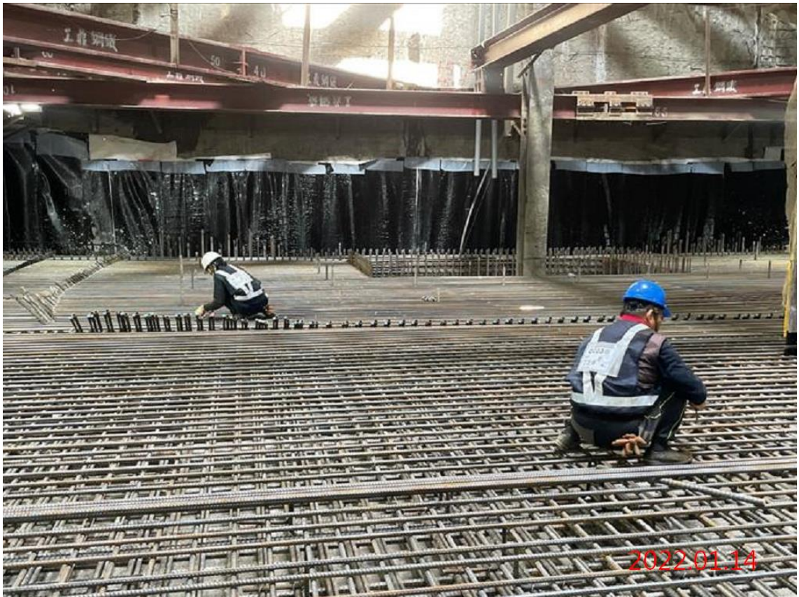
G12 站_站體結構底板鋼筋綁紮