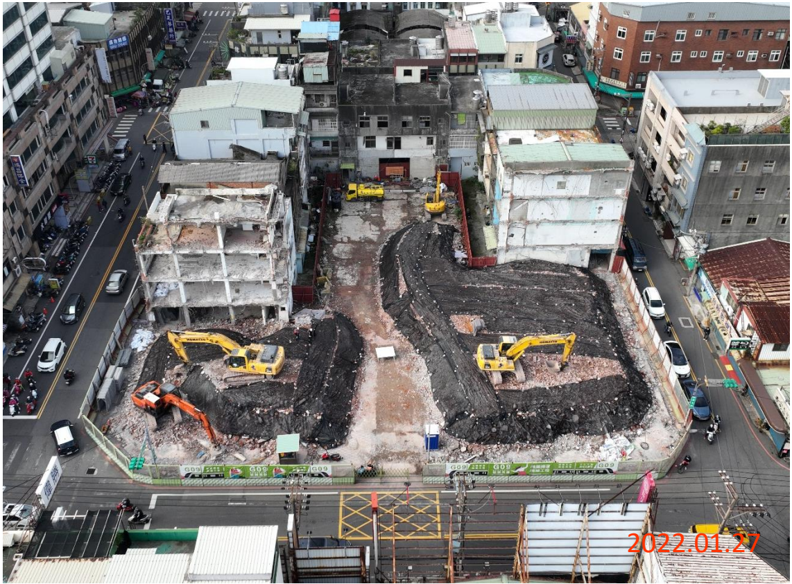
G09 站_中正路側建物拆除