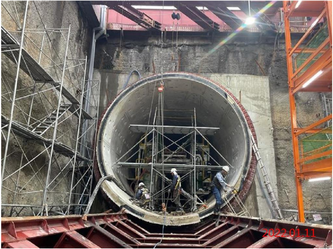
潛盾隧道_上行線設備轉換