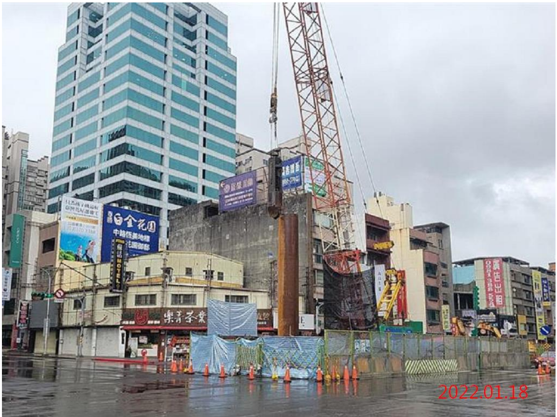
G10 站_站體中間柱抓掘