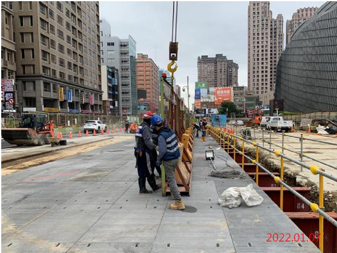
G11 站_站體覆工蓋鈹設置