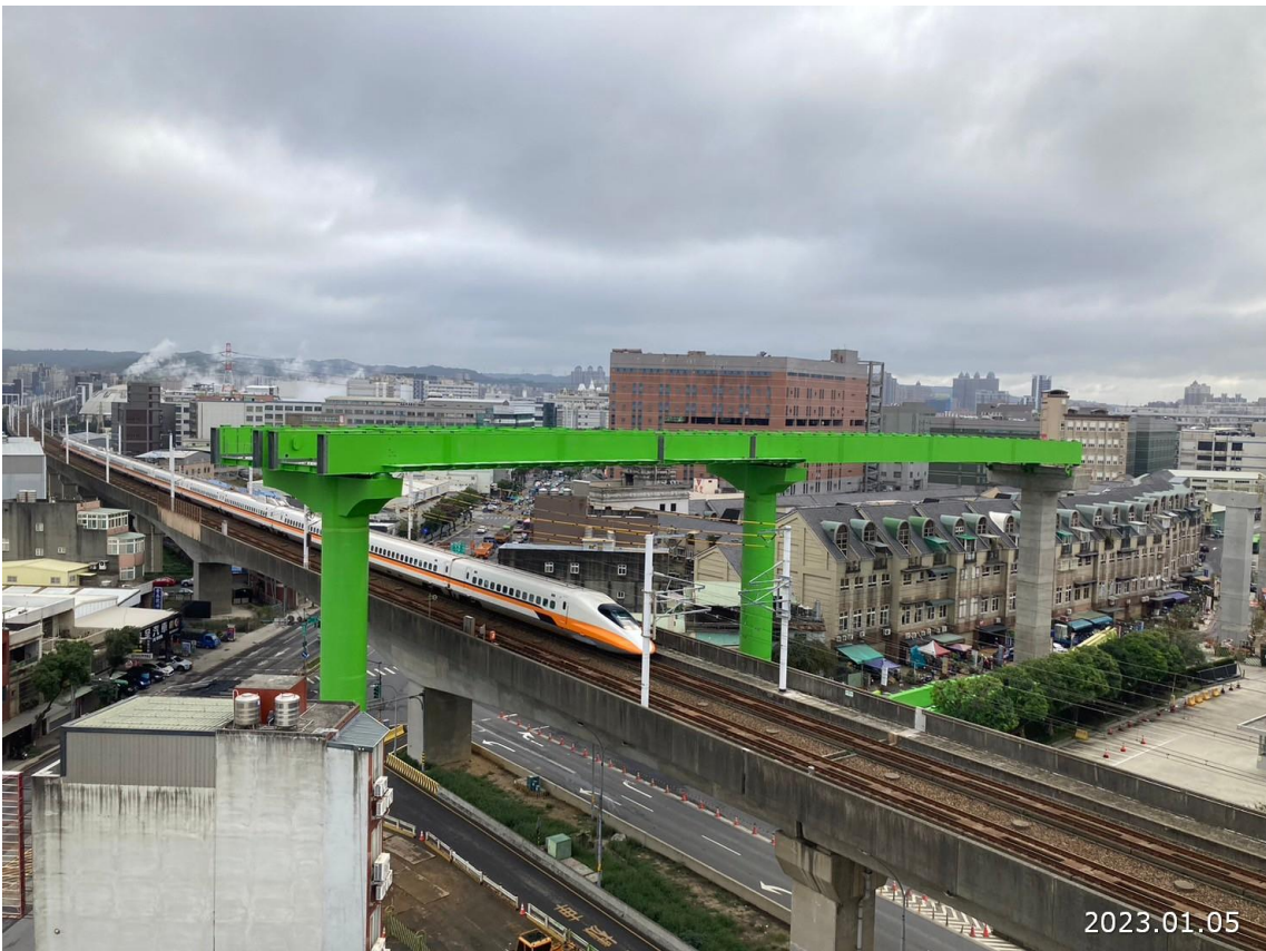
蘆竹南崁路二段 鋼 U 型梁吊裝完成現況照片