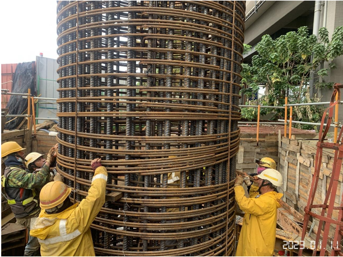
大園三民路二段 墩柱鋼筋綁紮