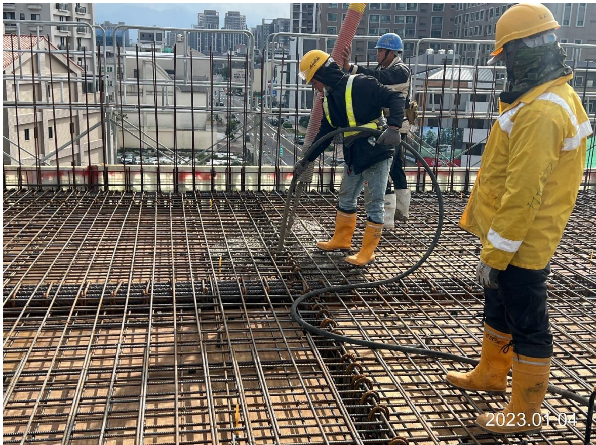
八德新關道路 G02 車站出入口 3 樓柱牆及 RF 版梁混凝土澆置