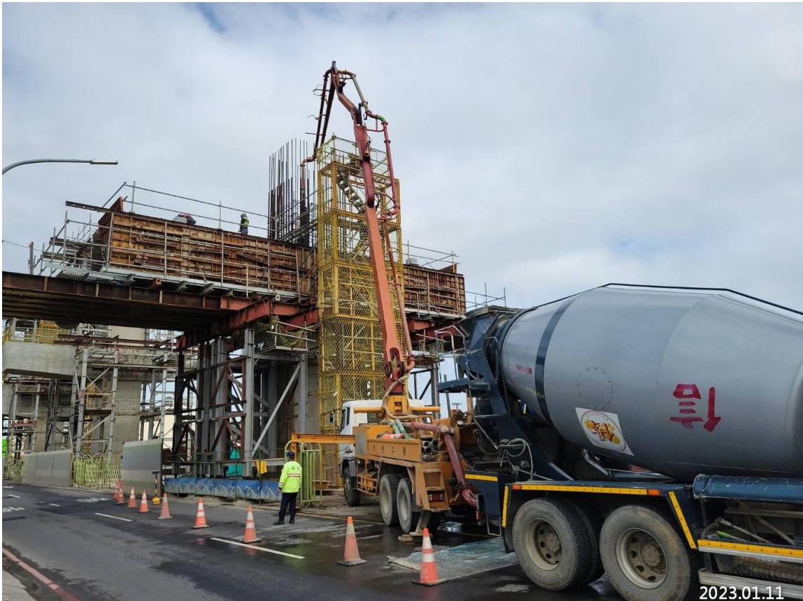
大園三民路段 帽梁鋼筋綁紮