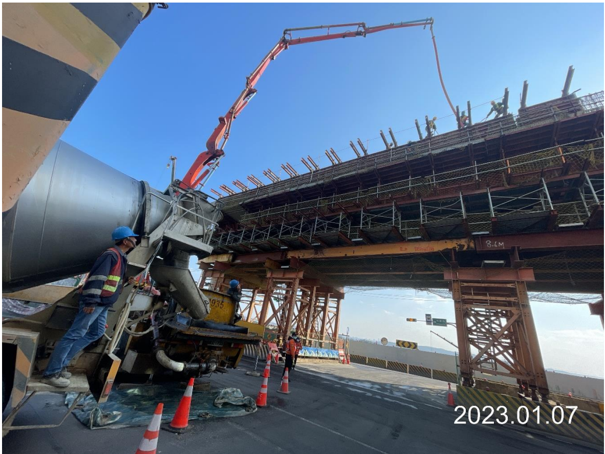
大園坑菓路 場鑄箱型梁混凝土澆置