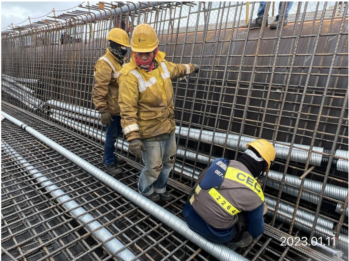
八德新闢道路 場鑄箱型梁預力套管施作