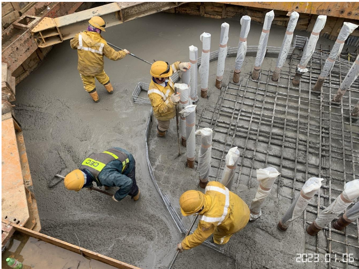
大園三民路二段 樁帽混凝土澆置