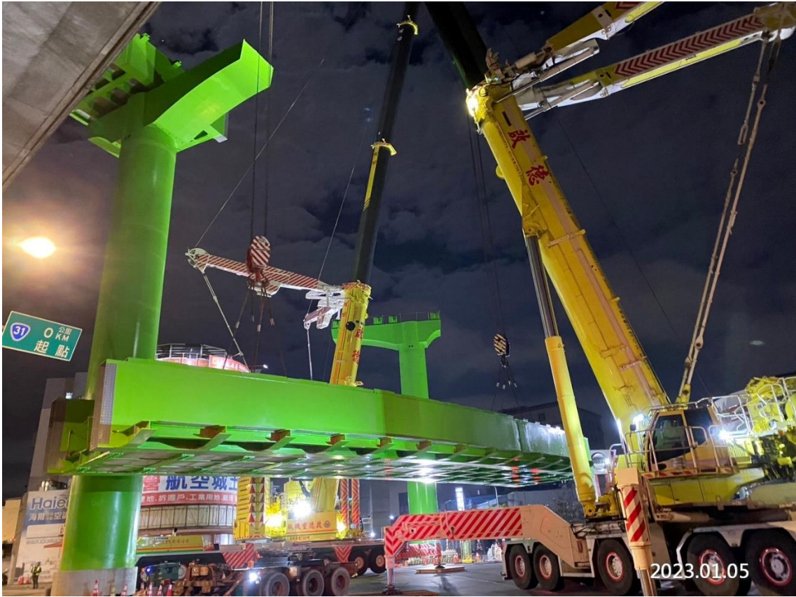
蘆竹南崁路二段 鋼 U 型梁吊裝