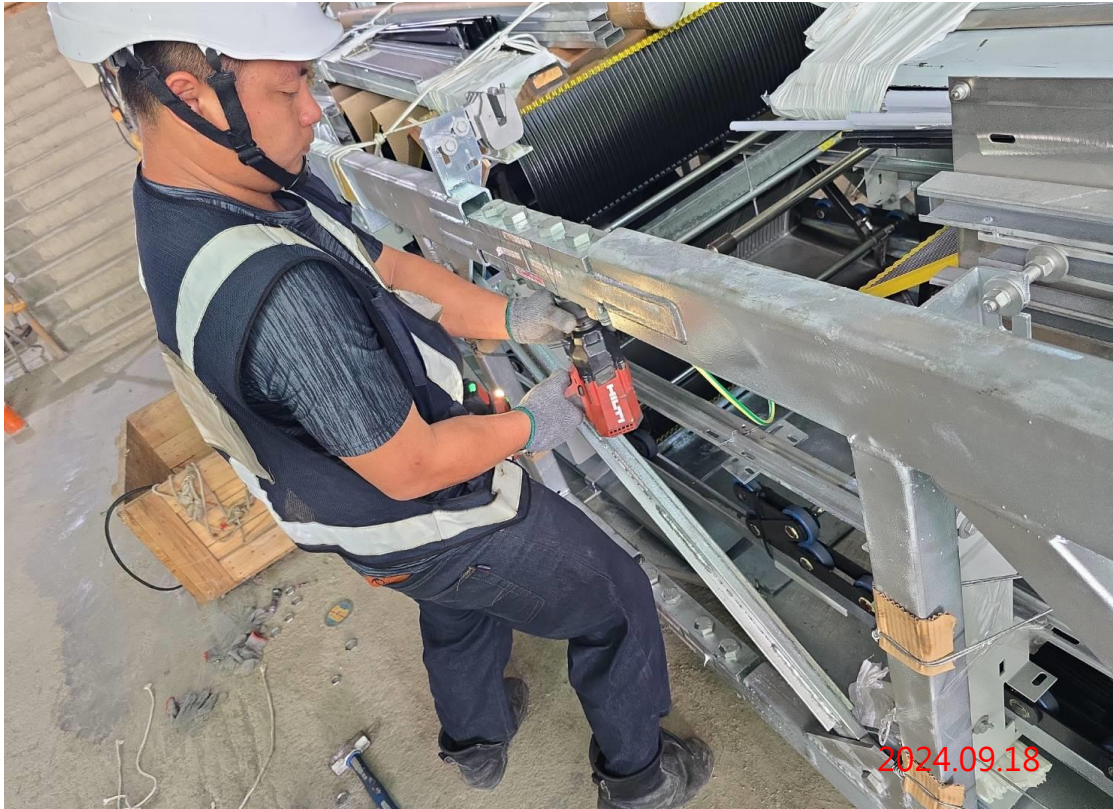
G13a 站-G13-01/02 號電扶梯(出入口一層-出入口二層)吊裝作業