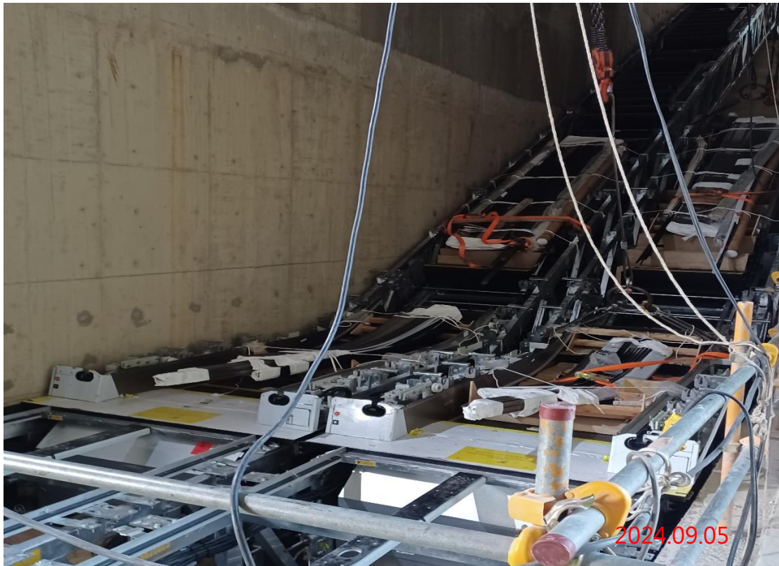
G13a 站-G13-03/04 號電扶梯(出入口二層-出入口三層)吊裝作業