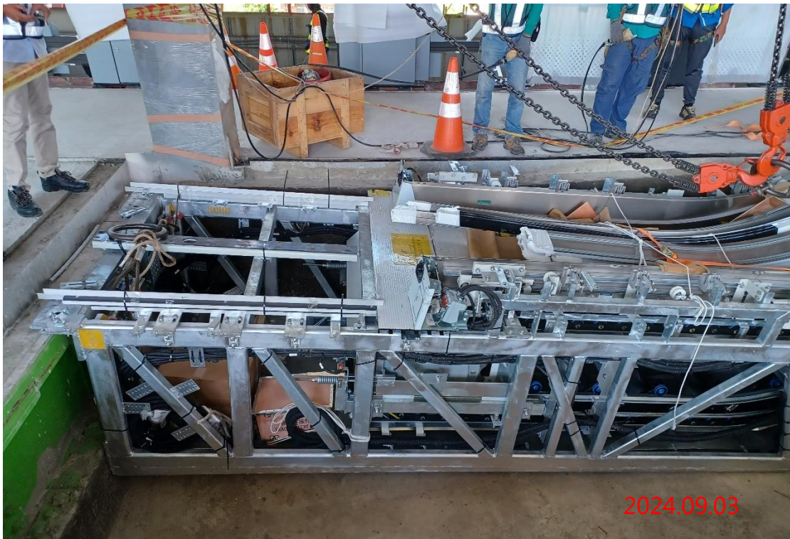
G13a 站-G13-05/06 號電扶梯(月台層-穿堂層)吊裝作業