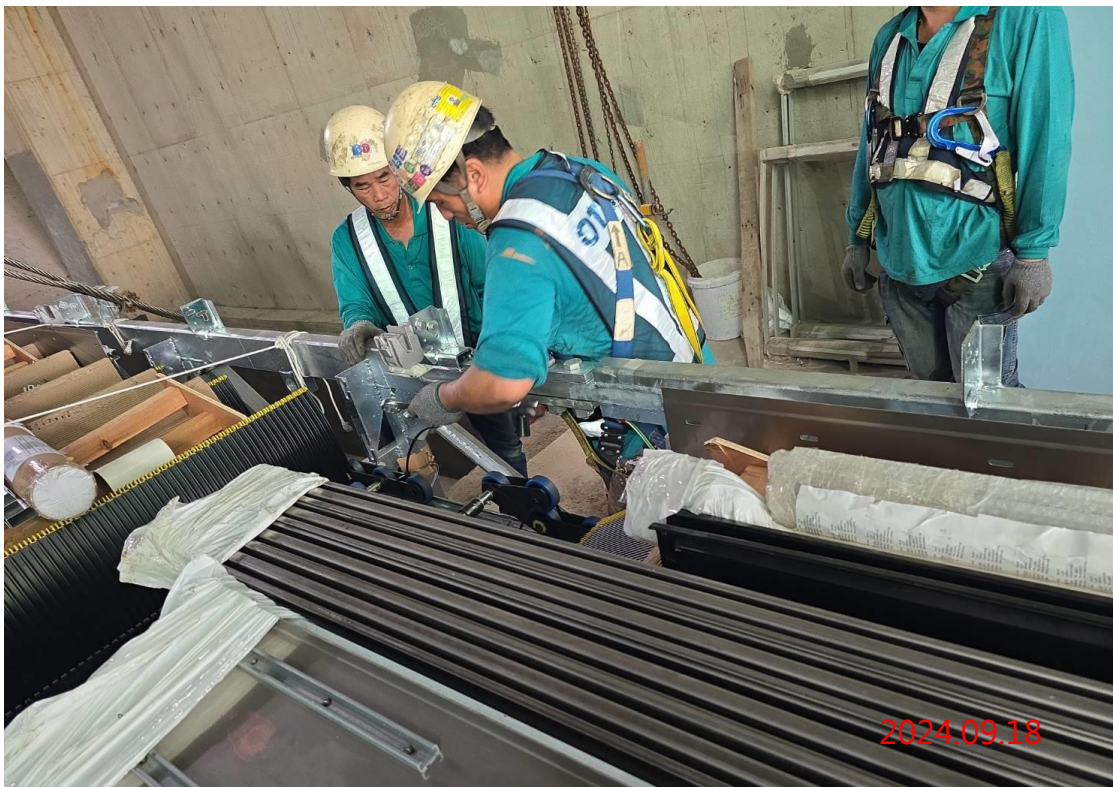
G13a 站-G13-01/02 號電扶梯(出入口一層-出入口二層)吊裝作業