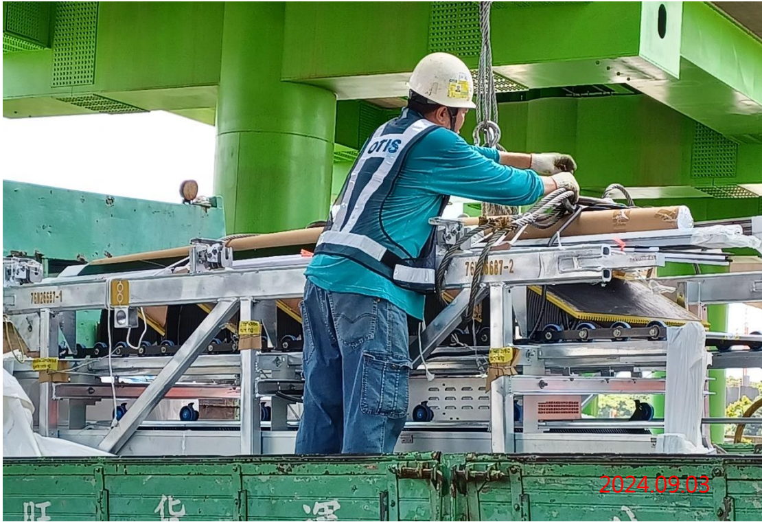
G13a 站-G13-05/06 號電扶梯(月台層-穿堂層)吊裝作業