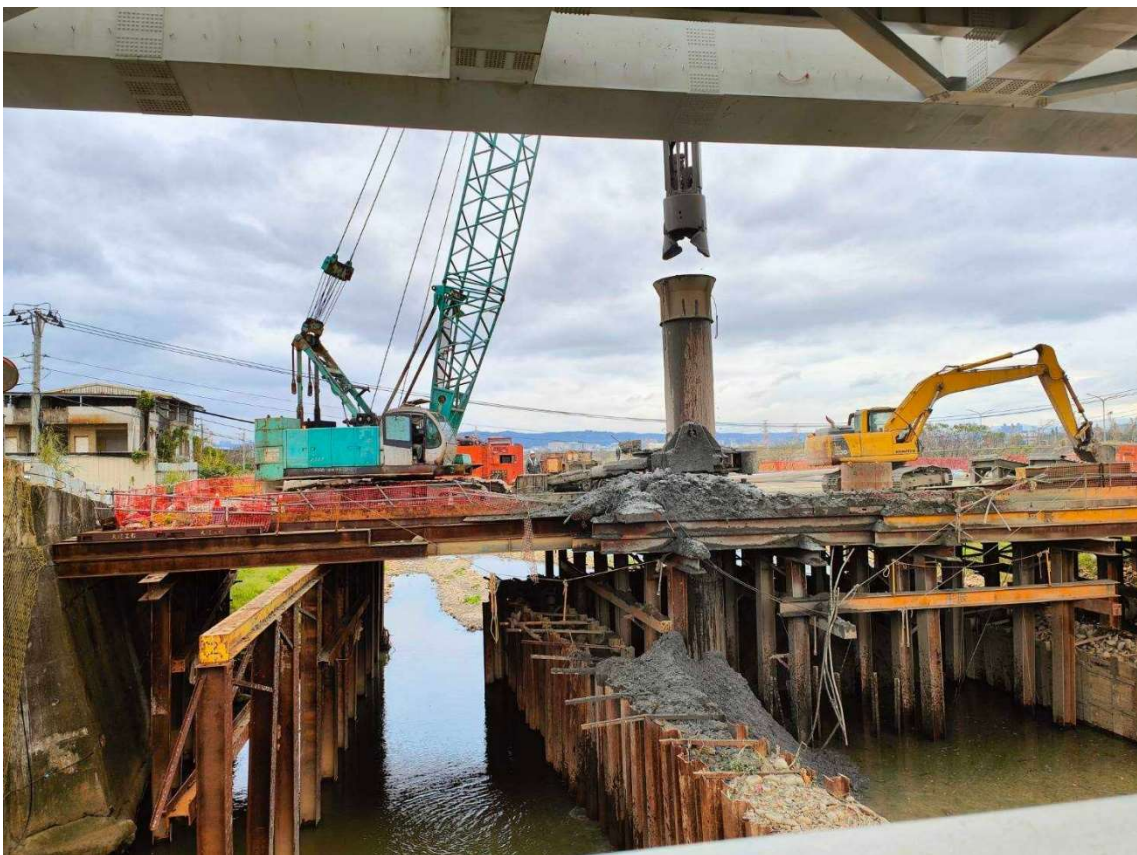
南段_DU31-12 崁下橋 PE1-01 基樁鋼筋籠鑽掘