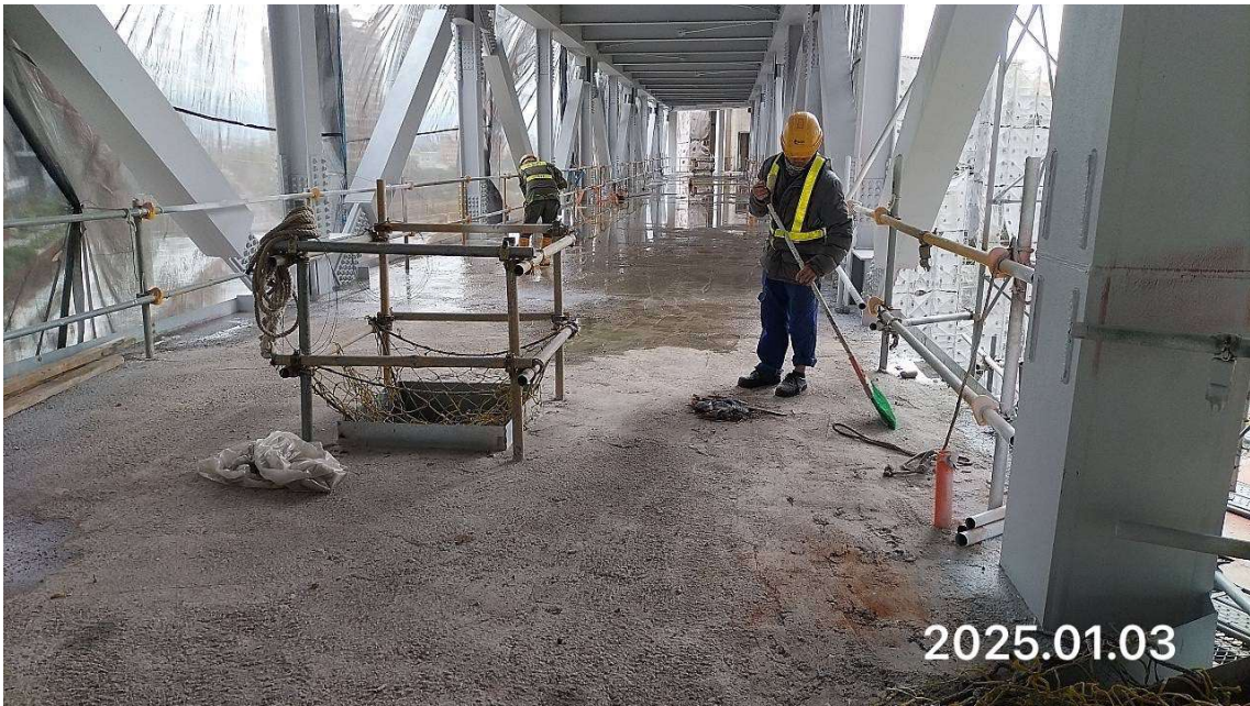
G01 車站站體連通道抽水清潔