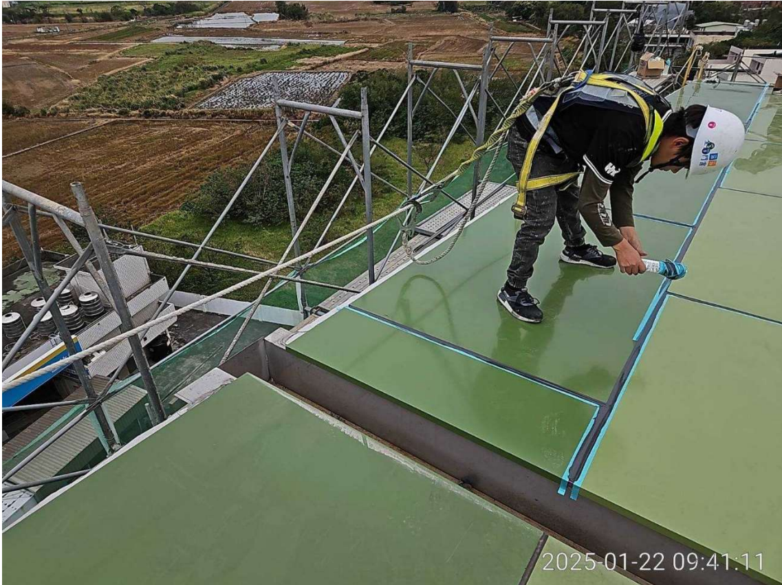
G14 車站站體金屬屋頂板屋面板填縫