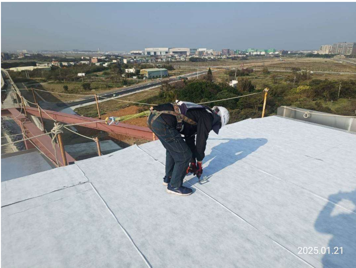
G32 車站站體金屬屋頂板固定件鎖固