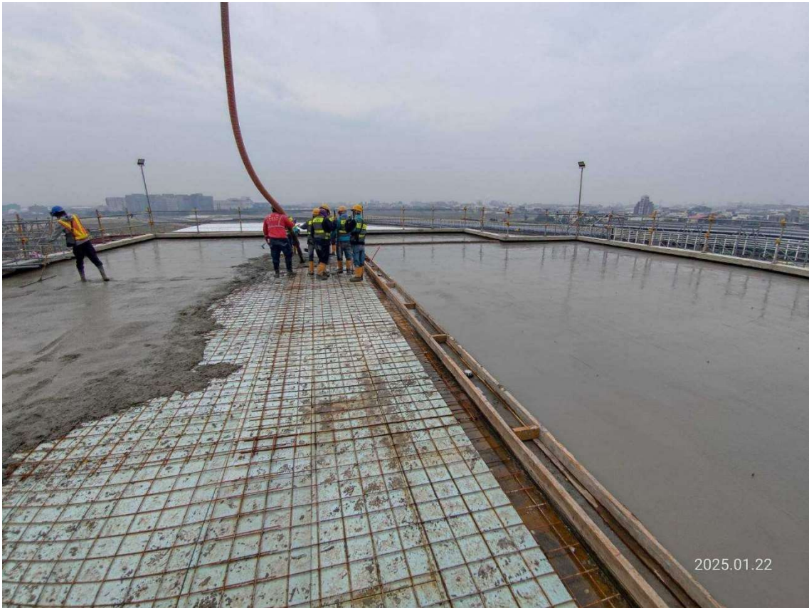
G32 車站出入口五樓及屋頂層墊層混凝土澆置