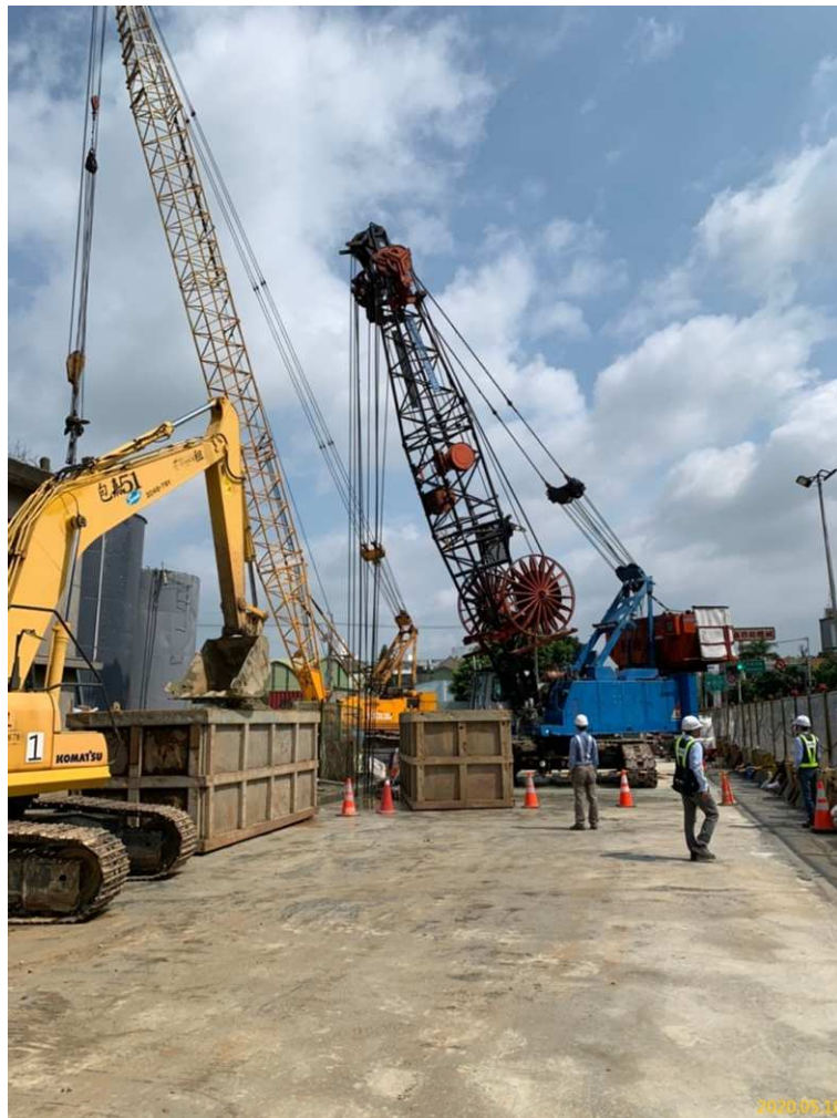
G03 站(巧克力街附近)連續壁單元施作