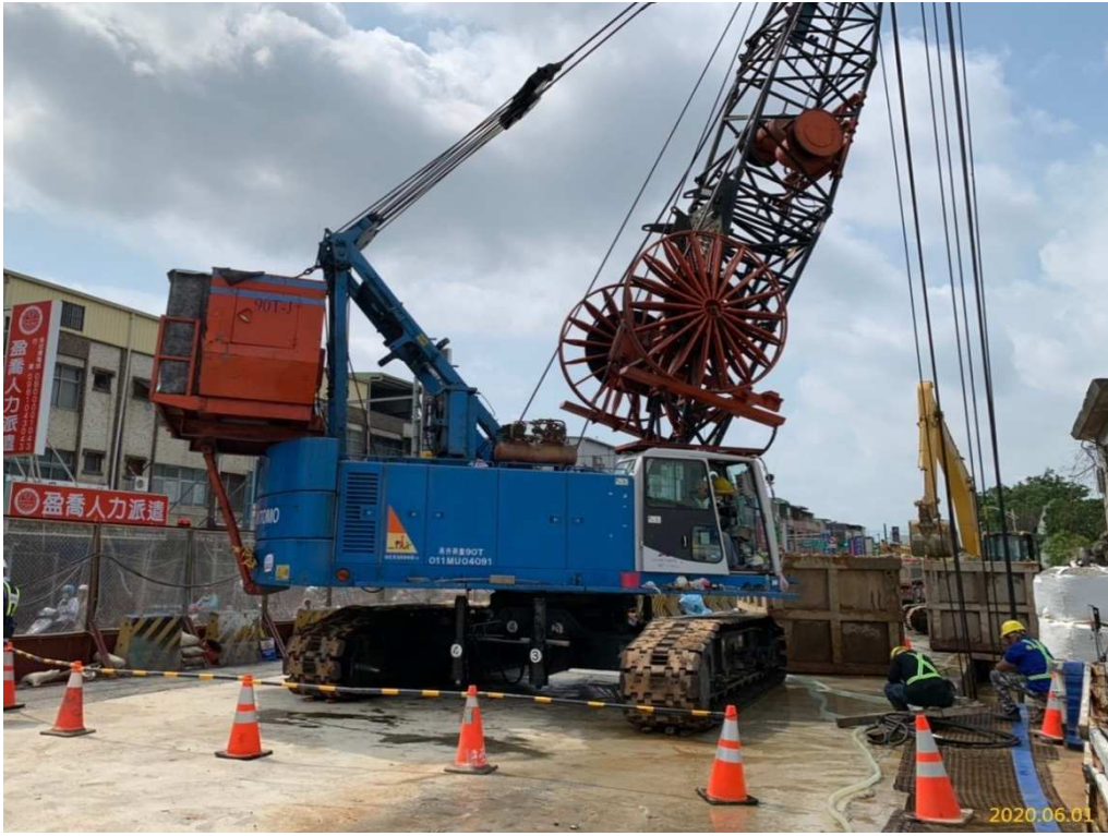
G03 站(巧克力街附近)連續壁單元施作