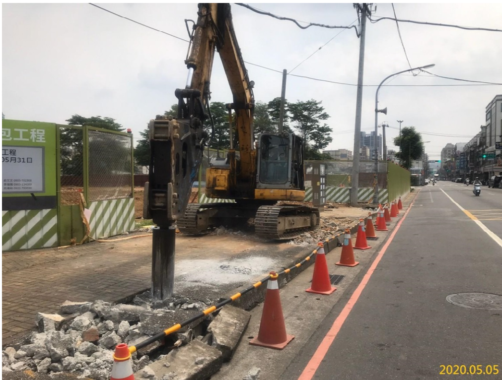
VS6 通風豎井(福豐公園)施工圍籬立柱基礎挖掘