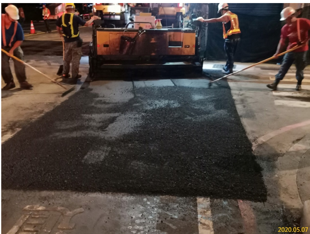
VS5 通風豎井(介壽路中華電信附近)管線試挖 AC 刨鋪