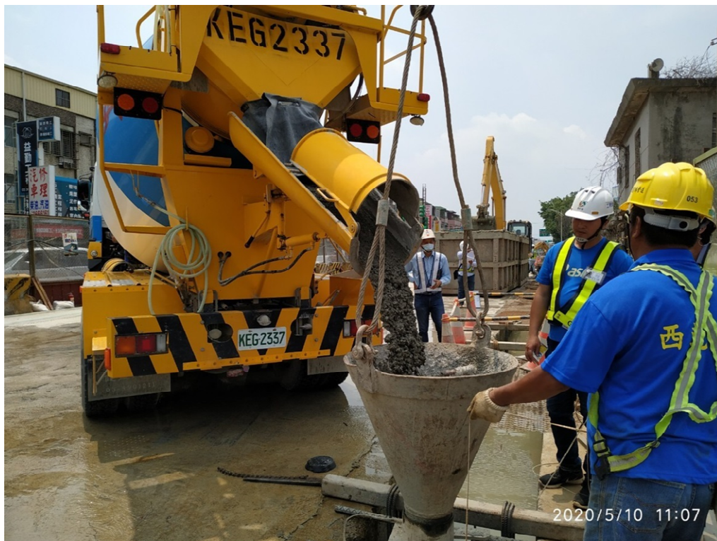
G03 站(巧克力街附近)連續壁單元混凝土澆置