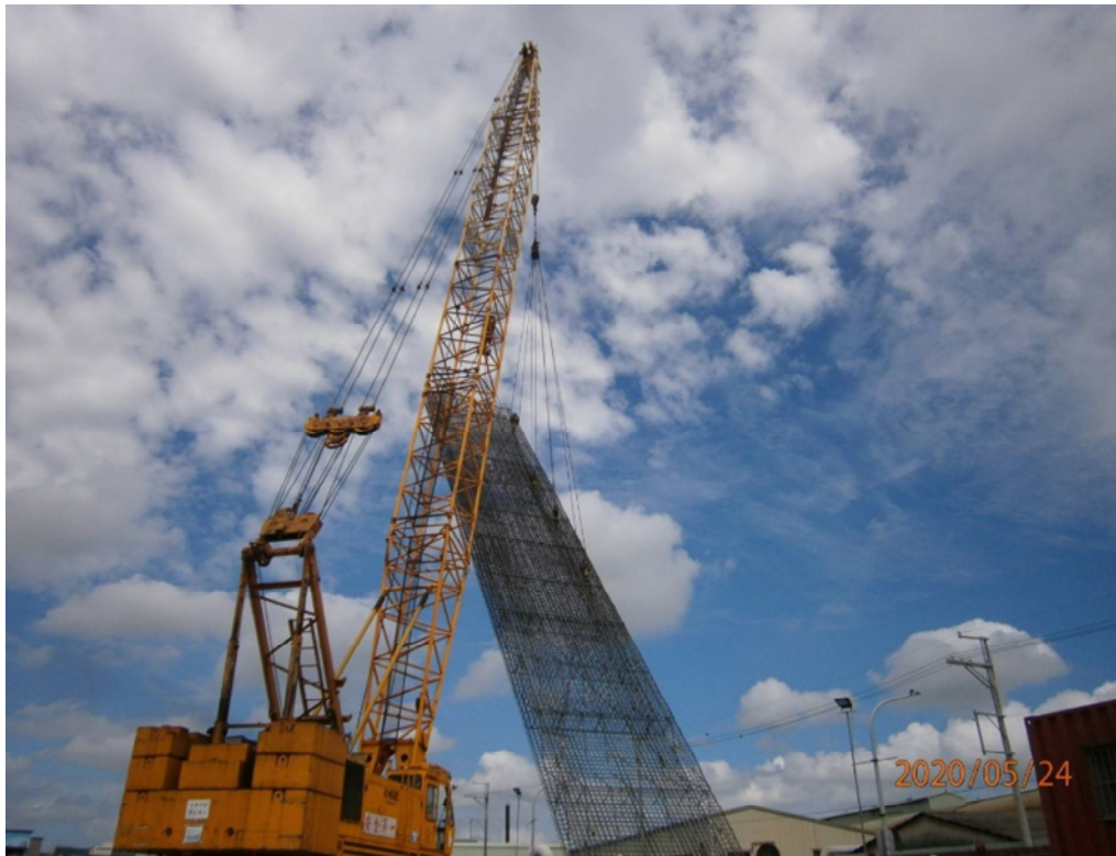
G03 站(巧克力街附近)連續壁單元鋼筋籠吊運