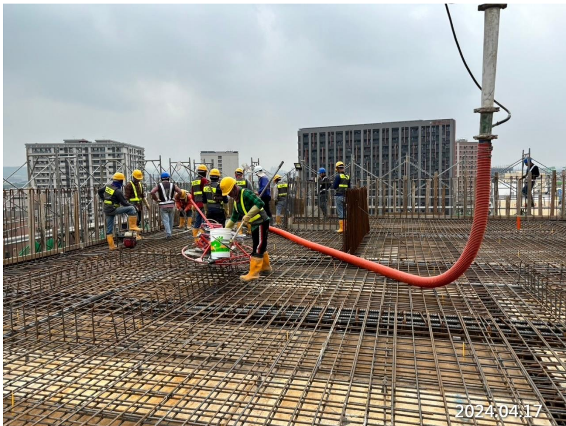
G31 車站出入口二四樓二昇層柱牆及五樓梁版 R.C 澆置