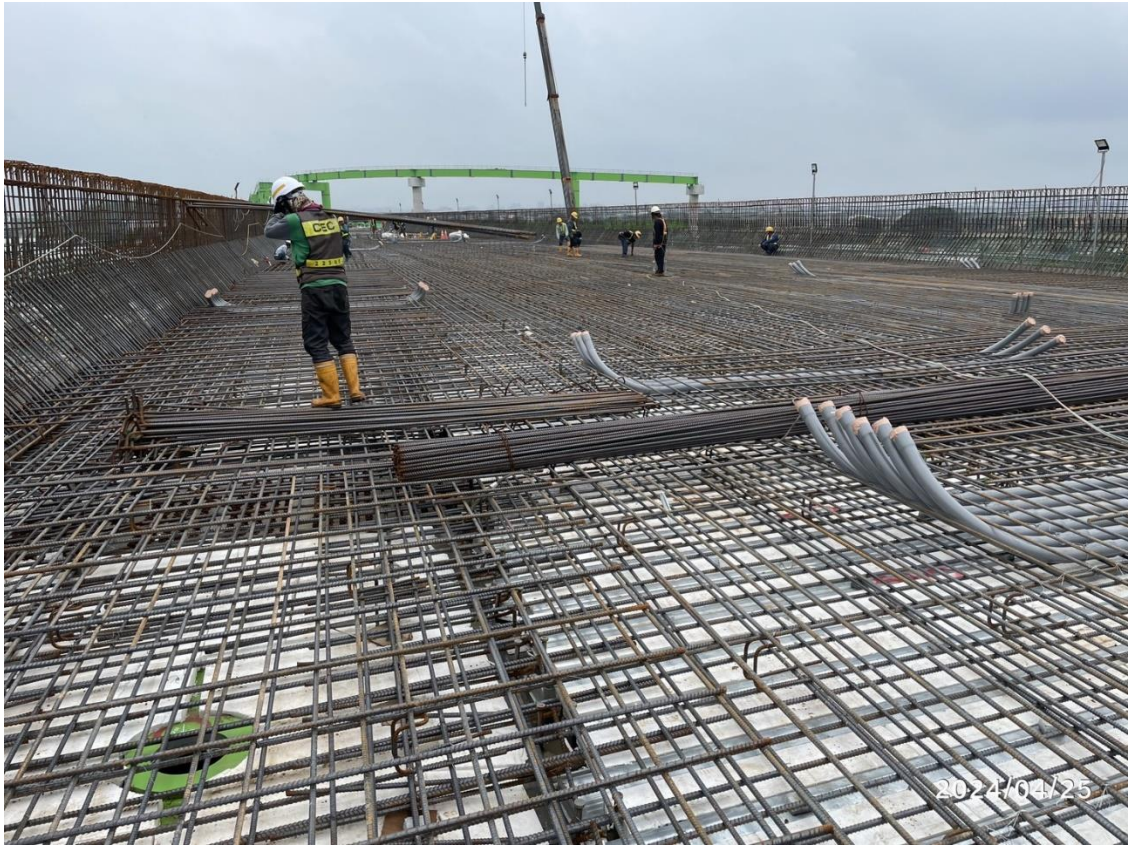
DU14-09 橋面版鋼筋綁紮及吊運