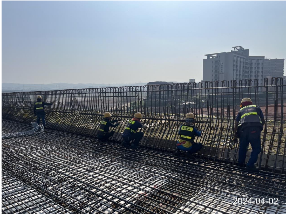
北段上構_DU31-02 橋面版鋼筋吊運及綁紮