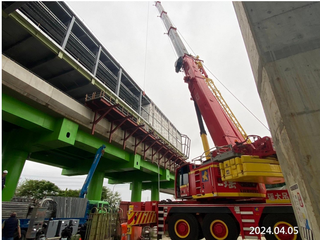
G13 車站站體外牆帷幕施工架搭設