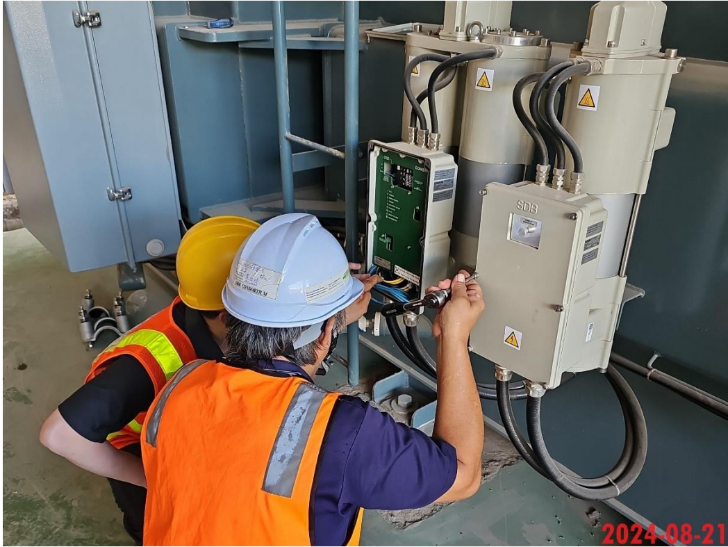
BSS2 變壓器 LCC 接線