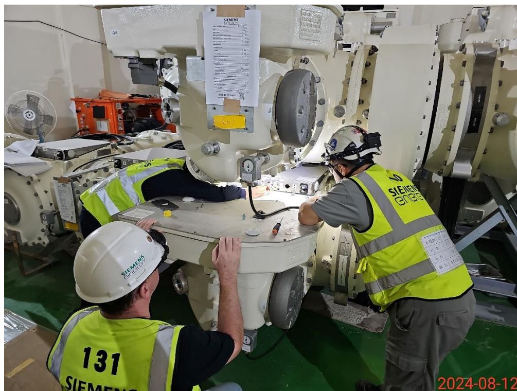
BSS2 GIS 自主測試