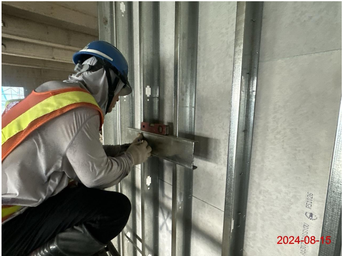
北機廠管理中心 3F 牆內接地系統設備箱配置作業