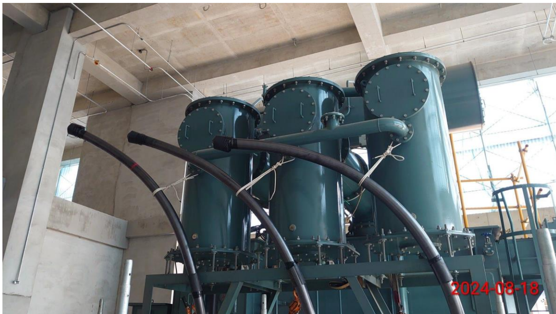
BSS2 161KV 電纜佈纜拉線