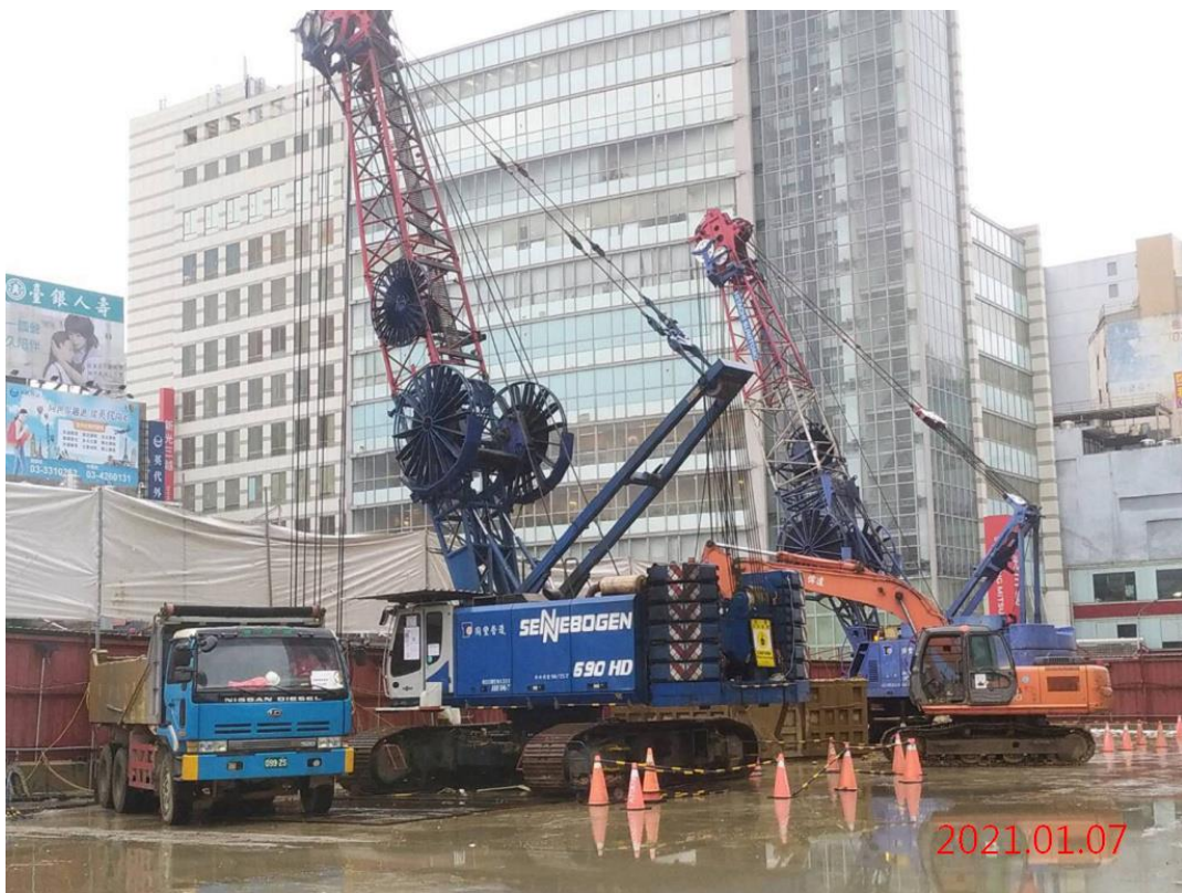
G07 站_連續壁單元抓掘