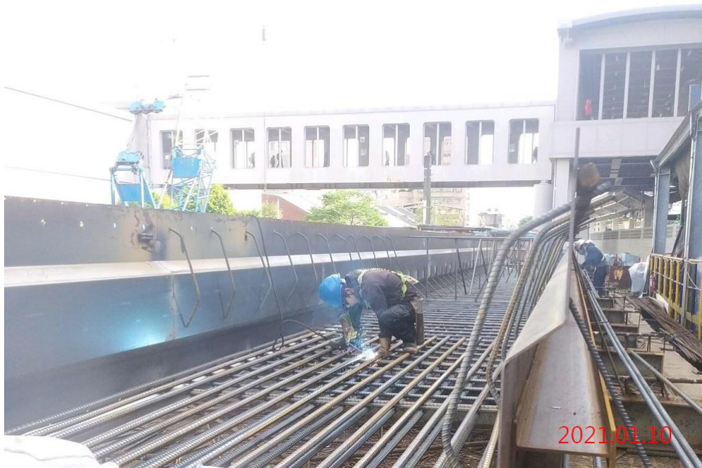
G07 站_連續壁單元鋼筋籠紮筋