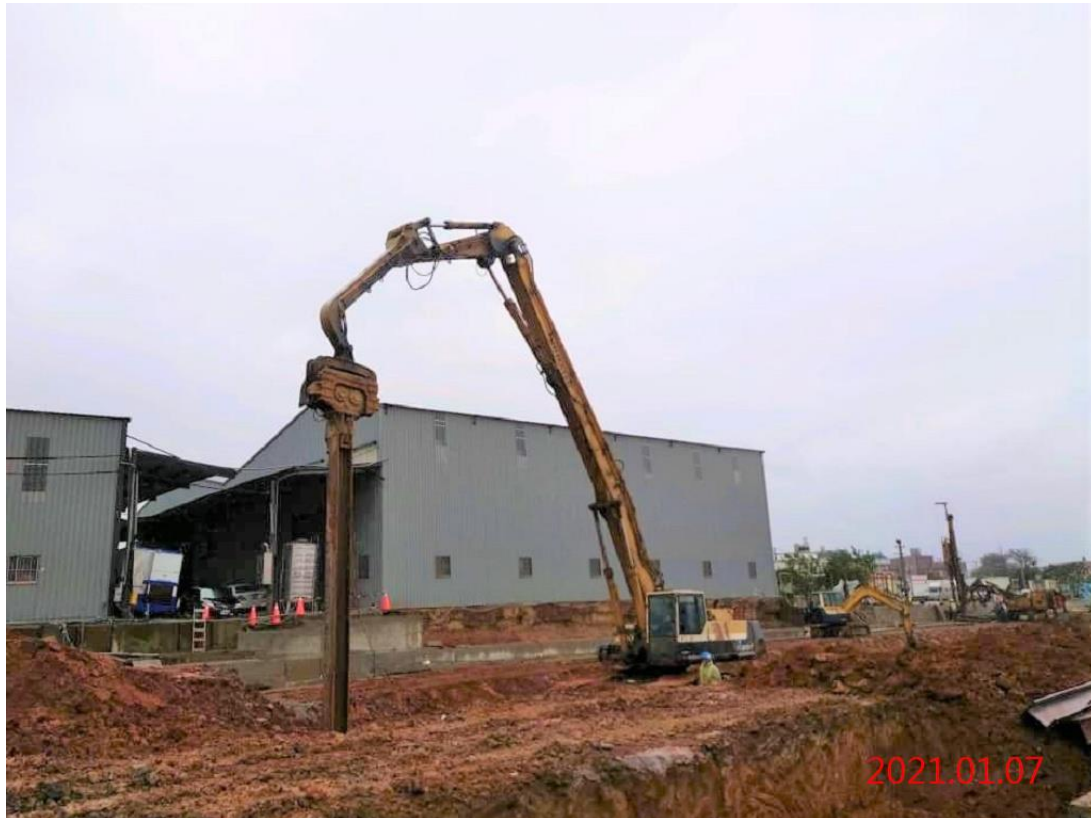
北出土段_中間柱 H 型鋼樁打設