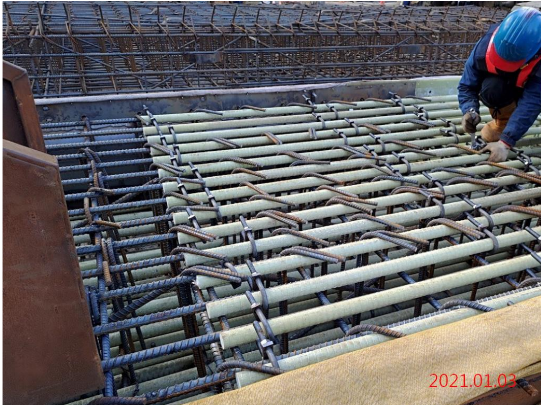
G11 站_連續壁鋼筋籠綁紮