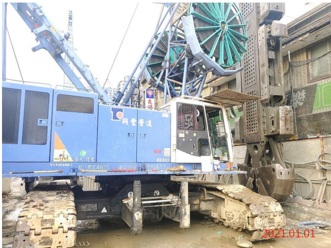
G10 站_連續壁單元抓掘