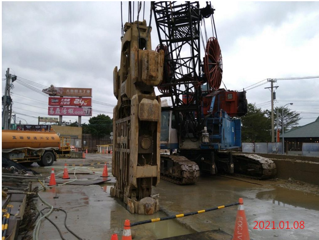
G12 站_出入口連續壁抓掘