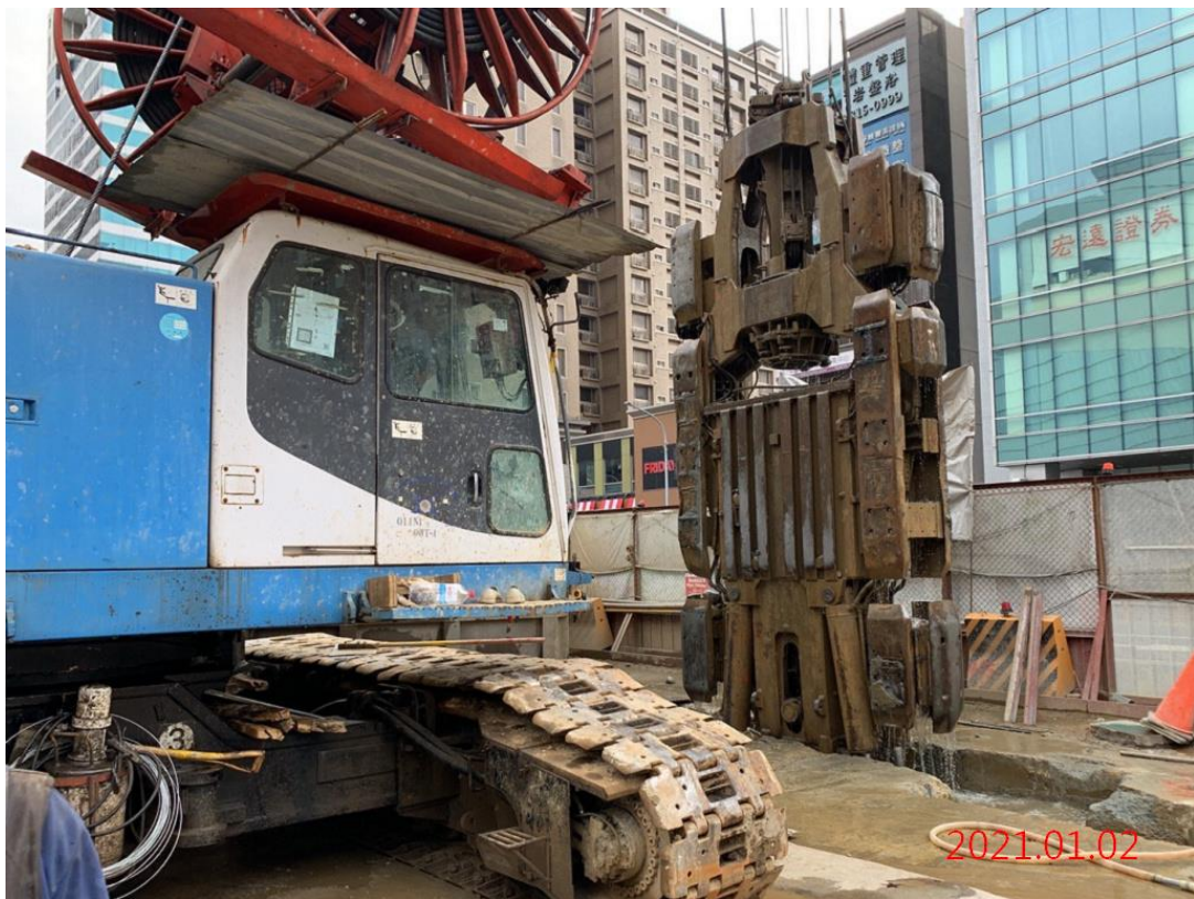
G11 站_連續壁單元抓掘