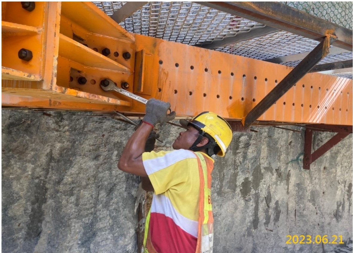
VS5 通風豎井支撐架設