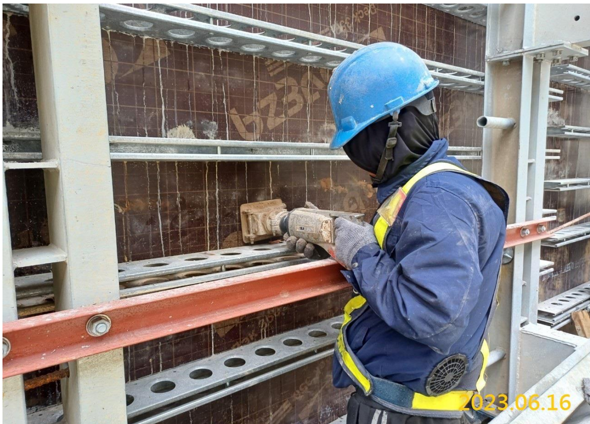
南出土段結構體施作