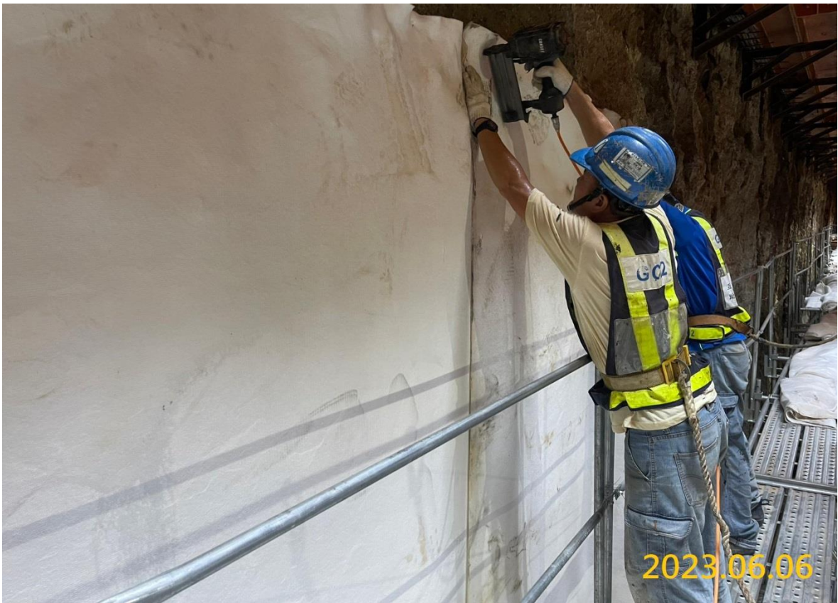
G03 站結構體牆身防水膜施作