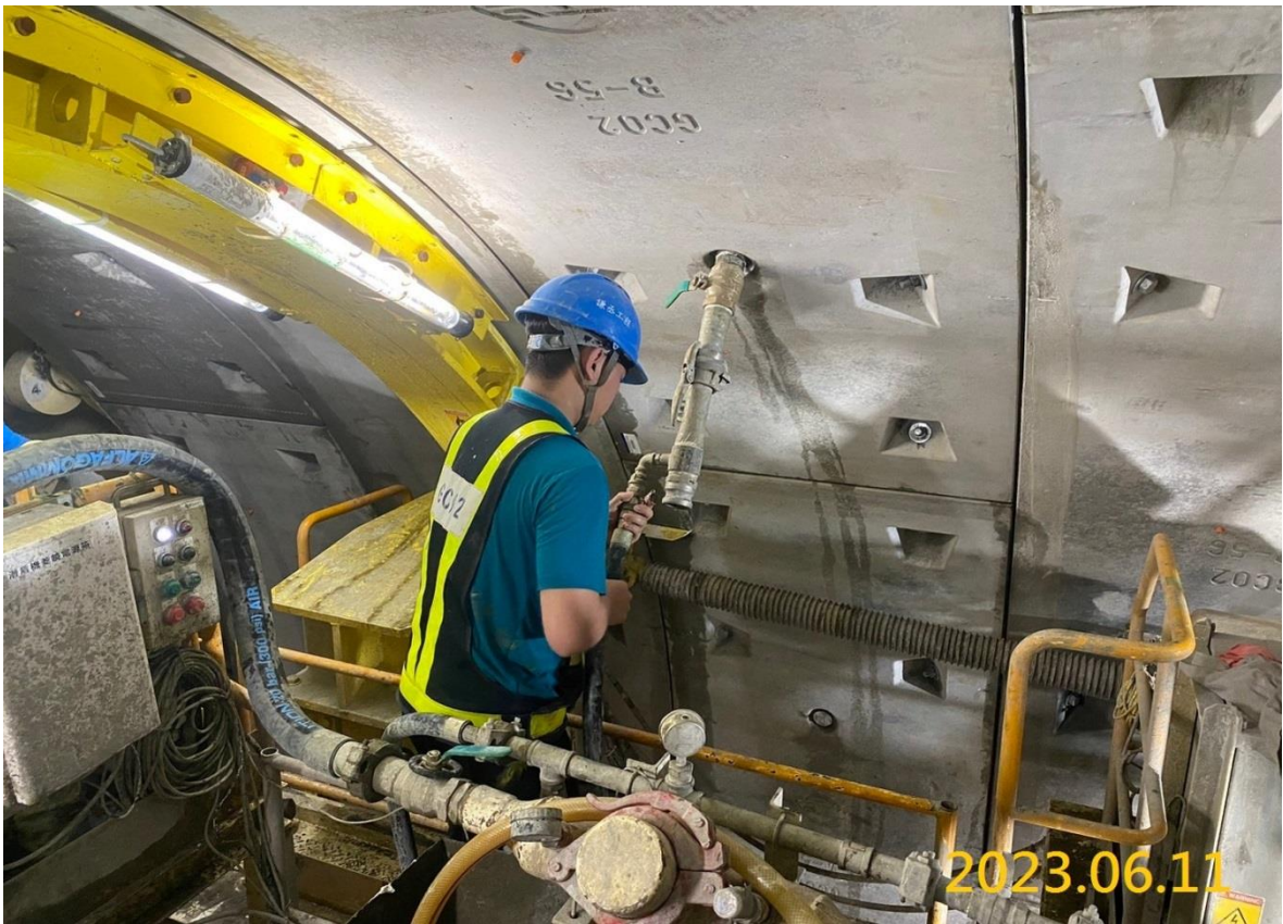
G03 站潛盾隧道掘進作業