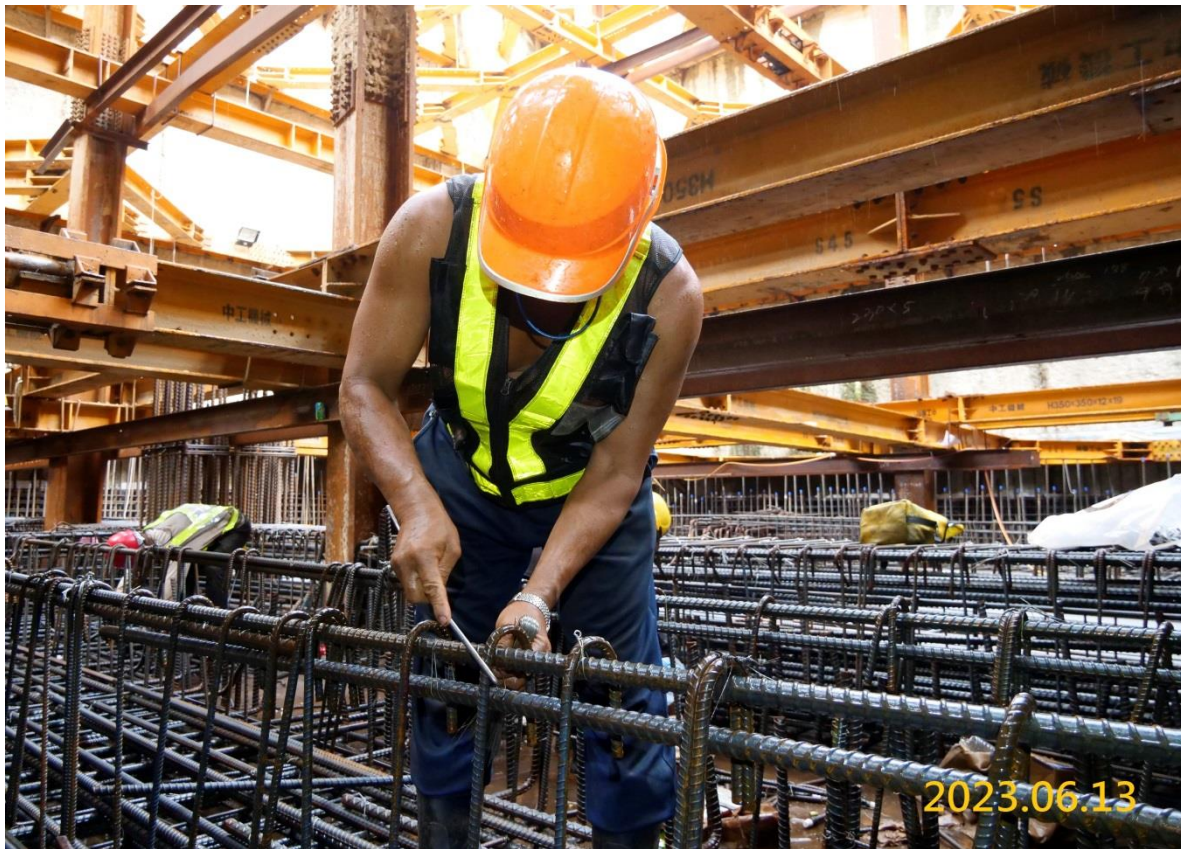
VS6 通風豎井結構體鋼筋綁紮