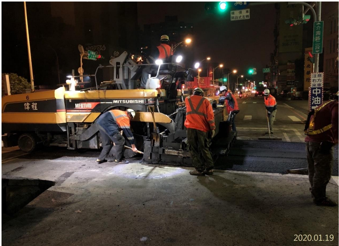
G04 站(八德區介壽路大潤發附近)管線試挖範圍路面 AC 修復