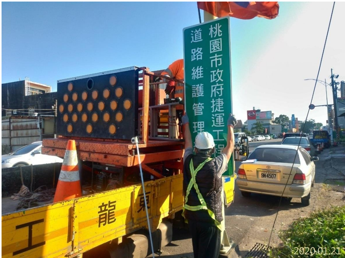
工區範圍道路維護(養護)牌面架設