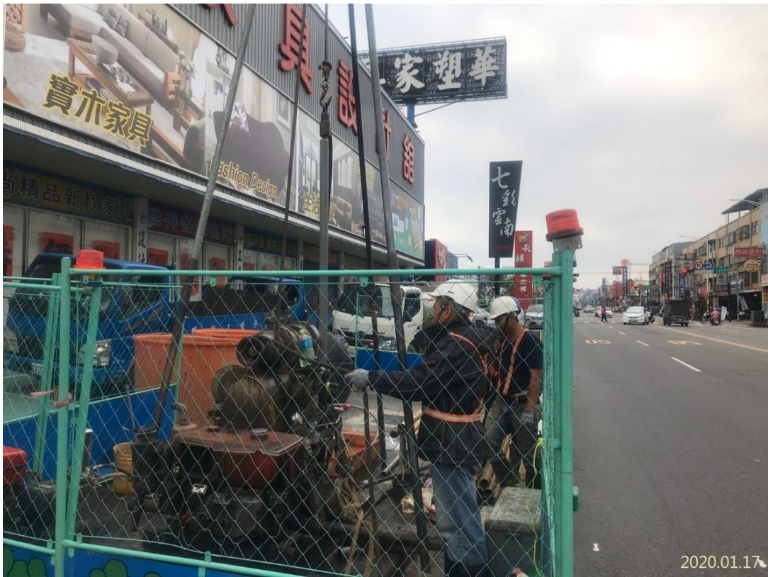
八德區介壽路二段 167 號補充地質鑽探調查