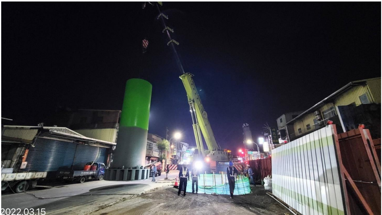
蘆竹南崁路二段 鋼墩柱吊裝