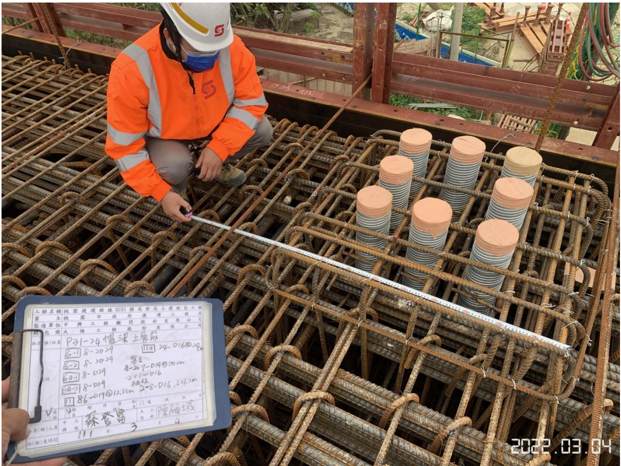
大園坑菓路 帽梁鋼筋查驗