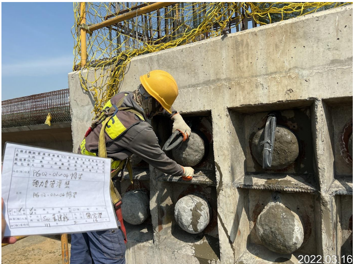
八德新闢道路 帽梁預立套管灌漿