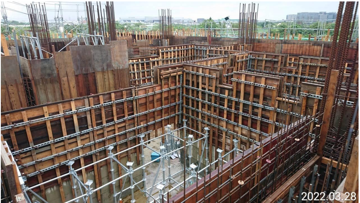
大園坑菓路 G32 車站出入口 2 樓柱牆模板組立