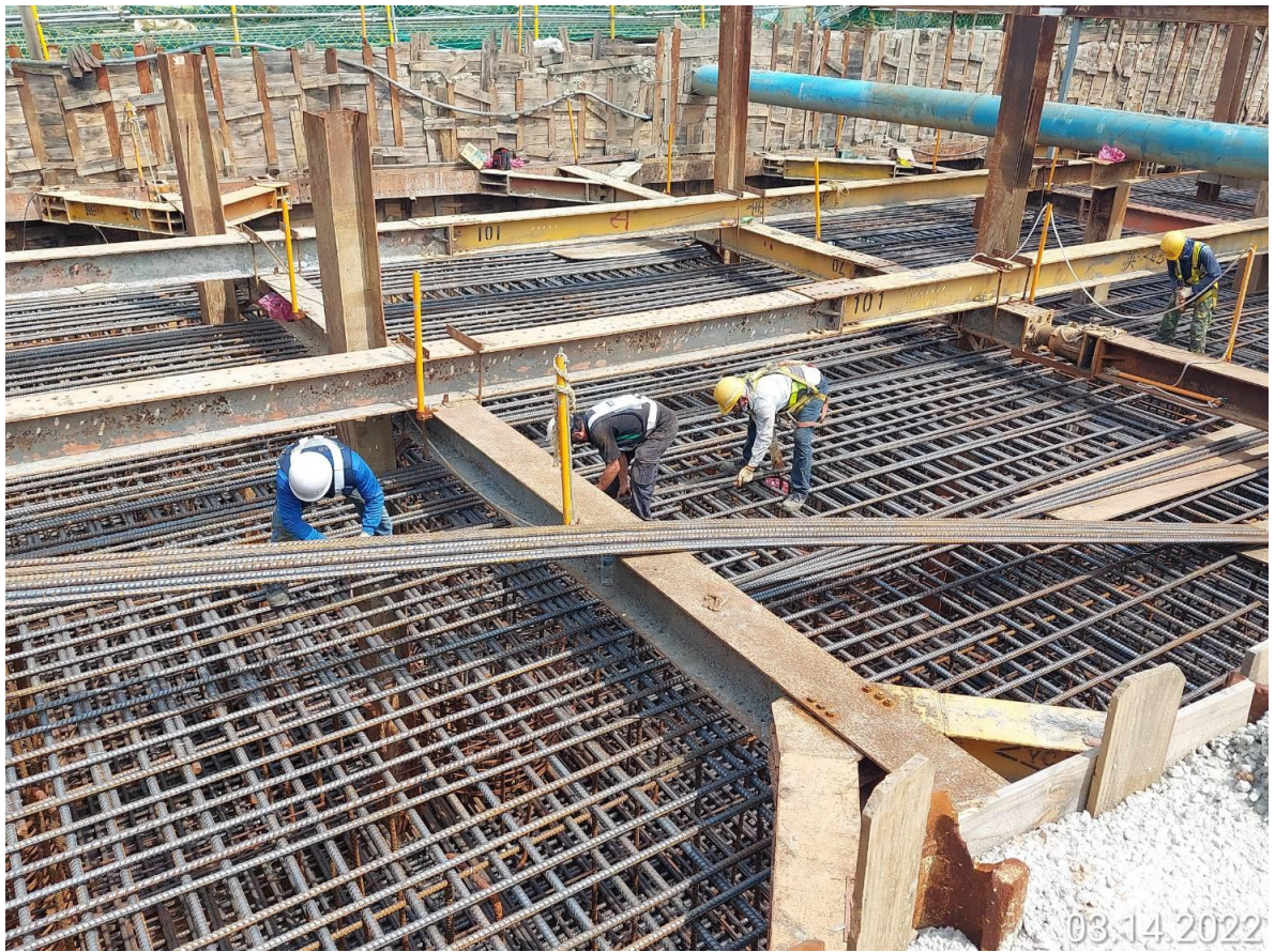
大園三民路二段 樁帽鋼筋綁紮