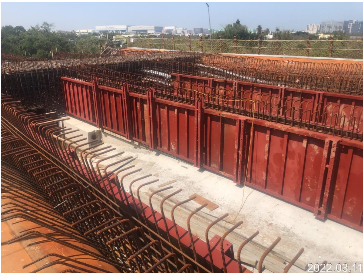
大園坑菓路 場撐箱型梁鋼筋綁紮