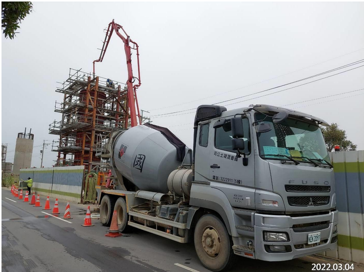
大園坑菓路 墩柱混凝土澆置