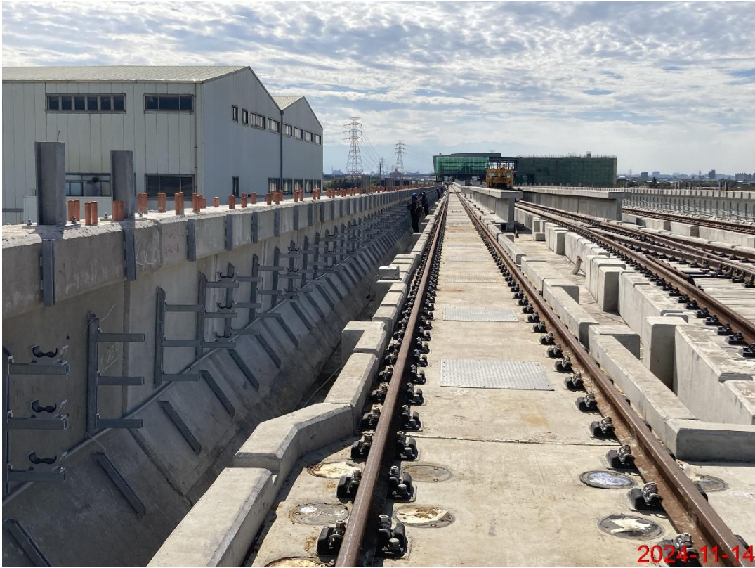
G13a-G14 站間上下行軌旁電纜支架安裝