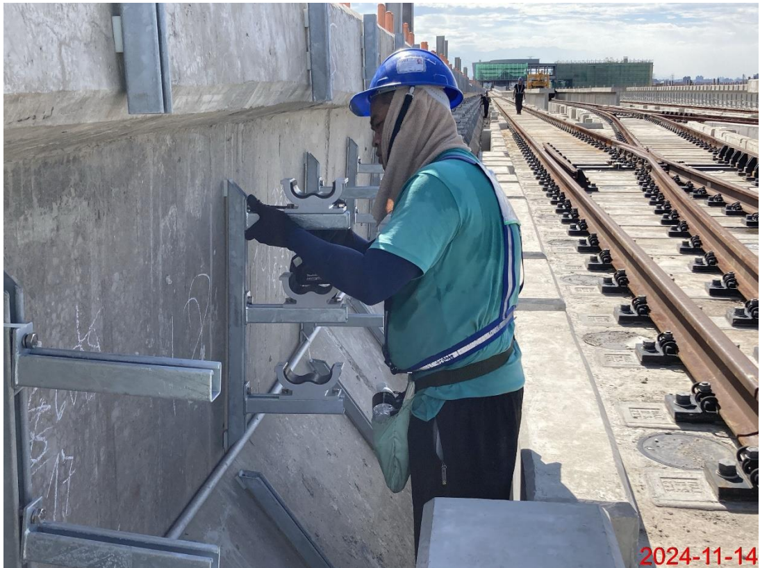
G13a-G14 站間上下行軌旁電纜支架安裝